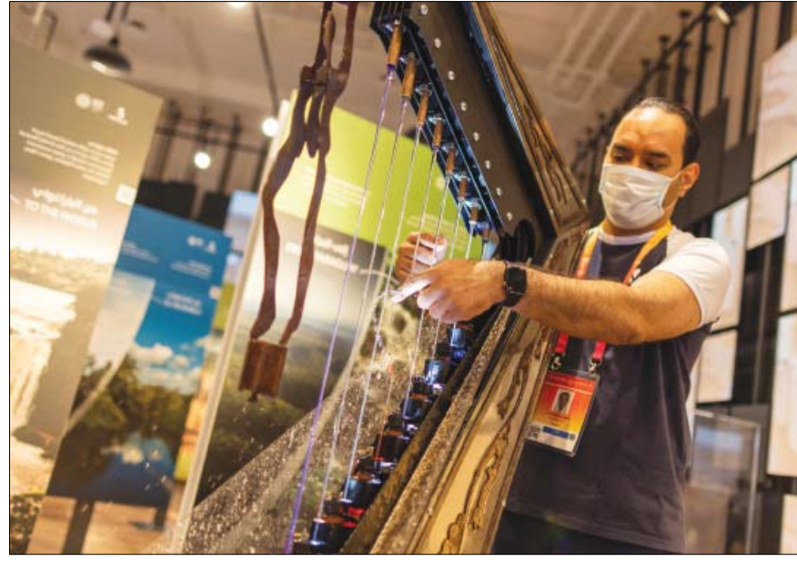
قيثارة الماء تمنح المياه صوتاً موسيقياً عذباً في جناح الباراغواي