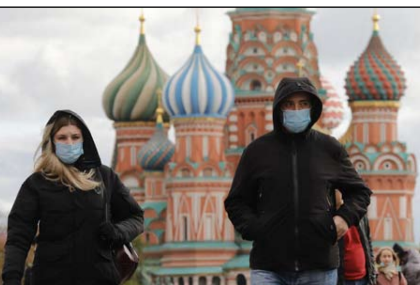
موسكو-وام: تجاوزت حصيلة الوفيات بفيروس كورونا المستجد في روسيا أمس حاجز الـ 145 ألف حالة وفاة بعد تسجيل 786 حالة جديدة خلال يوم واحد في أعلى حصيلة وفيات منذ بداية الجائحة ليبلغ العدد الإجمالي 145 ألفاً و278 حالة وفاة. وأعلنت غرفة العمليات الخاصة بمكافحة الفيروس المواطنين، حيث أثرت تساؤلات عديدة حول إمكانية مواجهة هذه العناصر بعدد من القوانين التي أصدرها البرلمان لمواجهة قوى الشر والإرهاب. ومن جانبه جدد وزير الأوقاف المصري محمد مختار جمعة تحذيراته بشأن تنامي الخلايا النائمة من تنظيم الإخوان في المؤسسات الحكومية وأكد في تصريحات للصحافة المحلية، مطلع الأسبوع، أن خلايا الإخوان تعيد إنتاج نفسها، وتشكل ما يشبه المافيا داخل المؤسسات الحكومية، وتسعى لإثارة الأزمات وتعطيل المصالح وعرقلة محاولات التنمية والاستقرار. وأشار الوزير المصري إلى أن الجماعة تمول هذه الخلايا وتدعمها وتخطط لها لتنفيذ أهدافها باستغلال تواجد عناصرها داخل المؤسسات الحكومية.

بروسيا - في تقريرها اليومي - عن انخفاض عدد الإصابات الجديدة خلال الساعات الـ 24 الماضية بتسجيلها 23827 إصابة مقارنة بـ 24702 في اليوم السابق ليبلغ بذلك إجمالي عدد الإصابات خمسة ملايين و857 ألفاً وإصابتين، بينما تماثلت 21269 شخصاً للشفاء خلال الـ 24 ساعة الماضية، ليبلغ مجموع المتعافين خمسة ملايين و257 ألفاً و483 شخصاً.