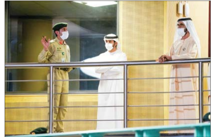
خلال زيارته لمقر القيادة العامة لشرطة دبي: