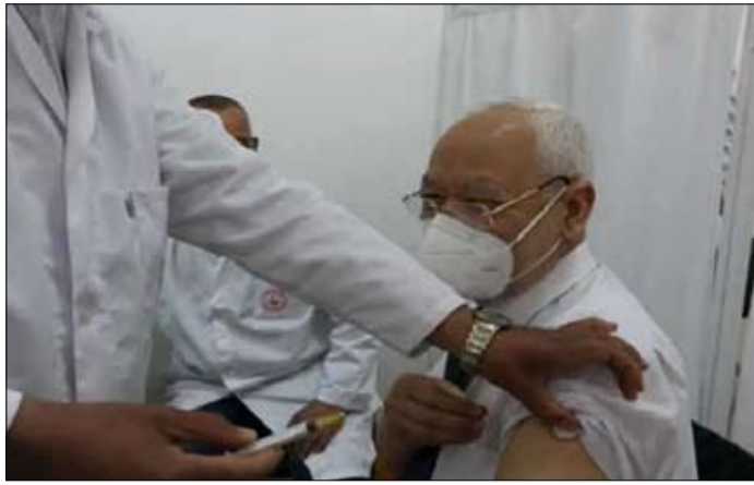
راشد الغنوشي يتلقى جرعة من التلقيح

وكان مستشار رئيس مجلس نواب الشعب المكلف بالاتصال والإعلام الرقمي وسيم خضراوي أعلن الثلاثاء عن إصابة رئيس مجلس نواب الشعب راشد الغنوشي بفيروس كورونا، وأكد الخضراوي في تدوينته أن رئيس المجلس سيواصل القيام بأعماله عن بعد وفقاً للإجراءات الاستثنائية مع اتخاذ كافة الاحتياطات الوقائية اللازمة واحترام البروتوكول