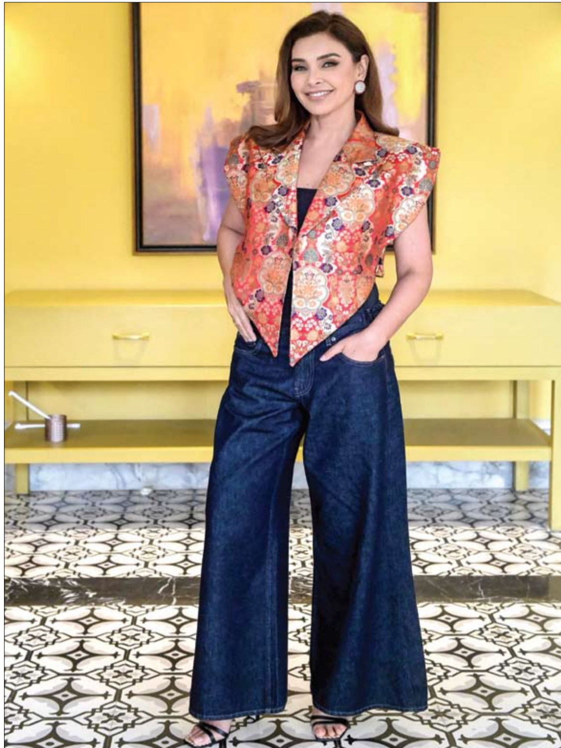
الممثلة الهندية الكندية والمؤسسة المشاركة لعلامة NuHer، ليزا راي، خلال فعالية بعنوان "مؤتمر الصحة والعافية"، للتوعية بقضايا صحة المرأة في أمريستار.

وأشار الفريق البحثي إلى أن المرحلة المقبلة ستتضمن دراسة التغيرات التي تطرأ على الجهاز المناعي أثناء العلاج، إلى جانب متابعة الأطفال لفترة أطول لمعرفة ما إذا كان التحمل المناعي سيستمر على المدى البعيد. نشرت النتائج في مجلة لانست لصحة الإقليم - أوروبا.