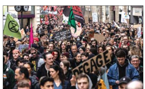
متظاهرون يحتجون على تمرير نظام المعاشات من البرلمان دون تصويت.

وفي باريس ومدن أخرى عديدة في أنحاء البلاد، عملت فرق التنظيف وسط زجاج مكسور وصناديق قمامة متضخمة ومحطات حفلات محطمة بعد اشتباكات عنيفة جرت الليلة الماضية بين محتجين يرتدون ملابس سوداء والشرطة.