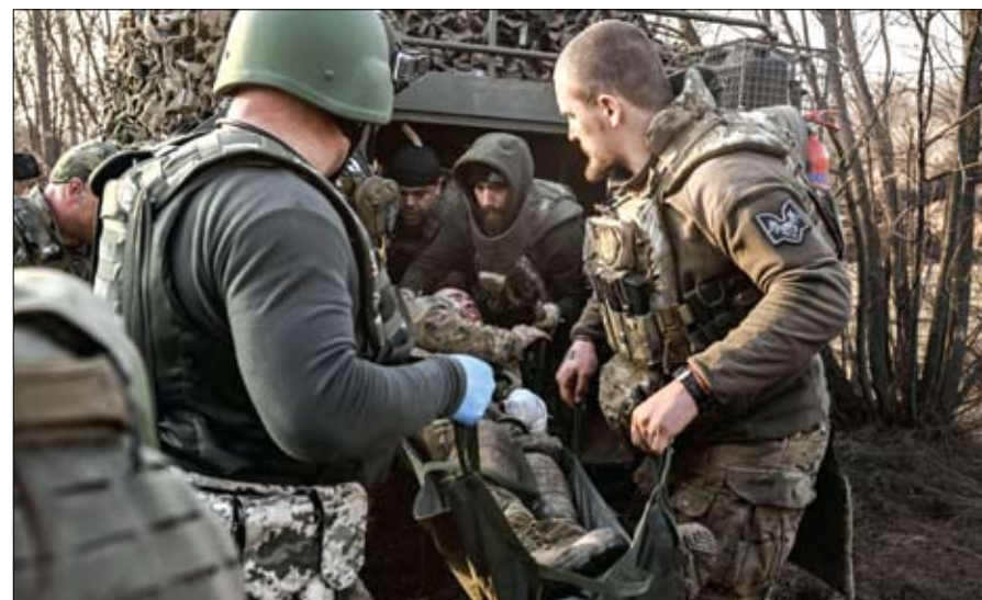
جندي أوكراني مصاب ينقل بعيداً عن خط المواجهة بالقرب من باخموت.

لا يمكن استبعاد شيء. إذا أردتم الذهاب إلى كييف فإنكم في حاجة للذهاب إلى كييف، إذا أردتم الذهاب إلى ليفيف فليكنم الذهاب إلى ليفيف من أجل تدمير تلك العدوى. وتواصل روسيا عملياتها العسكرية في أوكرانيا بعد مرور عام على