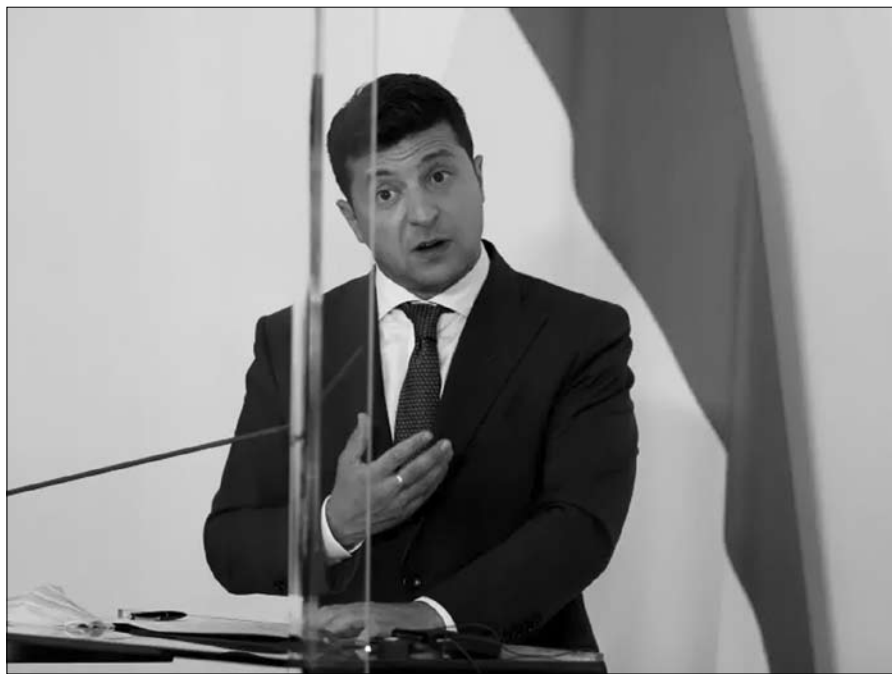
، يبدو من غير المرجح أن تسدد عسكرياً وفنذ دماراً واسع النطاق القانوني سيكون رمزاً قوياً لكيف كييف يوماً ما لدائن حاجمها على أراضيها. لكن الانتصار في حربها ضد الهيمنة الروسية.

الحكم ففازت بحكم لصالحها، و قد رأته المحكمة العليا للمملكة المتحدة في قرارها أن للبلد الحق في الاستماع إلى حججه، كما تقول كييف في دفاعها أن قرض السداد صدر بالإكراه وأن موسكو هددها ببرد عسكري انتقامي إذا واصلت التقارب مع الاتحاد الأوروبي. ومع ذلك، قانونيا، يُعتبر العقد الموقع تحت الإكراه باطلاً. من ناحية أخرى، لن تتمكن أوكرانيا من المجدالبة بأن السياسيين الذين وقعوا القرض لم يكن لديهم السلطة للقيام بذلك، لأن الحكومة كانت في ذلك الوقت حكومة شرعية.. لم يتم تحديد موعد المحاكمة النهائية بعد. وبغض النظر عن النتيجة