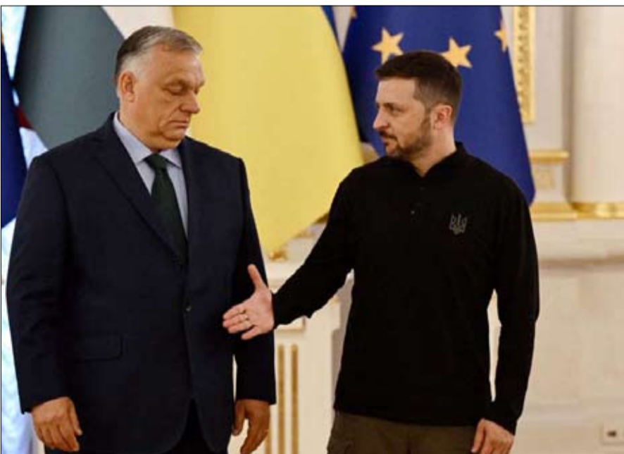
أوربان إنه في المقابل، حصلت «على ضمانتها بأنها لن تكون ملزمة بالمشاركة» في الدبلوماسية تشككها، معتبرة أن جهود الناتو، ولم تحف المصادر ذلك يشكل سابقة خطيرة.

من أصل مجري في البرلمان الأوكراني. وهي خطة غير رسمية حتى الآن. وُصفت على الفور بأنها ابتزاز وإنداز نهائي من قبل الصحافة الأوكرانية. كما أصبح الزعيم القومي، الذي يُعقد مهمة الأوروبيين، شوكة في خاصرة الناتو. وفي الأشهر الأخيرة، شدد خطابيه، متهمًا الحلف بجر أعضاءه «إلى حريق عالمي». ومع ذلك، أعلن الأمين العام لحلف شمال الأطلسي ينس ستولتنبرغ في 12 يونيو أنه توصل إلى اتفاق مع المجر بحيث لا يعيق جهوده لتنسيق عمليات تسليم الأسلحة إلى كييف وتدريب القوات الأوكرانية، والحفاظ على المساعدات المالية الحالية التي تبلغ قيمتها 100 مليون دولار أي ما لا يقل عن 40 مليار يورو سنوياً. وقال