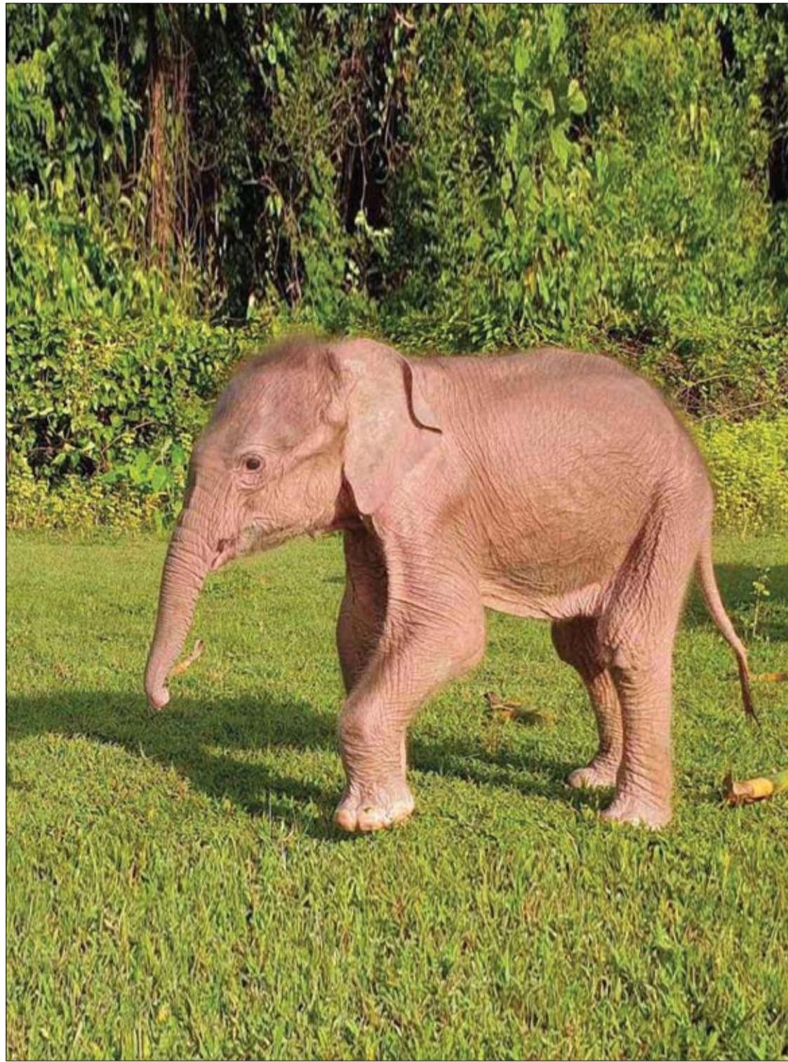
فيل أبيض حديث الولادة يزن حوالي 80 كيلوجراماً ويبلغ طوله 70 سم تقريبا في ولاية راخين في ميانمار.

وختمت أورسيل: "نصحتي هي التمسك بحلوى واحدة في اليوم مثل عصير الفاكهة أو الحبوب أو الحلوى، أي غير هذا سوف تبدأ بتجاوز حدودك والاتجاه نحو الإدمان".