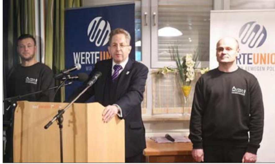
هانز جورج ماسن هدف سهل للمعارضة