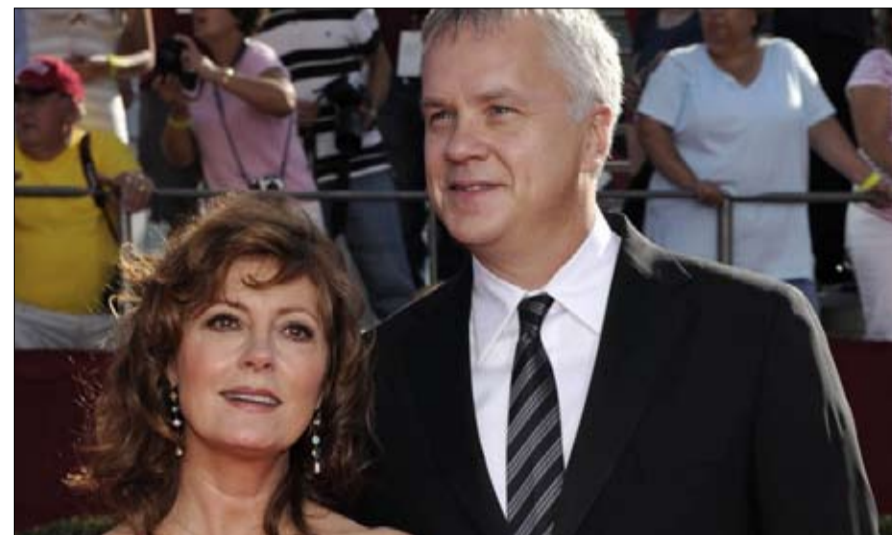
كانا أقرب إلى الثنائي تيم روينز وسوزان ساراندون

• ليس بالضرورة أن يتحول طلاق آل غيتس إلى قصة انتقام جديدة ب نادي الزوجات الأول