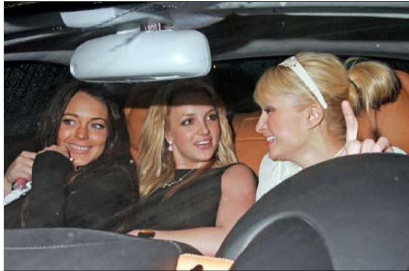
صيف حار للنساء فقط