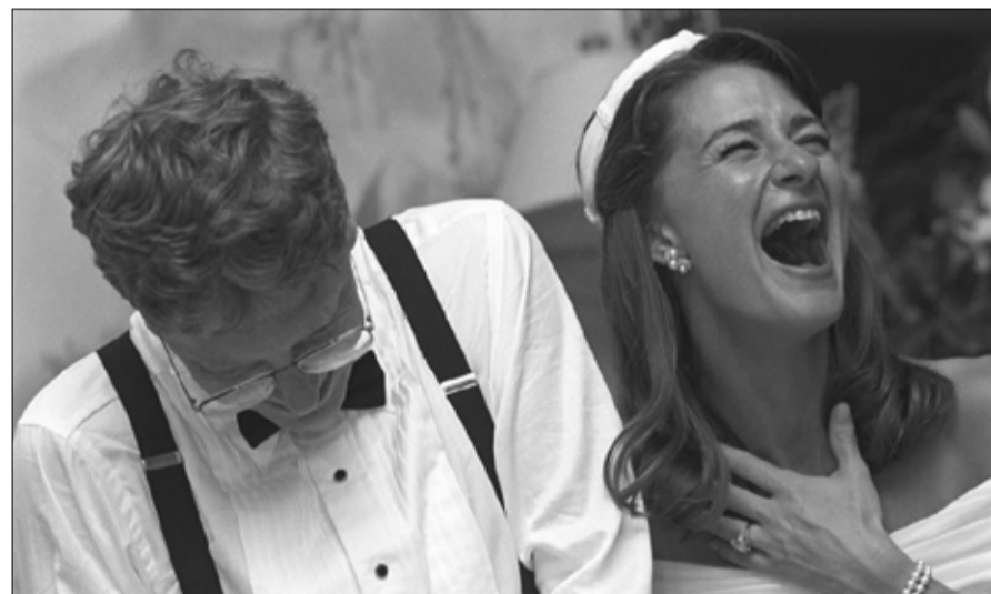
عيد زواج سعيد، بيل غيتس... بعد خمسة وعشرين عاماً وثلاثة أطفال، ما زلنا نضحك بشدة

ميليندا مركز الاهتمام ونتيجة لذلك، ردت أميركا على هذا الخبر بطرح أسئلة لا زمنية؛ وأخرى تتعلق بعلم 2021، أولاً، كيف سيوزعان ثروتهم، التي يُقال إنها تبلغ حوالي 124 مليار دولار؟ (نحن لا نعرف حقاً حتى الآن). هل تم إبرام اتفاق ما قبل الزواج؟ (ذكر الموقع الأمريكي المختص في أخبار النجوم والمشاهير "تي إم زاد"، لا، لكن صحيفة نيويورك تايمز تقول "هناك اتفاق"). ماذا سيحدث لمؤسستهما، التي وصلت أوقافها إلى 50 ملياراً؟ (من المتوقع أن يواصلوا قيادتها معاً). الأهم: هل ميليندا جاهزة لقضاء صيف حار ما بعد كوفيد؟