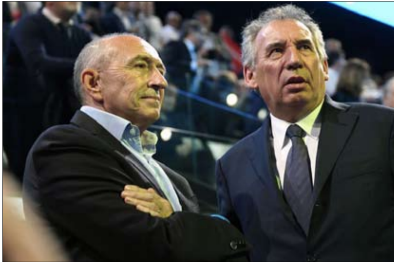
بايرو وكولومب من الذين دفعوا ثمن صعود ماكرون