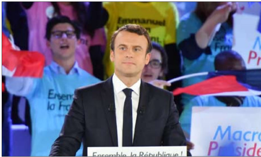
ماكرون الناجي المعين

• كان انتخابه مستجيلاً لولا انهيار النظام السياسي للجمهورية الخامسة، الذي سرّعه واستفاد منه