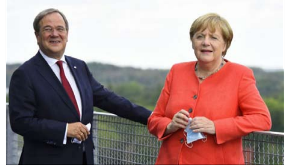
زعيم الحزب أرمين لاشيت في موقف صعب