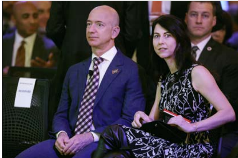
جيف بيزوس وماكنزي سكوت صنعوا السابقة