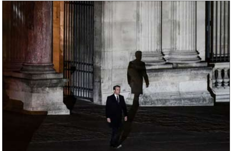
إيمانويل ماكرون يمشي وحيداً في متحف اللوفر