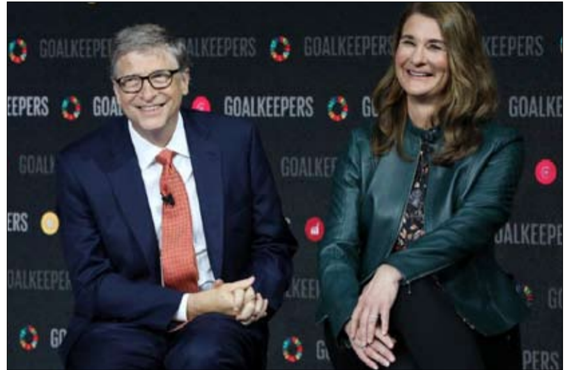
الزوجان في 3 مايو 2021

نمت أنشطته الخيرية؛ ولكن على مدار العقد الماضي، قامت ميليندا أيضاً بدور أكثر عمومية من خلال انبساطها في الإسهة، والدفاع عن حقوق المرأة. عام 2019، نشرت كتاباً بعنوان "حان أوان النهوض"، روجت له بحملة إعلامية مكثفة. اعتمد الكتاب والترغيب بشكل كبير على قصص زفاف غيتس، وبالطبع بعض تلك الحكايات، التي تم سردها بعناية، على سبيل المثال، في عمود لنيكولاس كريستوف، تتم قراءتها بشكل مختلف قليلاً الآن: طفلة عدة سنوات، تخصصها حول من يجب أن يكتب الرسالة السنوية للمؤسسة، وهو أمر فطري بيل بمفرده دون إشراكها، لكنهما وجدا في النهاية أرضية مشتركة... هذا ما يبدو، على الأقل.