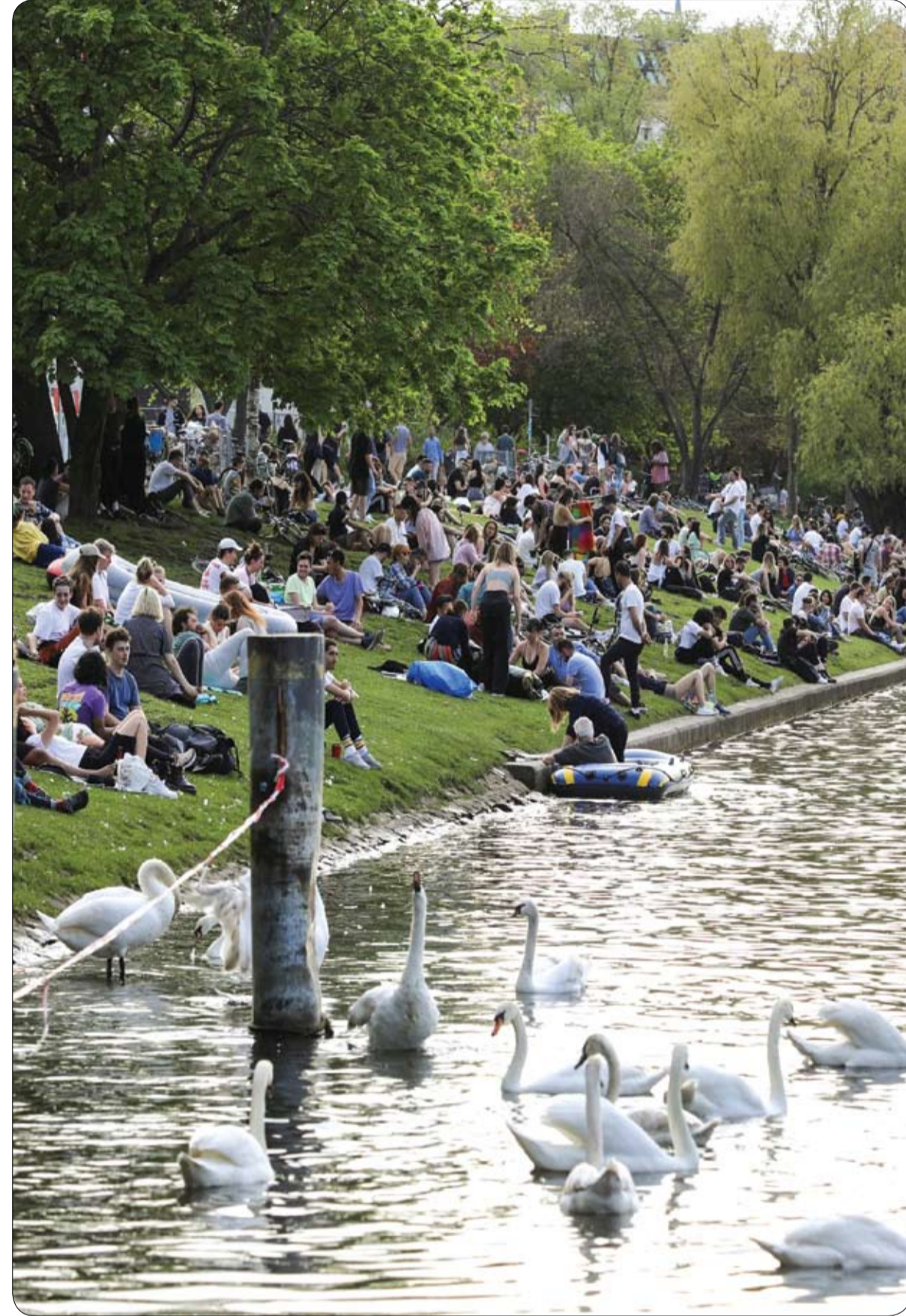
مجموعة كبيرة من الناس يستمتعون بالطقس المشمس على ضفاف النهر، في برلين بألمانيا، مع استمرار جائحة فيروس كورونا.