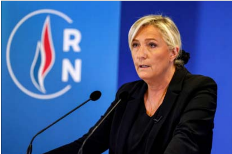
مارين لوبان وريثة وناجية مثل ماكرون