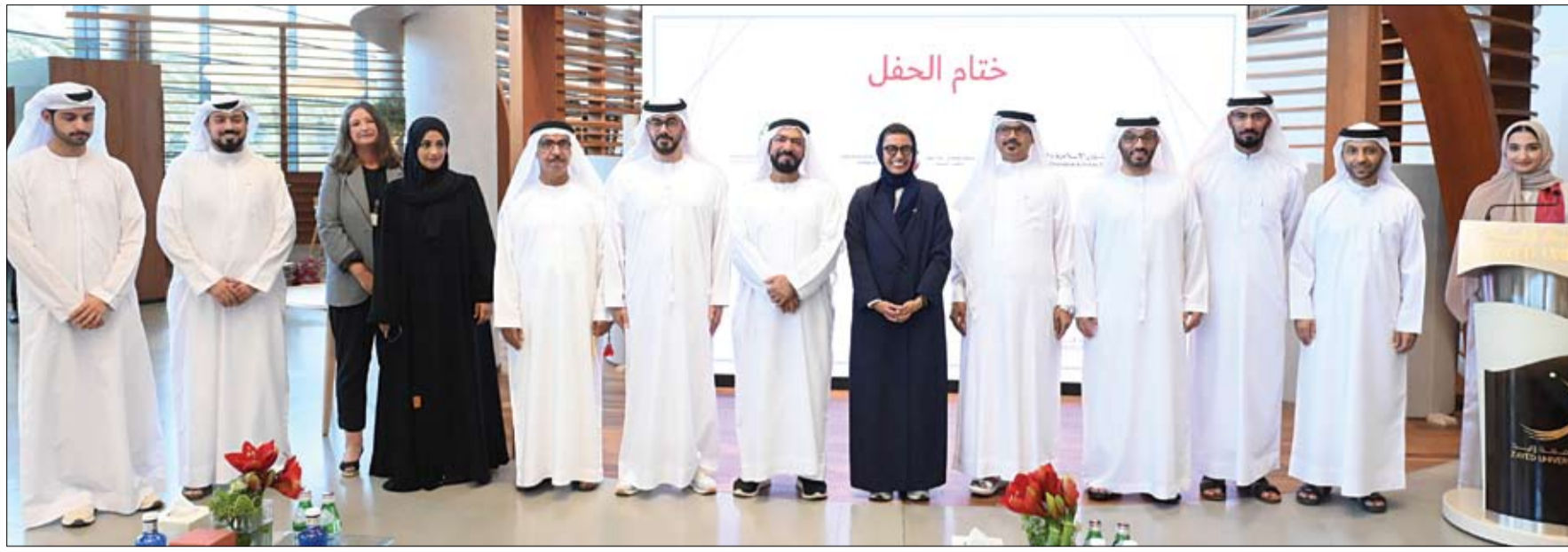
خلال حفل تكريمهم بحرم الجامعة