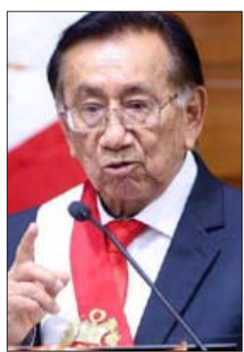
وزير الخارجية هوغو دي زيبلا

التزامات البلاد «ليس خياراً، بل واجب». وكان السفير الأمريكي لدى البيرو برناردو نافارو حذر عبر منصة «إكس» قائلًا «إذا وافقتم بسوء نية مع الولايات المتحدة وتسيبتم بأضرار للمصالح الأميركية... سأستخدم