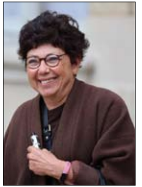
باريس-أ ف ب:

تعقد مجموعة الدول السبع اجتماعاً مخصصاً للبيئة، يومي الخميس والجمعة في باريس، لمناقشة مواضيع عدة أبرزها التنوع البيولوجي والمحيطات والتصحّر، مع تجنب التطرق إلى قضية التغير المناخي، لتفادي أي اصطدام مع الموقف الأميركي. ودعت وزيرة التحول البيئي الفرنسية مونيك باربو، نظرها من مجموعة الدول السبع بالإضافة إلى ممثلين عن شركاء آخرين، مثل الدول التي ستستضيف مؤتمرات الأطراف