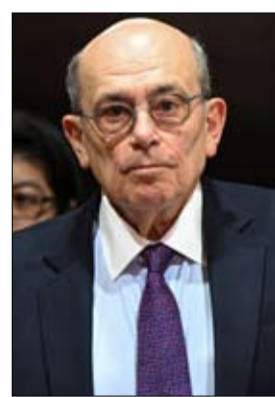
وزير الدفاع كارلوس دياز

استقال وزير الخارجية والدفاع البيروفيان احتجاجاً على قرار الرئيس المؤقت بإرجاء صفقة بقيمة 3.5 مليارات دولار لشراء 24 طائرة مقاتلة من طراز إف16- الأمريكية. وقال الوزير إن الاتفاق وُقِع وإن إعادة النظر فيه الآن يعرض سمعة البيرو كشريك تجاري للخطر. ومن شأن استقالة الوزيرين المواجهة أن تؤدي إلى تقادم حالة عدم الاستقرار التي تشهدها البلاد بعدما تحولت الانتخابات الأخيرة لاختيار الرئيس التاسع للبيرو خلال عقد، إلى فوضى. ولم يحصل أي مرشح على أغلبية مطلقة، ما يعني إجراء جولة ثانية في 7 حزيران-يونيو. وأعلن الرئيس المؤقت للبيرو خوسيه ماريا بالكازار الثلاثاء إرجاء شراء طائرات مقاتلة من طراز إف16- من الولايات المتحدة، قائلًا إن هذا القرار يجب أن يُترك للحكومة المقبلة التي ستولي مهامها في تموز-يوليو. ورغم ذلك، أعلنت وزارة الاقتصاد مساء الأربعاء أنها حوّلت 462 مليون دولار إلى شركة لوكهيد مارتن كدفعة أولى، لافتة إلى أن احترام