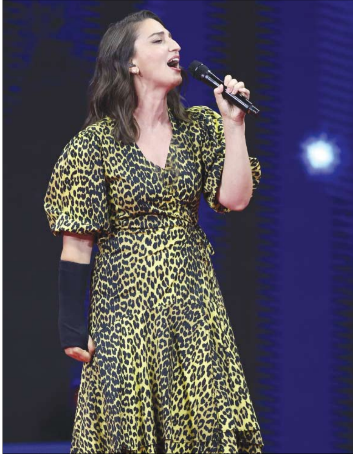
المطربة وكاتبة الأغاني وعازفة البيانو الأمريكية سارة باريلز تغني خلال اليوم الأول من بطولة الولايات المتحدة المفتوحة للتنس لعام 2023. (ا ف ب)