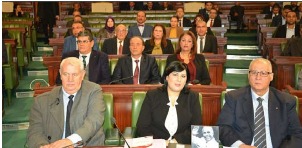
الدستوري الحر يدعو لاسقاط الغنوشي

في إشارة الى الاتفاق بين التيار وتحيا تونس والنهضة وحركة الشعب. وأبرز انه اتفق وقتها على اعادة الحكومة بعد تحديد المرشحين للوزارات على رئيس الجمهورية قيس سعيد، وان المواقف تغيرت وانه قرر بعدها المرور لحكومة الكفاهات المستقلة.