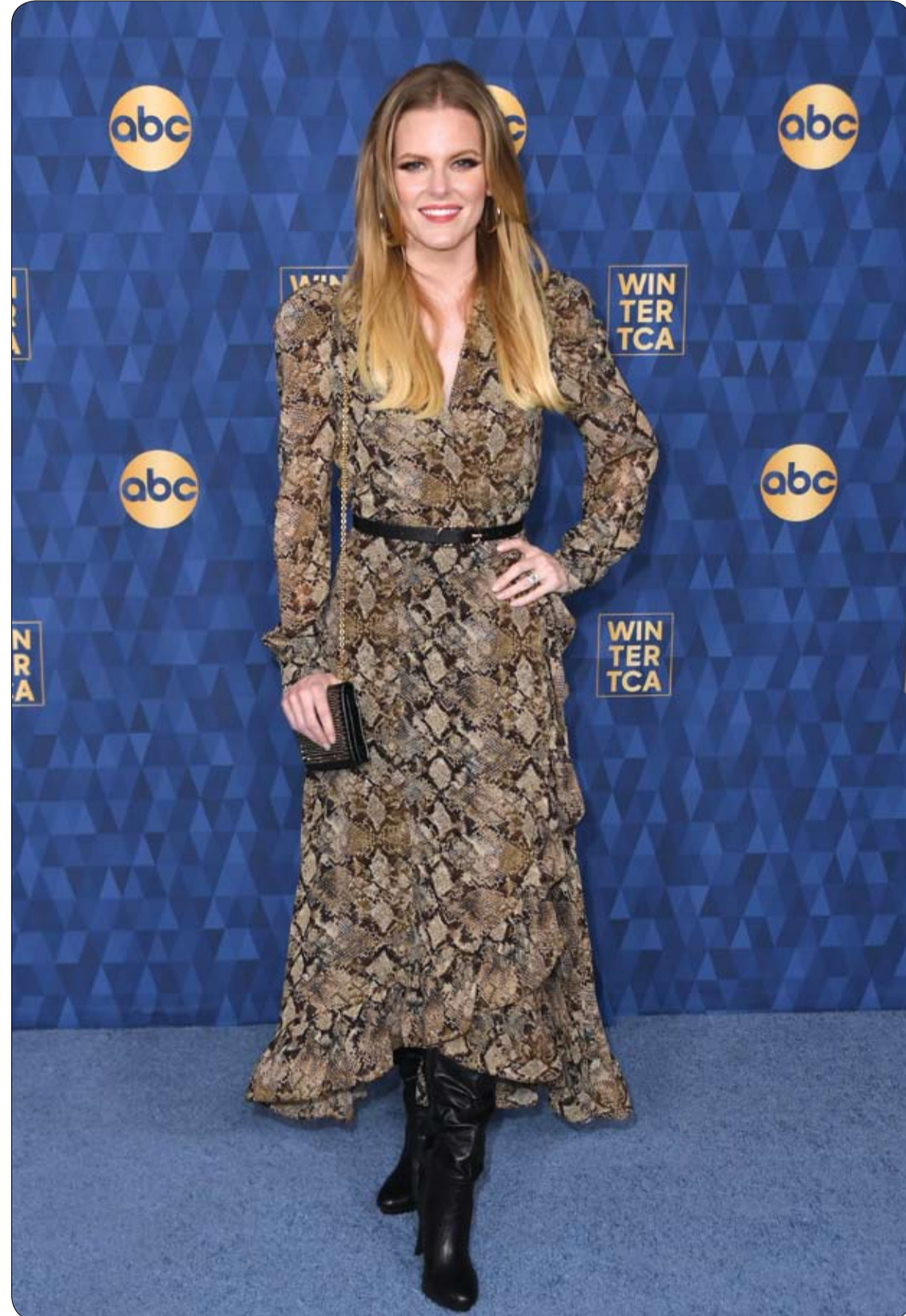
الممثلة الأمريكية تشيلسي كريس تحضر جولة صحفية لـ ABC عن حفل تي سي ايه الشتوي 2020 في باسادينا ، كاليفورنيا.

وقالت مدربتها في النادي، إنها تتحلل بروح قتالية وطاقة فريدة من نوعها، إضافة إلى شعورها بالتفاؤل على الدوام والذي يظهر عبر كلامها وتصرفاتها رغم سنها الصغير، بحسب ما نقل موقع "ميترو" الإلكتروني.