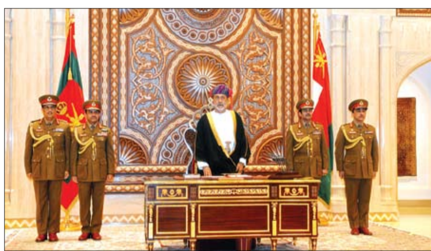
السلطان هيثم بن طارق آل سعيد خلال أدائه قسم اليمين

العربية لتحقيق أهداف جامعة الدول العربية والرقي بحياة مواطنينا والنأي بهذه المنطقة عن الصراعات والخلافات والعمل على تحقيق تكامل اقتصادي يخدم تطورات الشعوب العربية. وقال السلطان هيثم بن طارق - في كلمة له أوردتها وكالة الأنباء العمانية عقب أدائه قسم اليمين أمس في جلسة مشتركة لمجلس عُمان والدفاع - إن سلطنة عُمان ستواصل دورها كعضو فاعل في منظمة الأمم المتحدة وتحترم ميثاقها وتعمل مع الدول الأعضاء على تحقيق السلم والأمن الدوليين ونشر الرخاء الاقتصادي في جميع دول العالم وستبني علاقاتها مع جميع دول العالم على تراث عظيم خلفه السلطان الراحل عليه رحمة الله ومغفرتة، أساسه الالتزام بعلاقات الصداقة والتعاون مع الجميع واحترام الوثائق والتوازنين والاتفاقيات التي أمضيناها مع مختلف الدول والمنظمات.