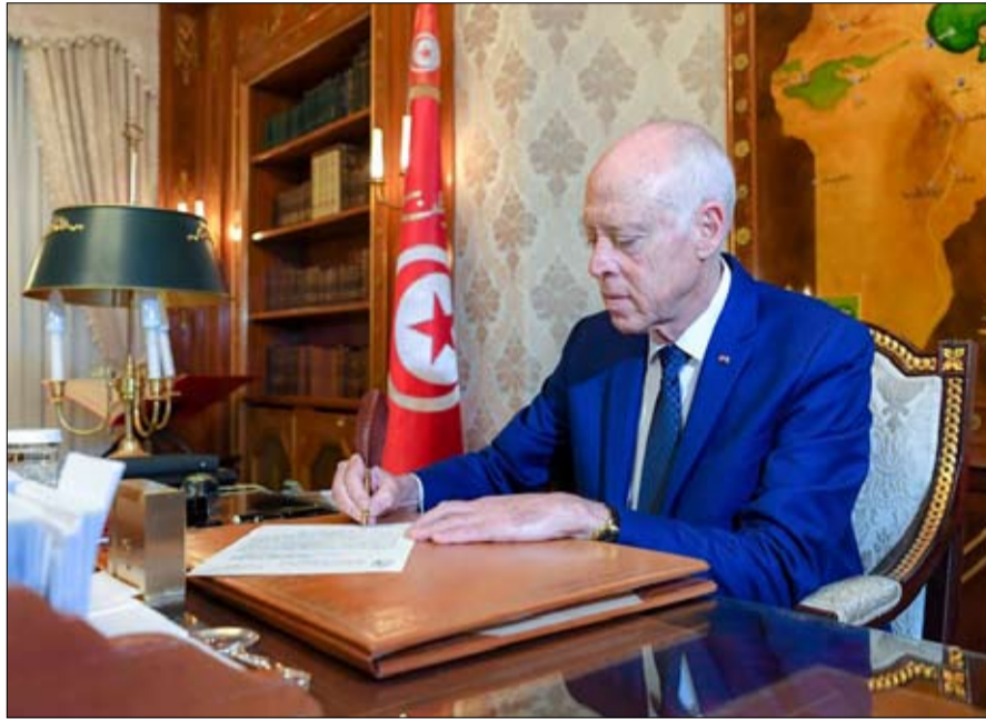
الكرة الان في ملعب قيس سعيد

وأعلن الحزب في بيان صادر عنه انه يضع امضاء نواب كتلة الحزب الدستوري الحر السبعة عشر كبادرة للشرع في جمع 73 صوتا المستوجبة لترميم هذه العريضة. كما دعا "كافة القوى السياسية الوطنية الحداثية إلى اختيار شخصية وطنية جامعة تتمتع بالكفاءة والإشعاع وتقطع مع الإسلام السياسي لتكليفها بتكوين حكومة دون تمثيلية لتنظيم الإخوان ومشتقاته حتى يتسنى لتونس تحظى أزمته الخائفة والانعقاد من منظومة الفشل التي أدت بها الى مواقفها الديبلوماسية التي طالما