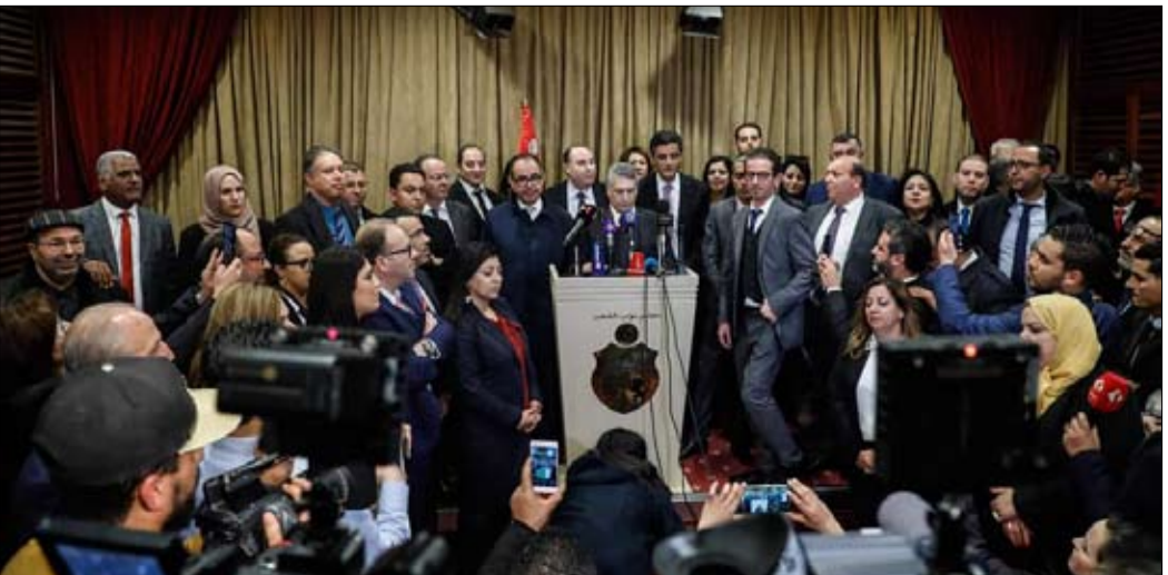
جبهة برلمانية جديدة

ما بعد الجملي: 10 أيام أمام قيس سعيد لاختيار الشخصية الأقدر الإعلان عن تكوين جبهة برلمانية لتقديم مبادرة وطنية نبيل القروي: النهضة أضاعت البلاد شهرين باختيارها الجملي