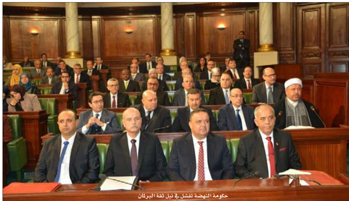
حكومة النهضة تقش في نيل ثقة البرلمان

وأعلن الحزب في بيان صادر عنه انه يضع امضاء نواب كتلة الحزب الدستوري الحر السبعة عشر كبادرة للشرع في جمع 73 صوتا المستوجبة لترميم هذه العريضة. كما دعا "كافة القوى السياسية الوطنية الحداثية إلى اختيار شخصية وطنية جامعة تتمتع بالكفاءة والإشعاع وتقطع مع الإسلام السياسي لتكليفها بتكوين حكومة دون تمثيلية لتنظيم الإخوان ومشتقاته حتى يتسنى لتونس تحظى أزمته الخائفة والانعقاد من منظومة الفشل التي أدت بها الى مواقفها الديبلوماسية التي طالما