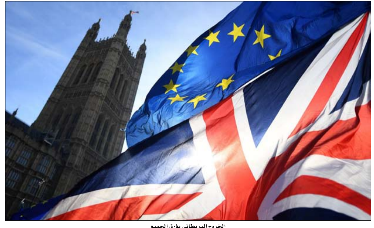
الخروج البريطاني يؤرق الجميع

يحلّم الأوروبيون بظهور نسخة من توني بلير يلغي البريكسيت