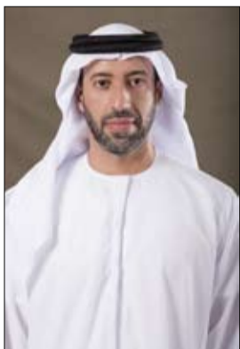
تمكين المرأة والأخذ بيدها نحو تحقيق طموحاتها وأمانها وترسيخ ذاتها كعنصر اجتماعي مهم في ركب التطور والبناء.

وأضاف سعادته: كانت وما تزال المرأة أساساً من أساسات عملية التنمية، وأولوية من الأولويات التي وضعتها القيادة الرشيدة من أجل النهوض بالوطن، وقد أولت قيادتنا الحكيمة في عهد صاحب السمو الشيخ خليفة بن زايد آل نهيان وحفظه الله ابنة الإمارات رعاية ودعمًا لأحلامها وطموحاتها، فعملت على ترسيخ وجودها وكيانها وآتاحت لها المشاركة في قيادة عملية التنمية، وما تزال قيادتنا تمد أمام المرأة الإماراتية جسور العبرور نحو التماء والمشاركة والاستقرار، وتعزيز وجودها ومكانتها كصانعة للحياة. وأكد سعادته أن المرأة تحتل مكانة