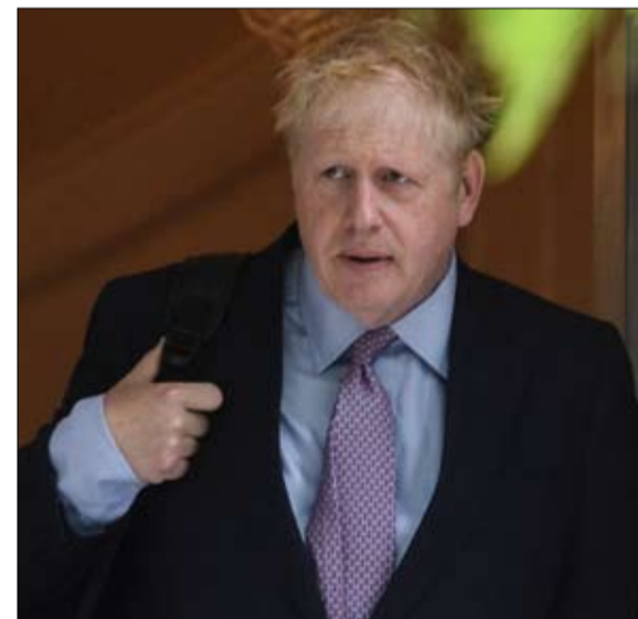
بوريس جونسون ماذا يريد؟

مرة أخرى، يكفي الاستماع إلى ما يقوله الآخر: عندما تدعي بروكسل أن التخلص من من شبكة الامان سيكون مشكلة كبيرة، لأن الحدود غير المنضبطة في إيرلندا ستكون كعب أخيل بالنسبة إلى السوق الموحدة. لقد فهمت تيريزا ماي ذلك من خلال اختراع هذا الجهاز، بل إنها فهمته جيداً، الى درجة انها نسيت