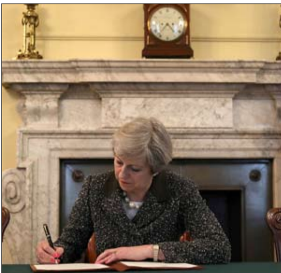
تيريزا ماي فهمت المطلوب ولكن

التصويت البرلماني الوحيد الذي وافق على اتفاقية الانسحاب، في 29 يناير 2019، نص على "ترتيبات بديلة لشبكة الأمان". واستخلص جونسون من ذلك النتيجة الحتمية: وحده اتفاق دون شبكة امان سيمر ما وراء المانش. لكن منطقه لا يتوقف عند هذا الحد: اذا استثنينا قبول البريطانيين باتفاقية تتضمن شبكة امان قبل 31 أكتوبر، ما هو الخيار الآخر الذي يقترحه الاتحاد الأوروبي؟ طلب تمديد جديد لتنظيم استفتاء ثان أو انتخابات. يعلم السيد جونسون أن هذا الحل الثاني له ثلاثة عيوب خطيرة: لن يكون الوضع الناتج بالضرورة مختلفاً عن الوضع الحالي؛ وإن فرض الانتخابات من قبل هيئة أجنبية سيزيد من حدة المعارضة للاتحاد الأوروبي؛ وسيكون لتأخير مصحوب بنسوك متعمدة عواقب سلبية على ضفتي المانش، وبالتالي، فإن الخيار الحقيقي الوحيد المتبقي هو إجبار الطرفين على إيجاد حل عملي لتضية الحدود -مع التهديد بـ "اللاصقة" لشذ النفوس والعقول.