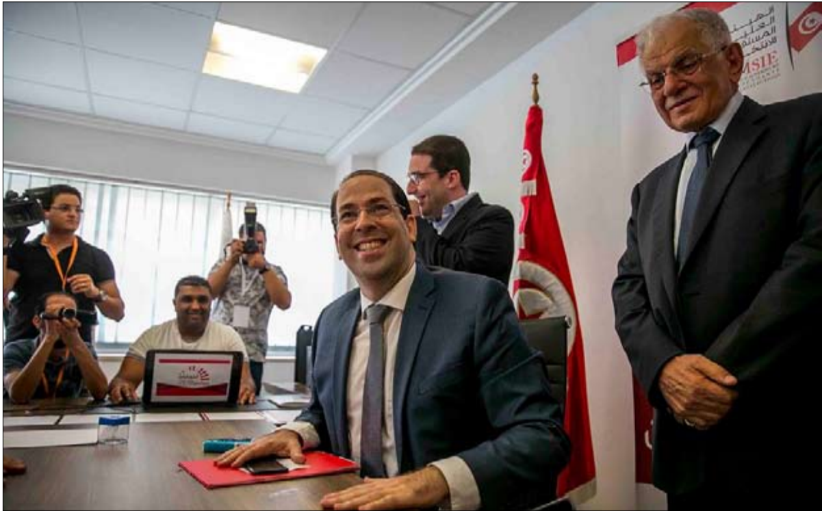
الشاهد يدافع عن حصاده

بالوقوف وراء ذلك وان الوحيد الذي لم يوجه له أصابع الاتهام بمسؤولية خضوعه لتبعية قضائية هو مغني الرب "سوغ مان" معتبراً ان ما يحدث مؤخرًا يعكس بداية نجاعة القضاء.