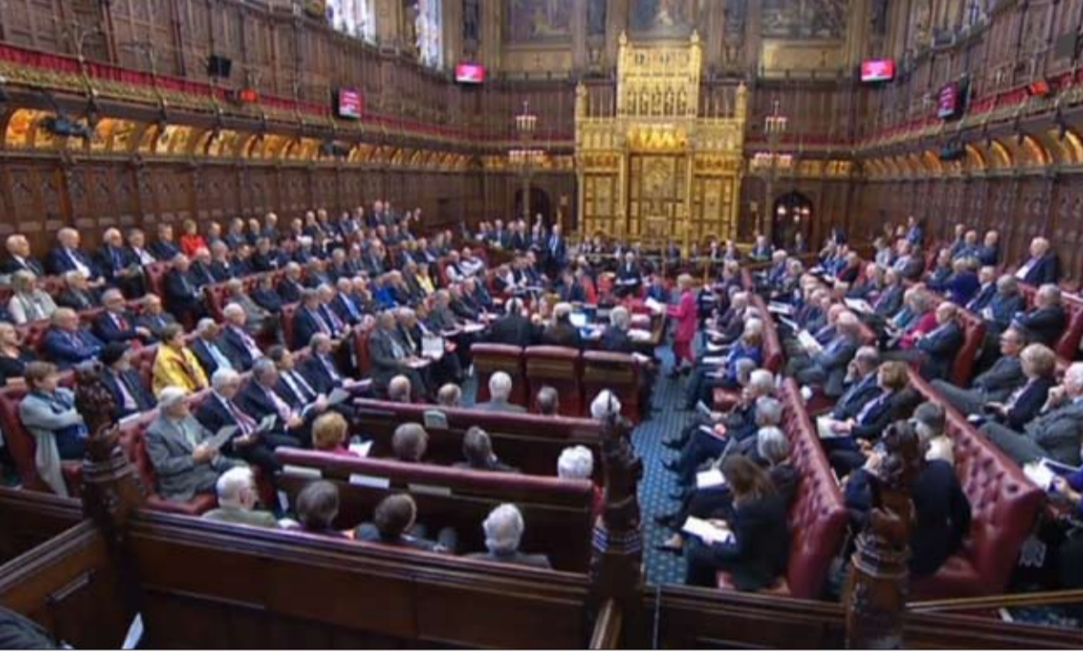
المعركة مستمرة داخل البرلمان