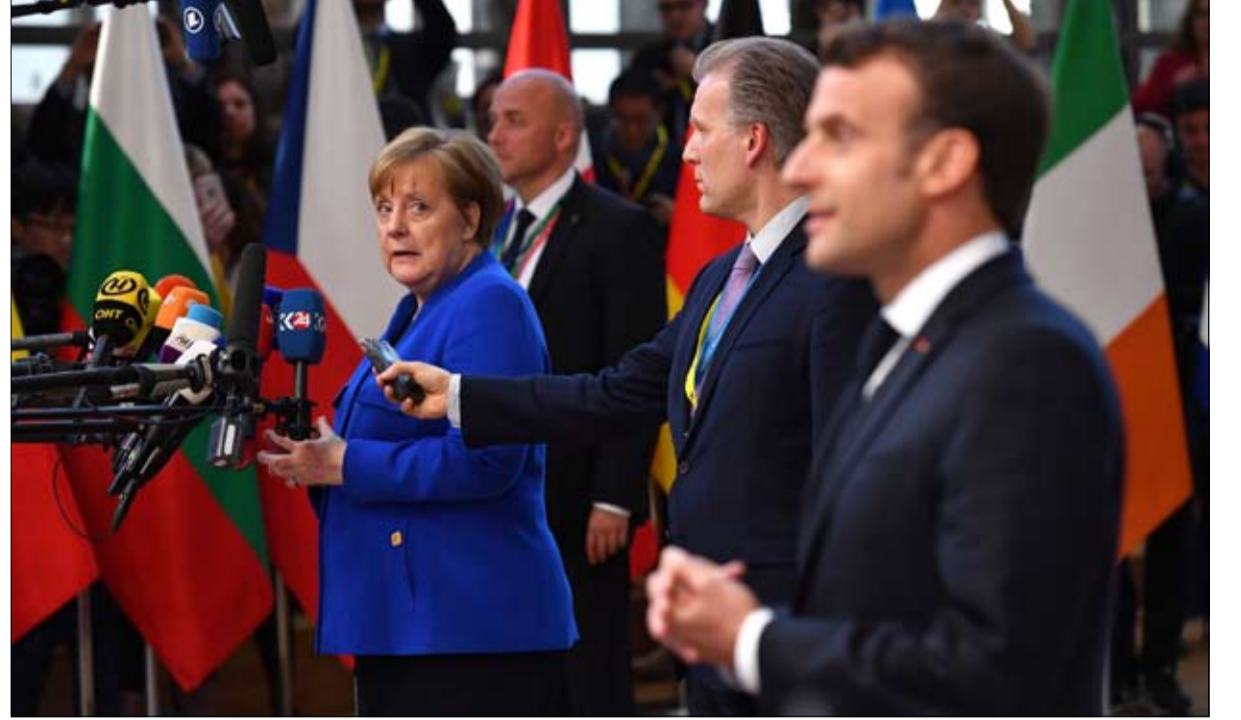
زعماء أوروبا ينتظرون امتحان بوريس في الخريف