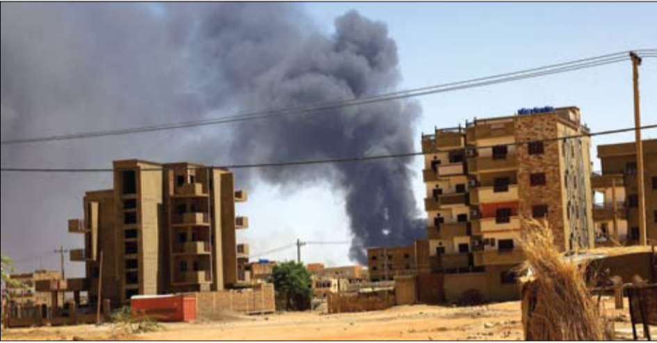
الدخان يتصاعد فوق المباني بعد قصف جوي في الخرطوم

وأعلنت الأمم المتحدة الخميس، أن أكثر من مئة ألف لاجئ سوداني فروا إلى تشاد الجاورة منذ اندلاع النزاع في السودان قبل ستة أسابيع.