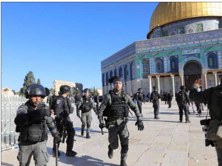
في محيط المسجد والبلدة القديمة، وتعرقل وصول القدسيين إلى المسجد. ويتعرض الأقصى يومياً عدا الجمعة والسبت، ومحاوله تقسيمه زمنياً ومكانياً.

كما اعتقل الجيش الإسرائيلي 3 من منطقة صعيدة وسط بلدة بيت أمر، وآخر من مخيم الفوار جنوب الخليل. واعترض الجيش الإسرائيلي شابين وامرأة من قرية المغير شرق مدينة رام الله. من جانب آخر أصيب شاب فلسطيني برصاص الجيش الإسرائيلي، الخميس، عند حاجز مخيم شغافا العسكري شمال شرق القدس المحتلة. وأفادت وكالة الأنباء الفلسطينية وفا، بأن قوات الجيش الإسرائيلي أطلقت النار على شاب لدى مروره عبر حاجز مخيم شغافا، وتم نقله إلى أحد مستشفيات مدينة القدس، وأضافت أن قوات الجيش الإسرائيلي شددت إجراءاتها العسكرية على الحاجز، ما أدى إلى عرقلة حركة المواطنين. وفي سياق الانتهاكات الإسرائيلية في الضفة الغربية، اقتحم عشرات المستوطنين بحماية من قوات الشرطة الإسرائيلية، اليوم الخميس، باحات المسجد الأقصى المبارك. واقترح المستوطنون الأقصى، على شكل مجموعات متتالية من جهة باب المغاربة، ونفذوا جولات استفزازية، وأدوا طقوساً تلمودية في باحاته وعند أبوابه. وتفرض قوات الشرطة الإسرائيلية إجراءات مشددة