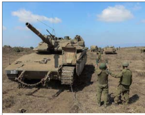
وتابع: "اعتقد أن هذا بيان غير صحيح، التعريف الصحيح هو أن حرباً بهذا الحجم، يستعد لها هو معناد حقاً في الحروب الماضية،

وحول إمكانية تعامل الجيش الإسرائيلي مع حرب متعددة الساعات، قال: "أعتقد أن الجيش الإسرائيلي يمكنه التعامل مع، وأعتقد أن المجتمع الإسرائيلي يمكنه ذلك أيضاً، سيكون حدثاً صعباً ومركزاً، ولن يكون مشابهاً بأي شكل من الأشكال لأي شيء عشناه في الماضي. وعن حرب الساعات المتعددة، قال إنها أقرب من قبل، وهذا هو السبب للاستعدادات الإسرائيلية الحالية، مؤكداً أنه ليس من قبيل المصادفة أن الجيش الإسرائيلي يحاكي مثل هذا السيناريو في نطاق واسع دون أن تكون هناك مؤشرات على حدوثه في السنوات