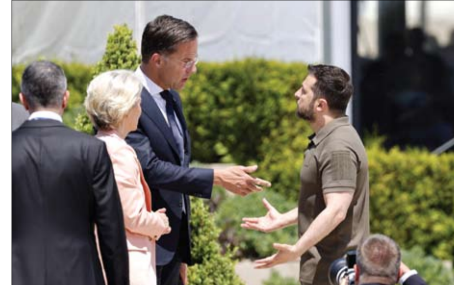
زيلينسكي يتحدث مع رئيسة المفوضية الأوروبية ورئيس الوزراء الهولندي خلال قمة (EPC) في مولدوفا. (ا ف ب)

شمال الأطلسي (ناو) قائلا كل شك نظره هو خندق ستحاول روسيا احتلاله. وقال زيلينسكي خلال لقاء للمجموعة السياسية الأوروبية في بوليفوكا في شرق مولدوفا يجب أن تكون كل الدول الأوروبية التي تتشارك حدودا مع روسيا والتي لا تريد أن تأخذ روسيا جزءاً من أراضيها، أعضاء كامل العضوية في الناو والاتحاد الأوروبي. وفي وقت سابق من أمس قال الرئيس زيلينسكي خلال زيارة لمولدوفا، إن بلاده مستعدة لتكون جزءاً من حلف شمال الأطلسي الناو، وإن كييف تنتظر التكتل الدفاعي ليكون مستعداً لضمها.