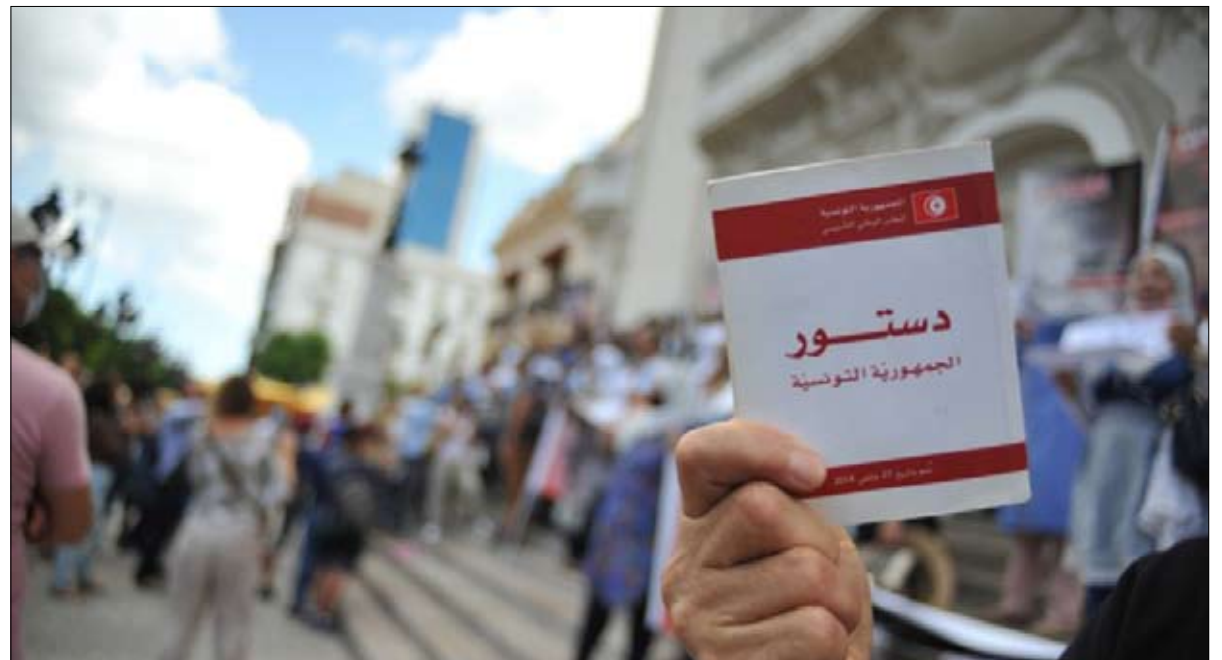
ويستمر الجدل حول الدستور الجديد