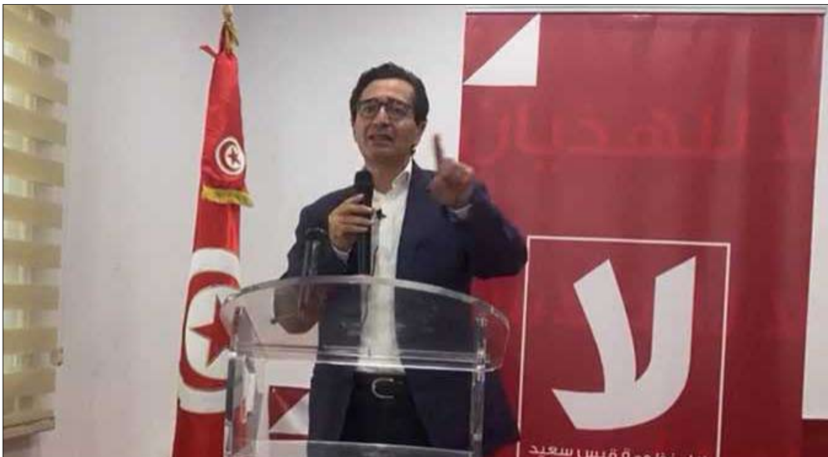
آفاق تونس يدين الخروقات