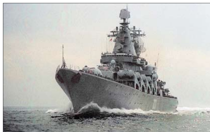
فارياغ طراد صواريخ صيني