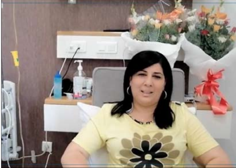
الدستوري الحر يصعد موقفه