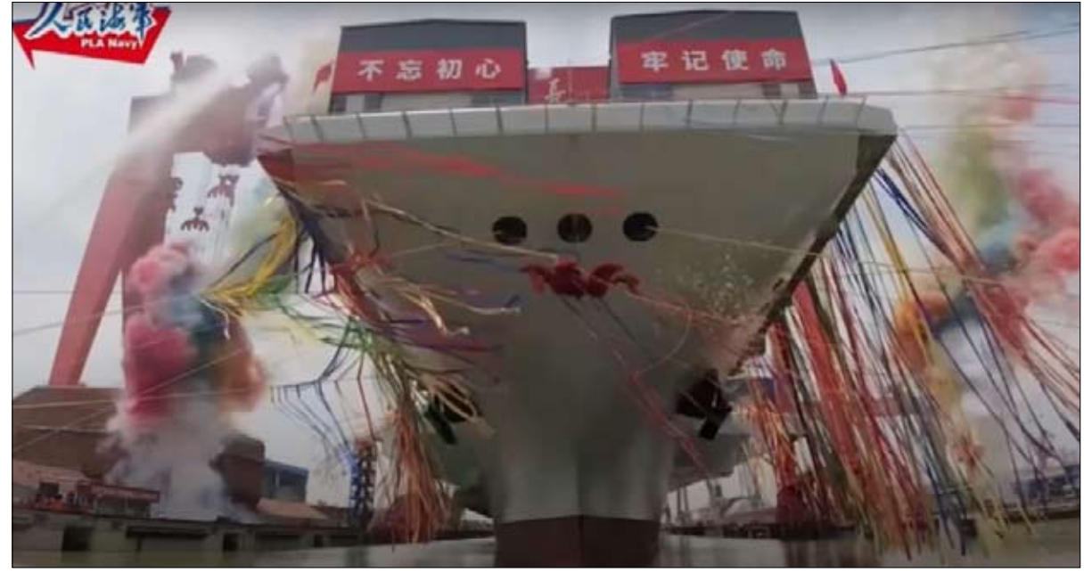
ضجة وأشرطة وتصفيق من البحارة... حاملة الطائرات الثالثة في الصين استقبلت كنجمة