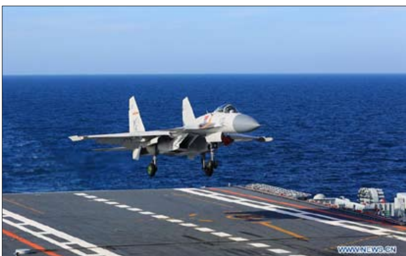
تدريبات مستمرة تثير قلق تايوان

تم تصميم فوجيان وانجازها بالكامل من طرف الصين. إنها جزء من برنامج دفاعي تضاعفت ميزانيته بمقدار عشرة خلال خمسة عشر عاماً. ومع حاملة الطائرات هذه، من الواضح أن الصناعة البحرية الصينية أرادت أن تظهر أنها تتقن أحدث التقنيات وأن لديها الإمكانيات