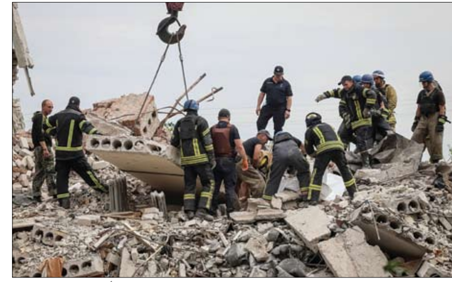
عمال الإنقاذ ينتشلون جثة من مبنى تضرر من غارة روسية في منطقة دونيتسك، أوكرانيا.

وكانت روسيا هدّدت مرارا بأنها ستسهدف الأسلحة الغربية التي ترسلها الدول الأوروبية والولايات المتحدة إلى القوات الأوكرانية، وقالت بالفعل إنها دمّرت العديد