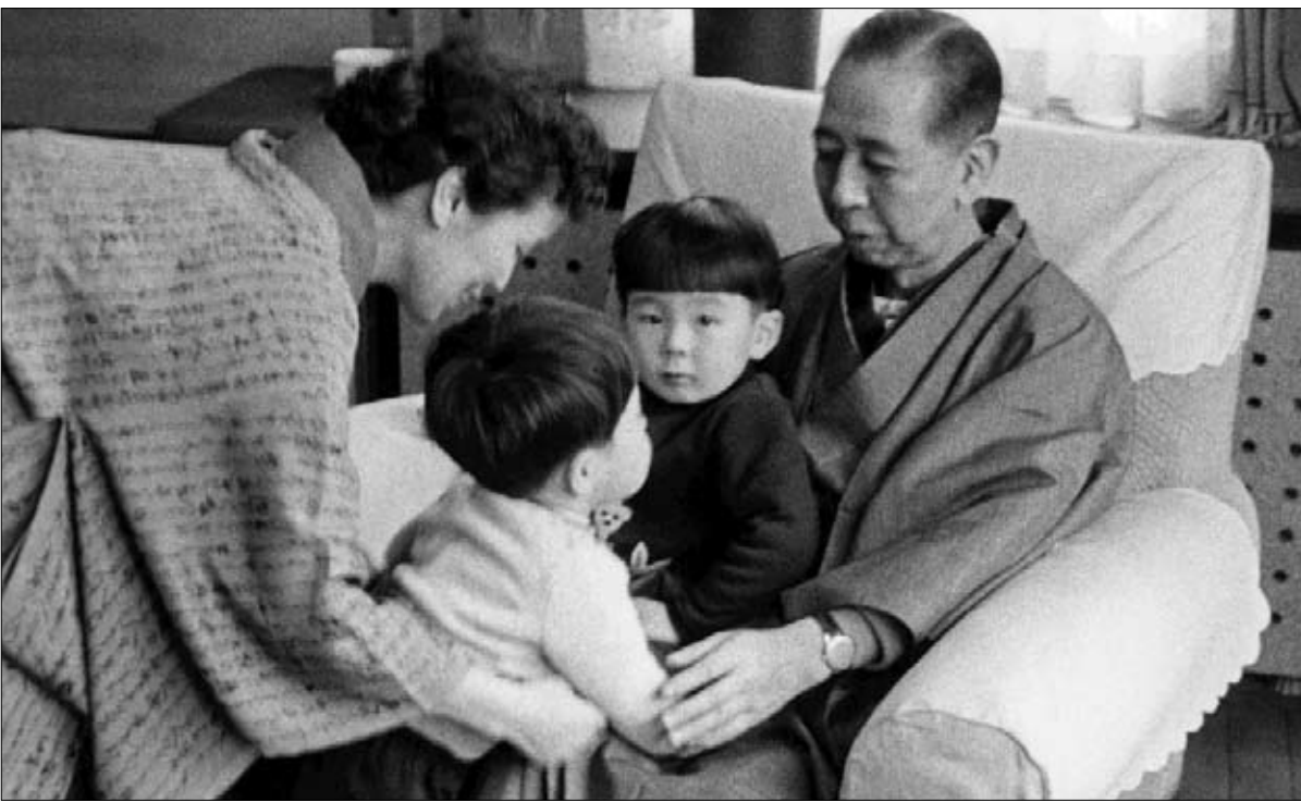
شينزو آبي في حضن جده نوبوسوكي كيشي، رئيس الوزراء الياباني، في الستينات

صدم اغتيال شينزو آبي اليابان. لكن تأثير هذا الموت