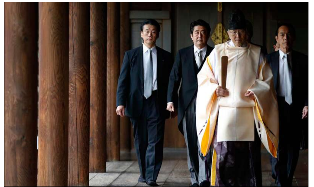
شينزو آبي يزور ضريح ياسوكوني

حرم معبد ياسوكوني، وهو مكان مرتفع في طوكيو، حيث تكرم أرواح الجنود الذين سقطوا في ساحة المعركة، ومنهم الذين أعدموا لارتكابهم جرائم حرب. في النهاية، حصاد آبي ليس وفيروا فيما أنجزه شخصياً. ومن الأفضل أن نرى وراء احتفاله بالسلطة موجة الاحتقان التي بدأت في الخمسينات والتي عبر عنها جده أيدولوجياً. تم تهميشها في الستينات لما كان اليسار قويا وحتى نهاية السبعينات عندما كان جيمينتو في أيدي الوسطيين، ومع مرور الوقت، تمكن هذا اليمين من تقليص المعارضة. وفي هذا الصدد، تتبع اليابان تياراً عالمياً نحو اتجاه المجتمعات الديمقراطية إلى اليمين.