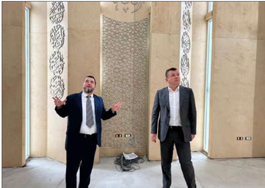
تالانت بالا يتفقد الجامع