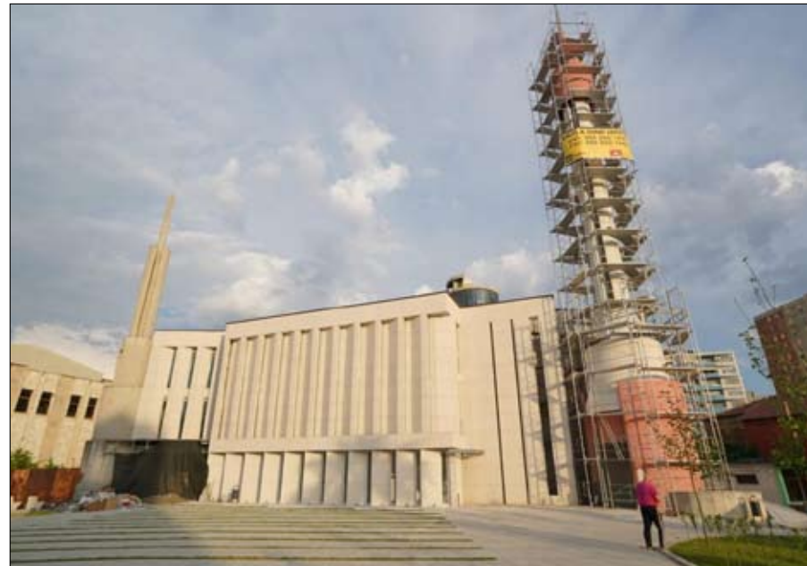
مبنى الجامع الجديد