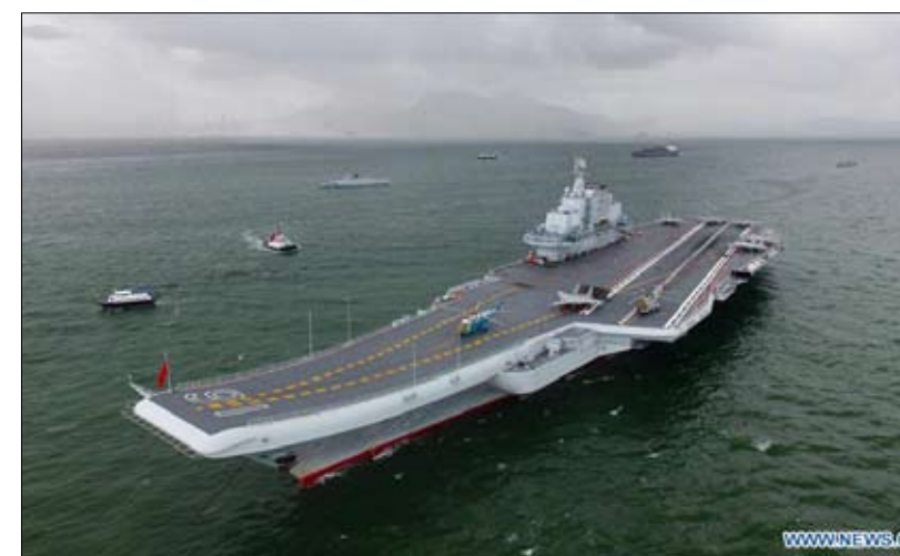
لياونينغ ثاني مكتسبات البحرية الشيوعية