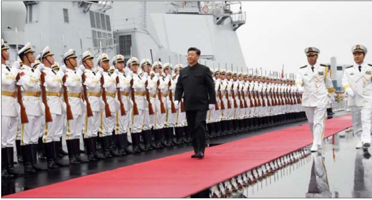
البحرية الصينية تواصل الارتقاء