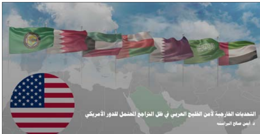
التحديات الخارجية لأمن الخليج العربي في ظل التراجع المحتمل للدور الأمريكي

الاحتياط والفرصة، تتطلب مشاركة دول الخليج في المحافل الدولية الهادفة إلى التعاون بشأن الجرائم الإلكترونية أو بناء القدرات وتبادل المعلومات التي تعتمد بشكل كبير على التقنيات الرقمية المتقدمة، مبنية أن التهديدات المختلفة التي قد تواجهها دول الخليج في الفضاء الإلكتروني، سواء حملات التجسس أو التحتية أو التهديدات المالية أو