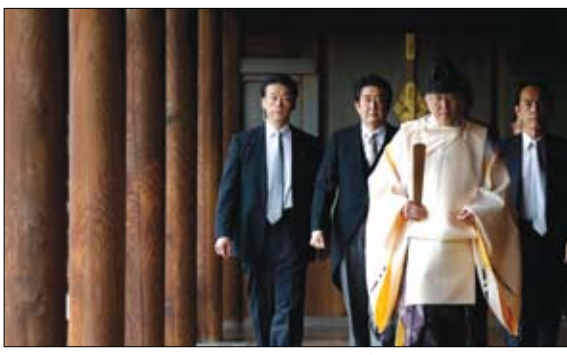
شينزو أبي يزور ضريح ياسوكوني

دعا وزير الخارجية الأميركي، أنتوني بلينكن، الثلاثاء، الصين إلى الامتناع لضرور التكريم الصادر عام 2016 الذي أغنى مطالب بكين في بحر الصين الجنوبي، محذراً من أن واشنطن ملزمة بالدفاع عن حليف المعاهدة الأميركية في ماينلا، أمس، ندعو جمهورية الصين الشعبية مرة أخرى إلى الوفاء بالتزاماتها بموجب القانون الدولي والتوقف عن سلوكها الاستفزازي.