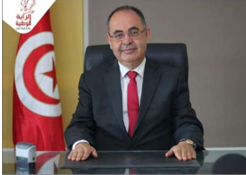
حزب الرابطة الوطنية يدعو إلى تأجيل الاستفتاء