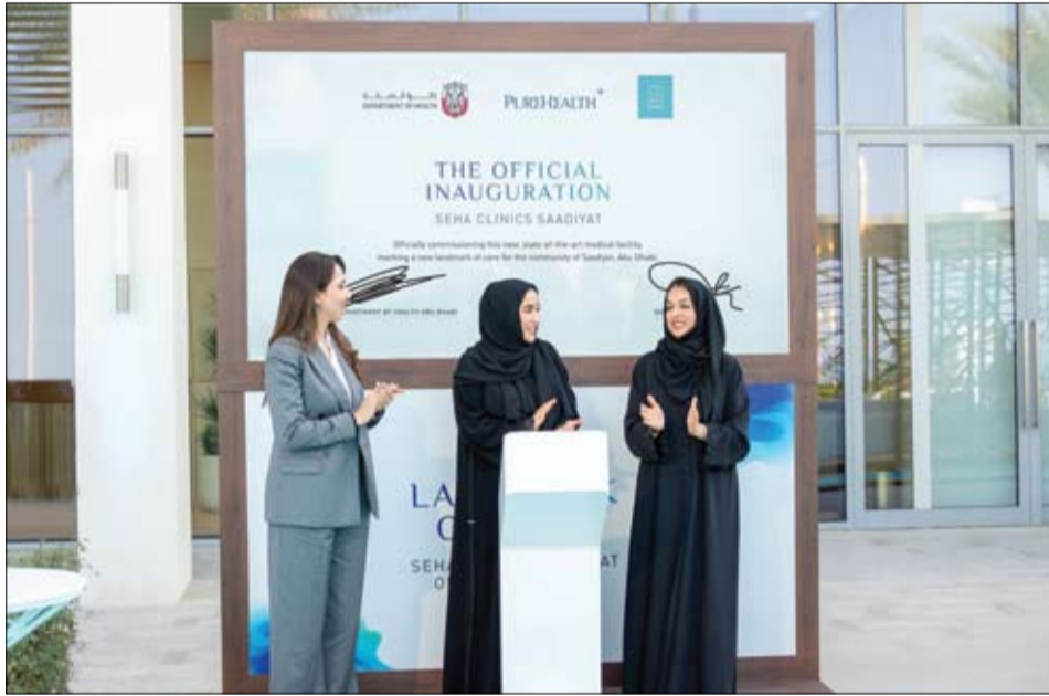
مرحلة الحياة من خلال تقديم رعاية شخصية وشاملة تحت سقف واحد لكافة الفئات العمرية، فيما نواصل في دائرة الصحة - أبوظبي تمكين شركائنا في القطاع الصحي من توسيع نطاق خدماتهم والاقتراب أكثر من

مع تكمن المستشفيات الكبرى من التركيز على الحالات المعقدة والمتقدمة. وصممت العيادة الجديدة والمنظورة وفق نموذج مبتكر يُمكنها من تلبية مختلف الاحتياجات الصحية للمقيمين في جزيرة السعديات وزوارها، حيث تفتح أبوابها طيلة أيام الأسبوع من الساعة 10 صباحاً إلى 6 مساءً وتقدم مجموعة واسعة من التخصصات، تشمل طب الأسرة، وطب الأطفال، وطب الأمراض الجلدية، وخدمات التشخيص، وصحة النساء، والعلاج الطبيعي، وغيرها. وتجمع العيادة بين الخبرات الطبية الموثوقة لـ«بيورهيلث» صحة، وتجربة رعاية صحية راقية تتمحور حول المريض، مع تركيز كبير على الراحة، وسهولة الوصول، والكفاءة في مختلف مراحل رحلة التعامل. ومن التسجيل الرقمي إلى خدمات الإرشاد المخصصة للمرضى، وصُممت المنشأة لضمان انسيابية الحركة، وحماية الخصوصية، وتوفير بيئة مريحة، مدعومة بالإضاءة الطبيعية والتصاميم الداخلية الراقية التي تتسجم مع الطابع الهادئ لجزيرة السعديات. ويعمل في «عيادات صحة» حالياً أكثر من 800 طبيب ضمن 35 عيادة موزعة في أبوظبي والعين. وإلى جانب علاج الأمراض، تلتزم العيادة الجديدة بإلهام وإرشاد المجتمع نحو اعتماد أسلوب صحي استباقي من خلال برامج الوقاية والعافية، والفعوات المجتمعية، ومبادرات التوعية والمشاركة.