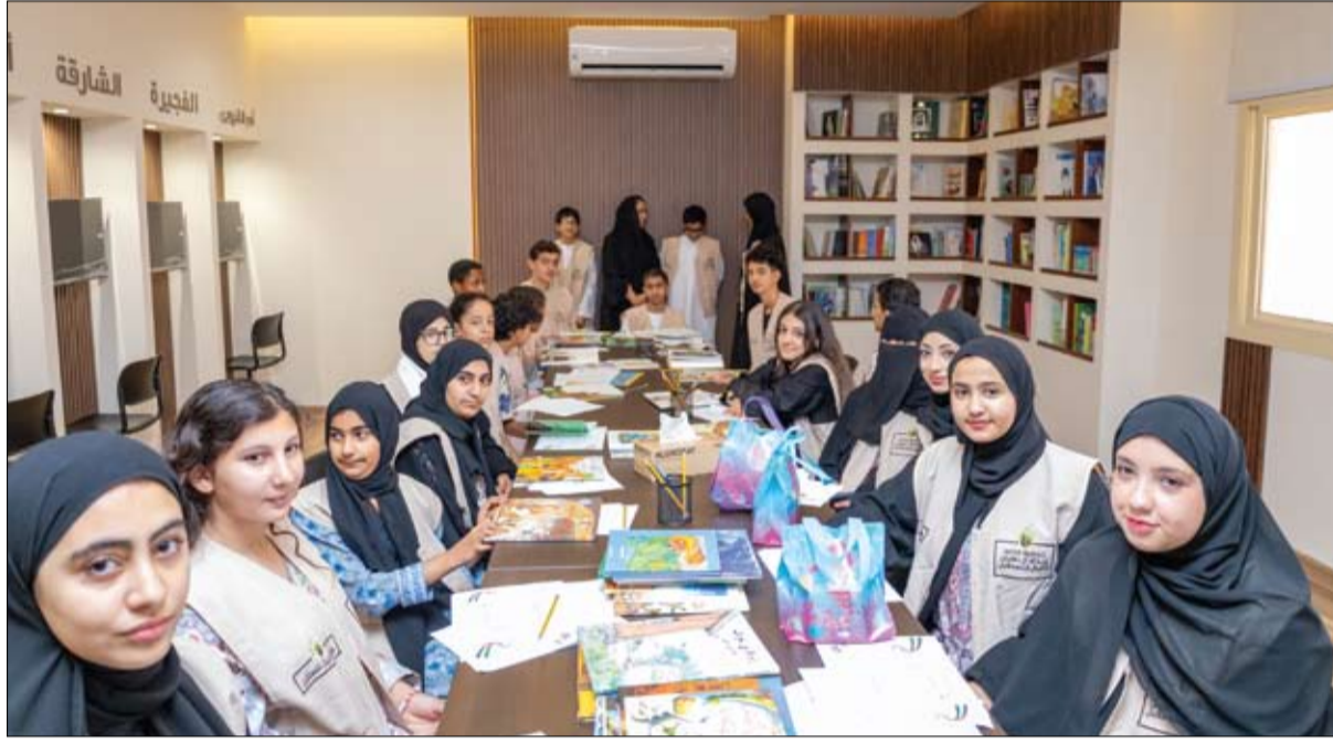
الدور الريادي الذي تضطلع به مؤسسات الشيخ محمد بن خالد آل نهيان على الإسهام الفاعل في مسيرة التنمية المستدامة لدولة الإمارات العربية المتحدة.

وتعبيراتهم الصادقة عن حب الوطن، كما أنصتت إلى قصصهم الوطنية التي عبروا من خلالها عن اعتزازهم بقيادتهم الرشيدة، وفخرهم بصاحب السمو الشيخ محمد بن زايد آل نهيان رئيس الدولة، حفظه الله، مستحضرين ما تمثله قيادته من إلهام وطني، ودعم دائم لأبناء الإمارات. كما شملت الجولة زيارة قاعة ريشة وفنان، حيث اطلعت السيدة شما على أفكارهم ومشاعرهم من خلال الفن، مؤكدة أهمية رعاية المواهب منذ الصغر، وتوفير البيئة التي تساعد الأطفال على اكتشاف ذواتهم وتنمية قدراتهم الإبداعية. وأكدت السيدة الدكتورة شما بنت محمد بن خالد آل نهيان، في تصريح لها، أن القراءة ليست نشاطاً مرفقياً فحسب، بل هي أساس في بناء شخصية الطفل، وتعزيز، وعيه بذاته ووطنه وقيمه. وأضافت أنها سعيدة بهذه الإضافة النوعية التي حرصنا عليها في مكتبة أجيال المستقبل، لأننا نؤمن بأن المكتبة ليست مكاناً للكتب فقط، بل فضاء لتكوين الإنسان، وتنمية خياله، وتعميق ارتباطه بهويته ووطنه. وقالت إن الطفل الذي يقرأ اليوم، هو مواطن أكثر وعياً وغداً، وأكثر قدرة على فهم دوره في خدمة مجتمعه ووطنه؛ ومن هنا نحرص على أن تكون القراءة تجربة محببة، وأن يشعر أبناؤنا بأن الكتاب صديق يفتح أمامهم أبواب المعرفة، ويقربهم من تاريخنا وقيمتنا وقيادتنا الرشيدة. وأضافت السيدة شما أن دور الأسرة يمثل الركيزة الأولى في بناء الطفل القارئ، مشيدة بجهود الأمهات وحرصهن على متابعة أبنائهن وتشجيعهم، مؤكدة أن عرس عادة القراءة يبدأ من البيت، ثم تكامل مع المدرسة والمكتبة والمؤسسات الثقافية. وتأتي فعالية أجيال تقرأ في حب الوطن تأكيداً على