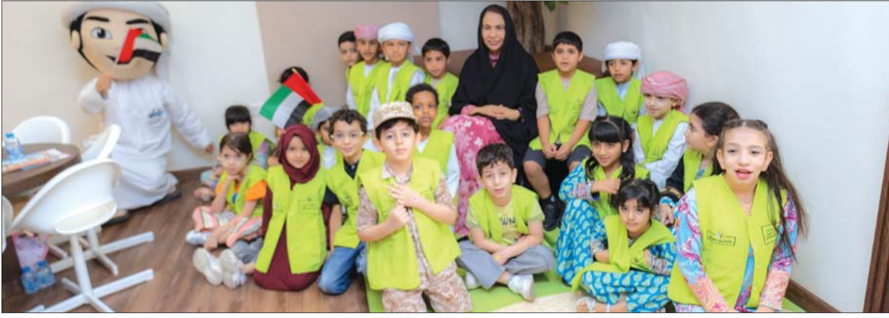
برعاية وحضور الدكتورة شما بنت محمد بن خالد آل نهيان