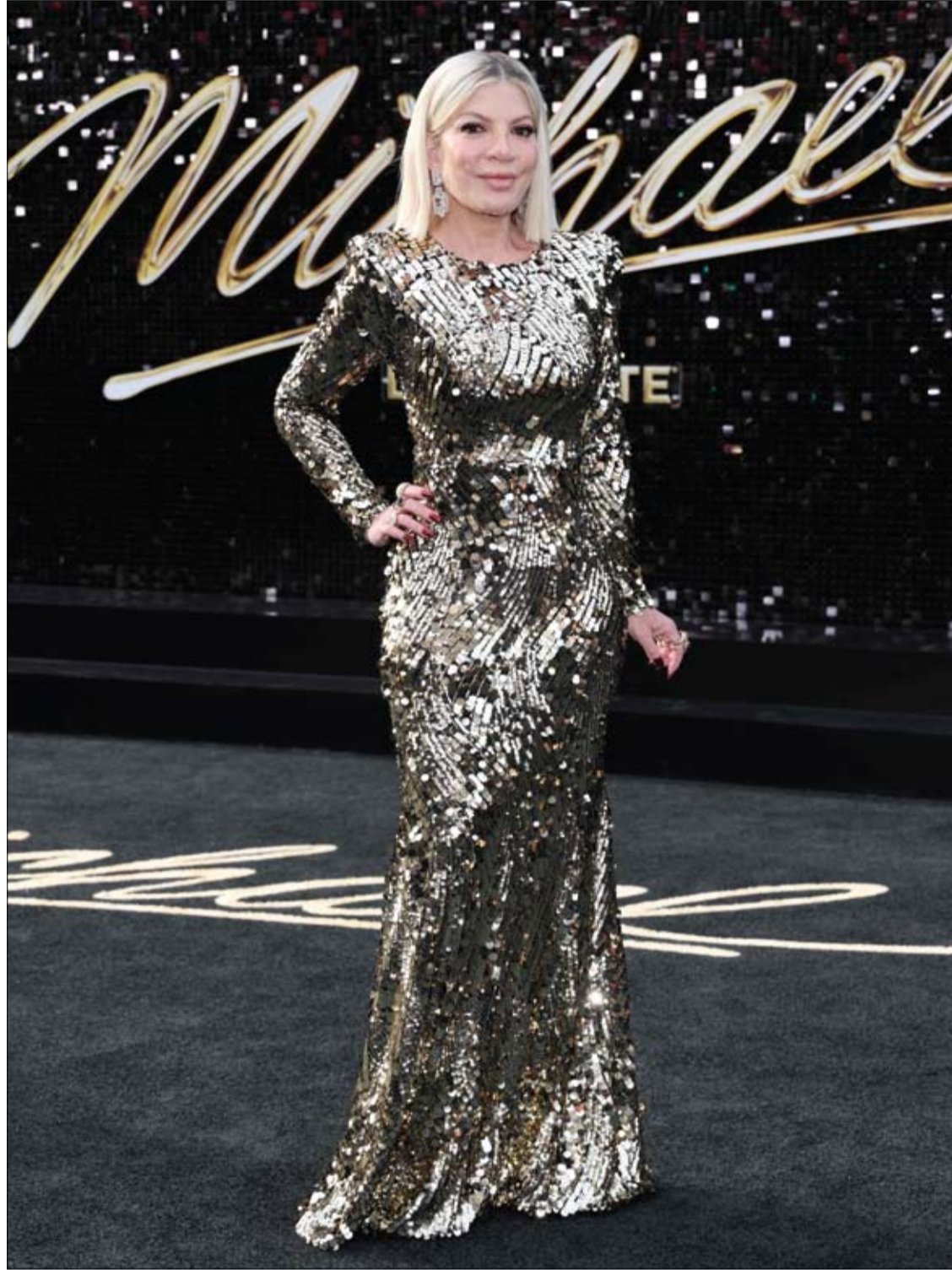
الممثلة الأمريكية توري سبيلينغ لدى حضورها العرض الأول لفيلم «مايكال»، في مسرح دولبي في هوليوود. ا ف ب

وخلص الباحثون إلى أن هذه الغرسة تمثل خياراً واعداً وآمناً للمرضى غير القادرين على استخدام جهاز CPAP، لكنهم أكدوا الحاجة إلى دراسات أطول لتقييم تأثيرها على المدى البعيد، خاصة فيما يتعلق بالوقاية من المضاعفات الخطيرة مثل أمراض القلب والسكتات الدماغية.