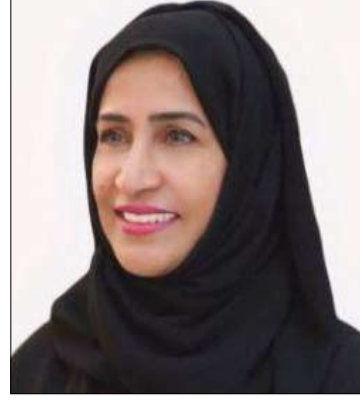
كتبت الدكتورة فاضمة الدربي

منذ تولي صاحب السمو الشيخ الدكتور سلطان بن محمد القاسمي عضو المجلس الأعلى للاتحاد حاكم إمارة الشارقة - حفظه الله - سطر عبر تاريخه الماجد سيرة عطرة عبر خمسين عاما لتوليها مقاليد الحكم في إمارة الشارقة، هي مسيرة حافلة توجت ذاتها بتأسيس اتحاد دولة الإمارات العربية المتحدة، وسموه - حفظه الله - كان له دور بارز خلال مسيرته الحافلة التي كانت بصمة براقية في مساندة المغفور له المؤسس الشيخ زايد بن سلطان آل نهيان - طيب الله ثراه - في تعزيز أركان الاتحاد، ودعمه على كافة الصعد.