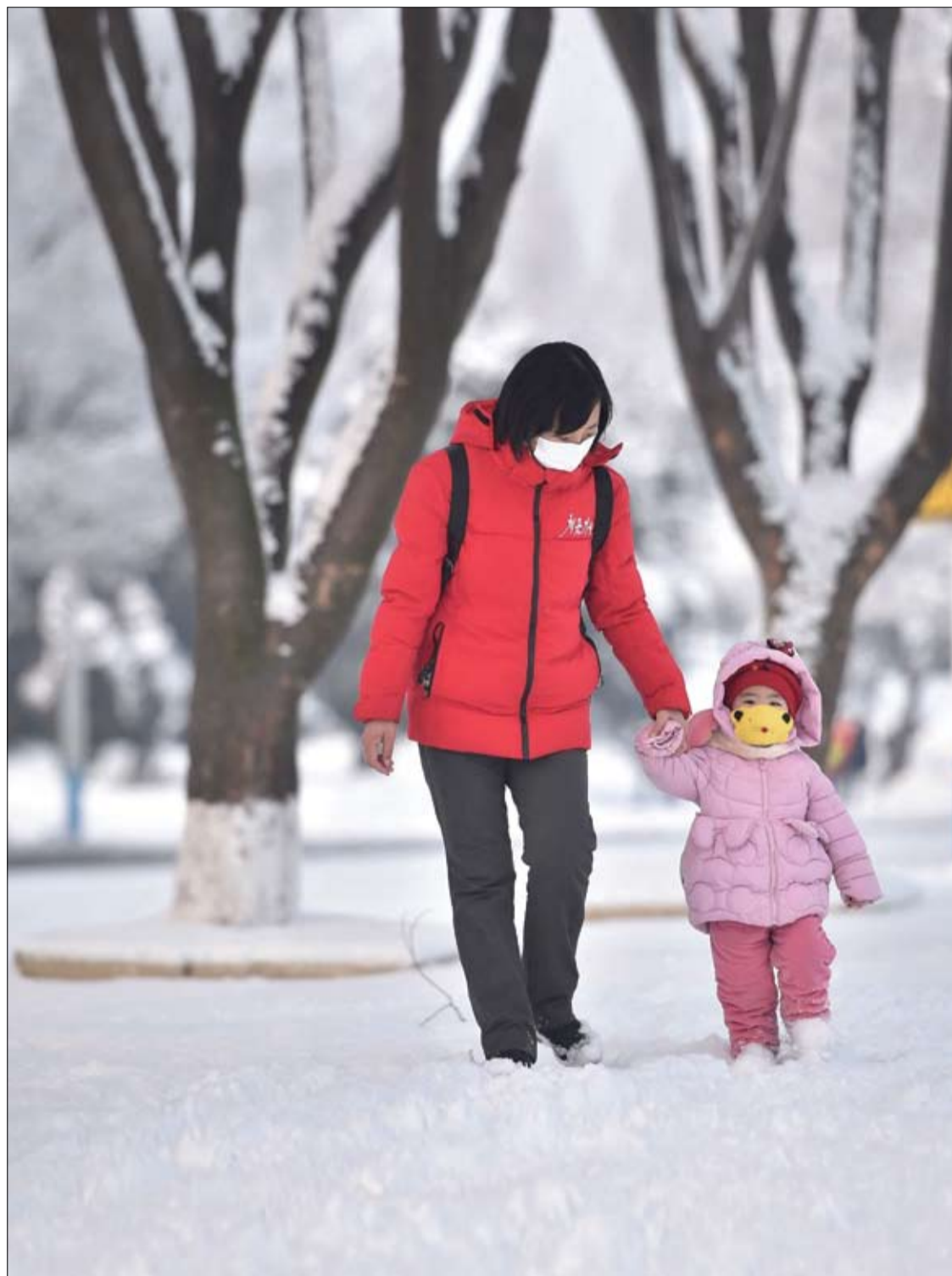
امراة تمشي مع طفلتها على طول شارع ثلجي أثناء احتفالهما بالعام القمري الجديد في بيونغ يانغ.