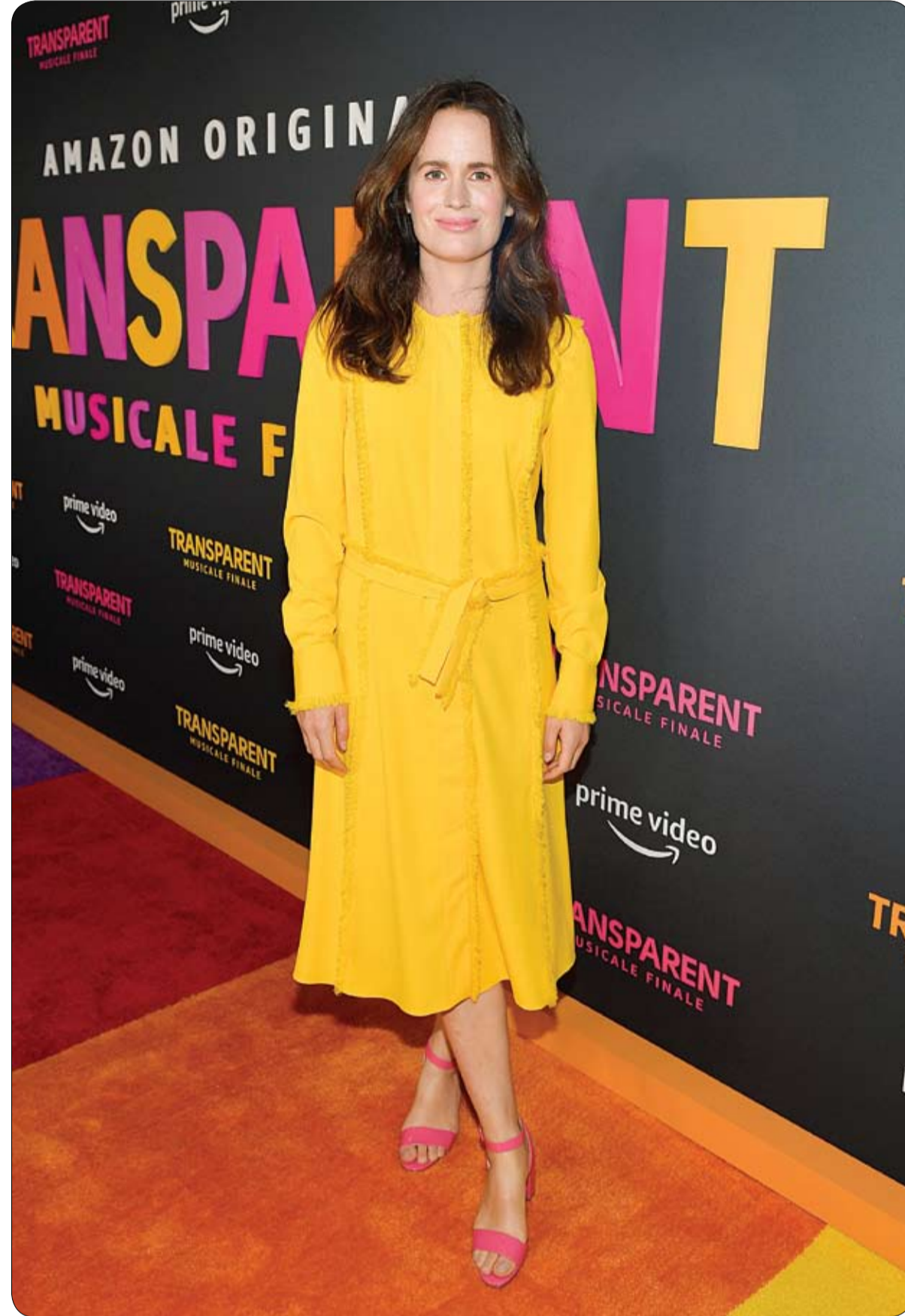
إليزابيث ريسر خلال حضورها العرض الأول لفيلم 'Transparent Musicales Finale' في لوس أنجلوس، كاليفورنيا.

كشف علماء أنهم توصلوا إلى الحيوان الصاعق، الذي يمكنه إصدار أكبر شحنة كهربائية مسجلة بين الحيوانات المتمتع بهذه الميزة الفريدة. والحيوان المذكور نوع غير مسبق من ثعابين البحر الكهربائي، واكتشفه الباحثون في حوض نهر الأمازون. وحسبما ذكرت شبكة "فوكس نيوز" الأمريكية، فإن الثعبان البحري قادر على توليد شحنة كهربائية قوتها 860 فولت، ليتنقذ بذلك على كل الحيوانات المعرفة حتى الآن.