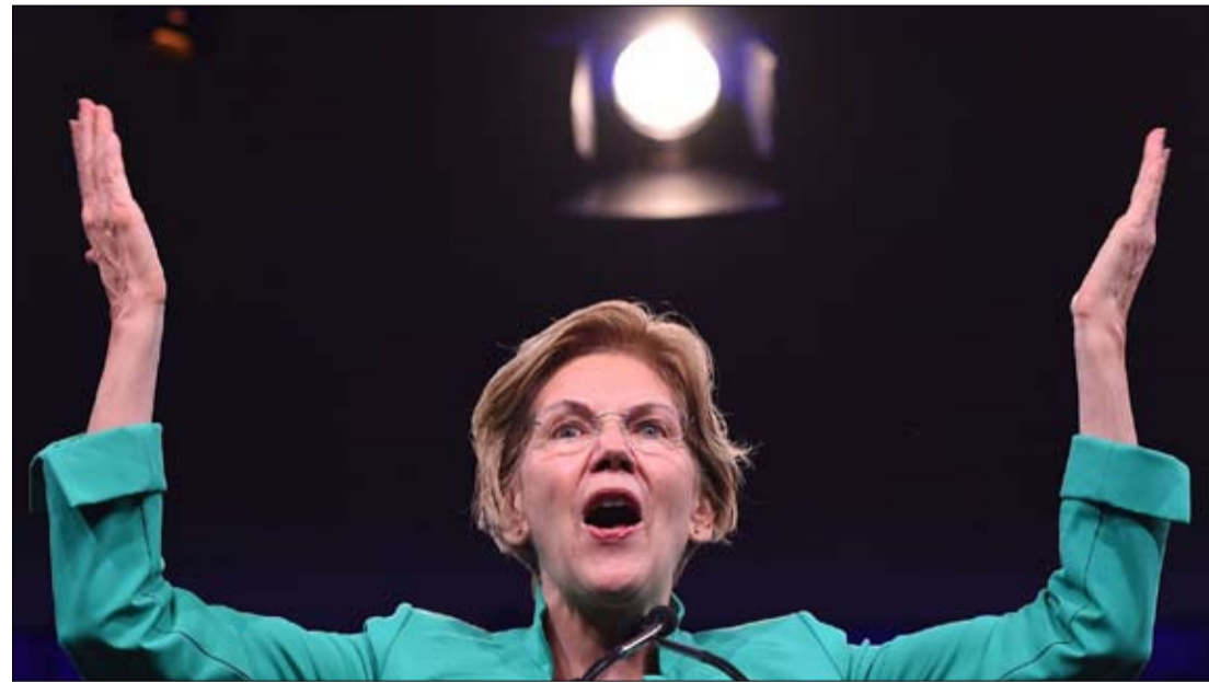
اليزابيث وارن تجنبت الصدام مع بايدن