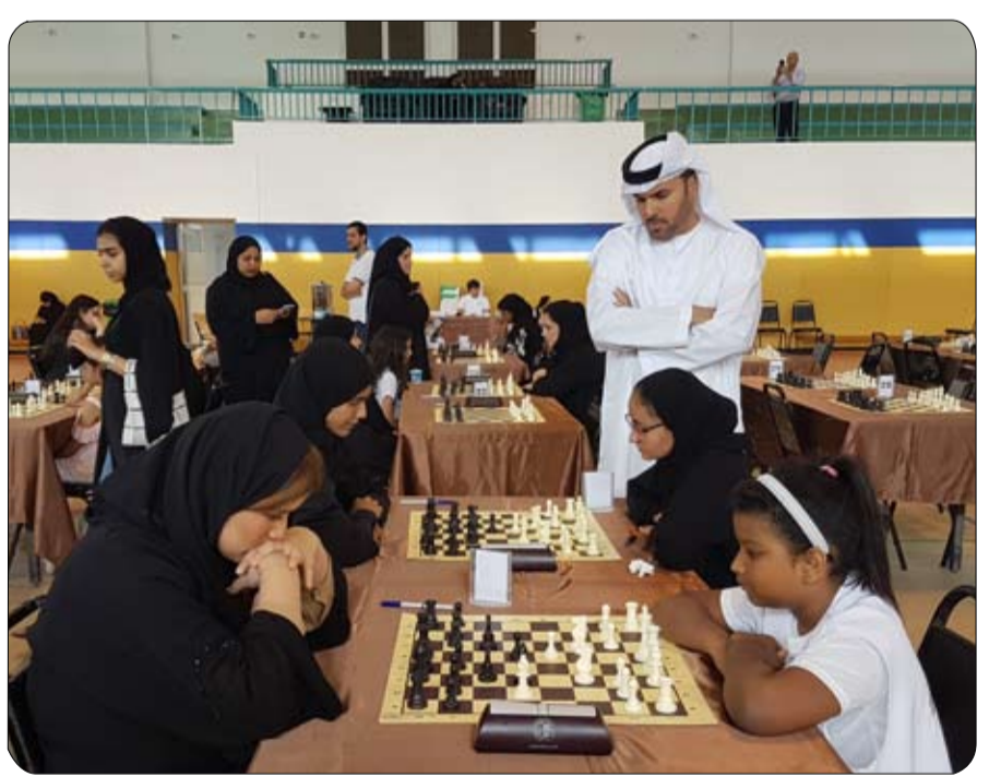
واختتم رئيس الاتحاد بتوجيه الشكر إلى نادي الشطرنج والثقافة للفتيات بالشارقة وإلى مركز الطفل بالرفقة على فتح أبواب القاعة أمام الحكام واللجنة الفنية بالبطولة.