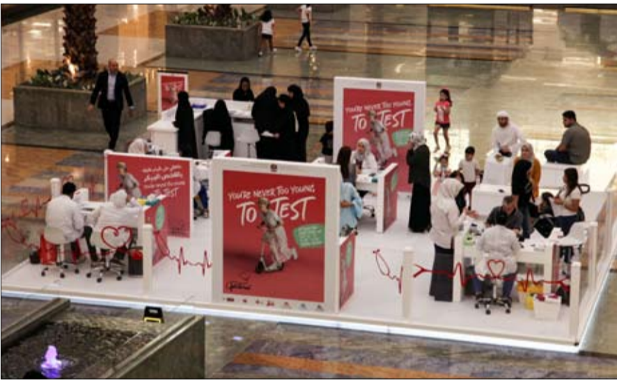
بأمراض القلب والسكتة الدماغية وعوامل الخطر المصاحبة لها. في المحافظة على صحة القلب والتقليل من مخاطر الإصابة