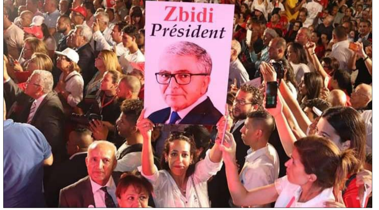
الزبيدي يكسب بعض النقاط قبل الاقتراع