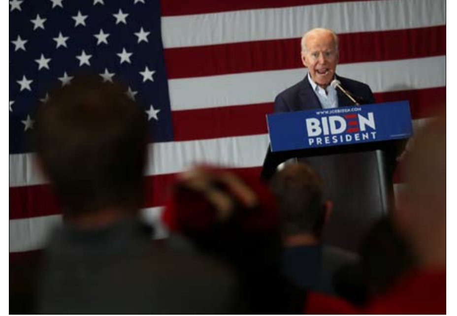
جون بايدن يعزز تقدمه