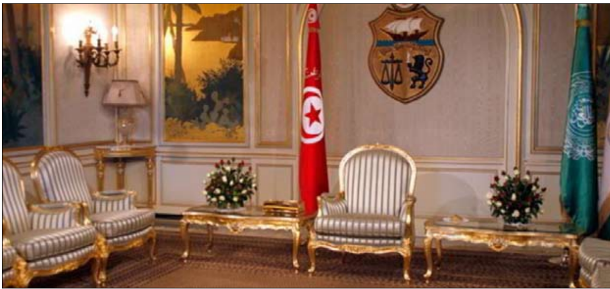
تونس تختار رئيسها