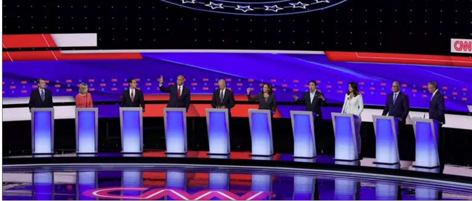
ويستمر الجدل في المناظرة الثالثة للديمقراطيين