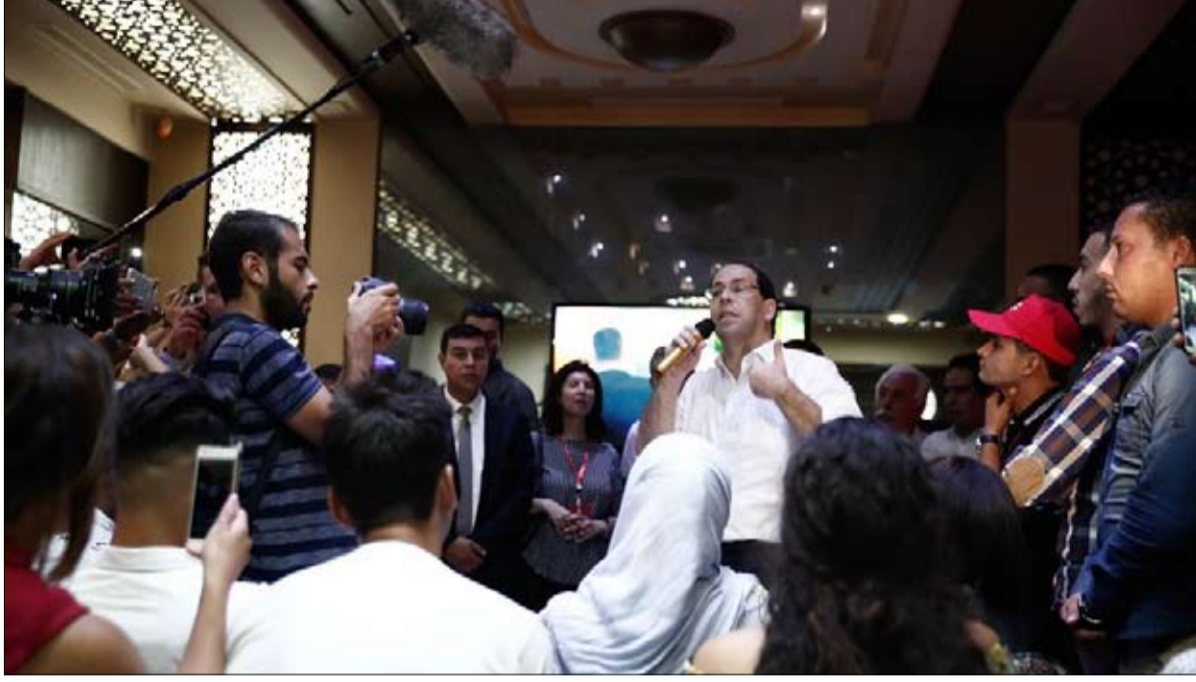
الشاهد يعاتب معسكر الزبيدي