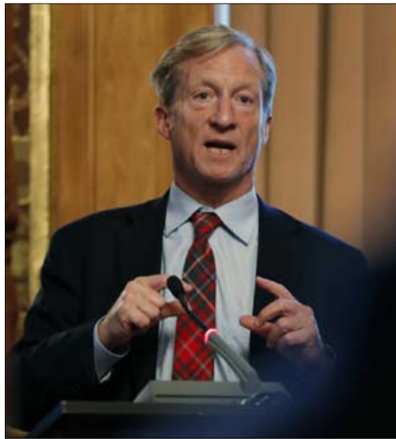
الملياردير توم ستاير يلتحق بالمجموعة

وقال "إذا كنتم تعتقدون أنهم تستطيعون حل مشاكلكم بشكل أفضل من أي سياسي، فانقلوا إلى موقع يانغ2020 وأخبرونا كيف سيساعدكم مبلغ الألف دولار شهريا على حلها". "هنا متفرد ومتميز، أنا موافق" علق بيت بوتيجيج، مرشح آخر، متفاجئا. وطبعًا انشجر حساب يانغ على تويتر. وللأسف، لم يقم المتنافسون التسعة الآخرون إلى البيت