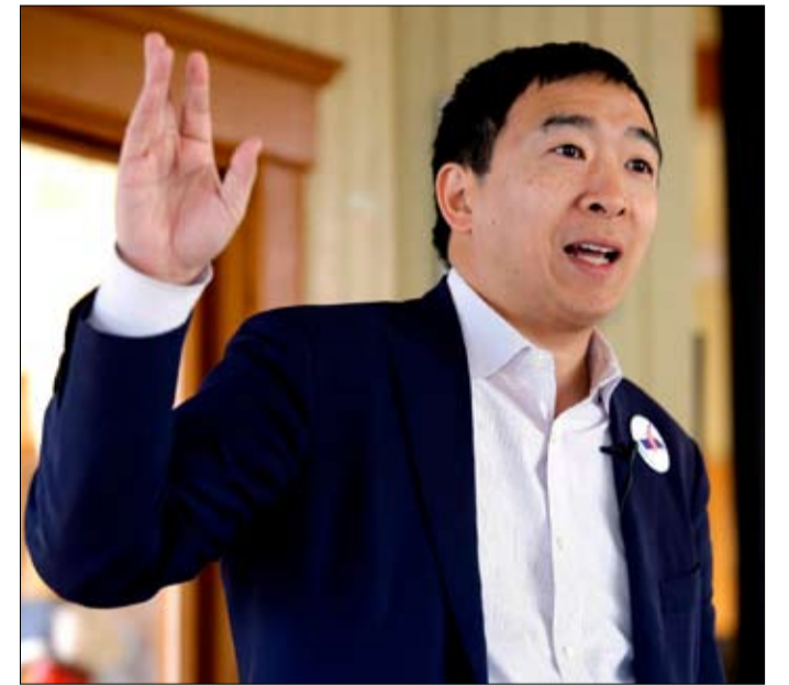
اندرو يانغ كرم حائمي لن يسعفه