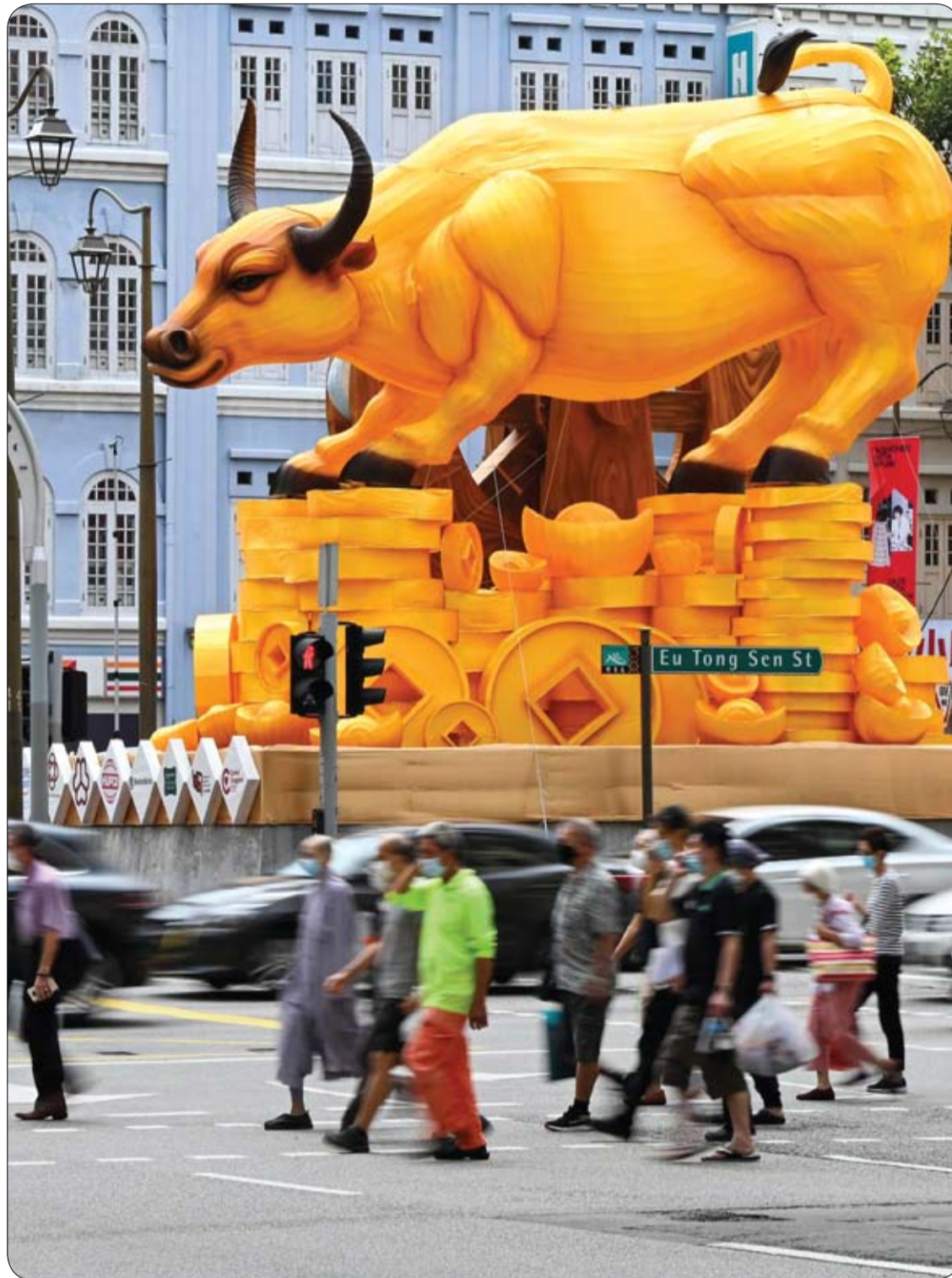
المشاة وسائقو السيارات يمرون على طول شارع مزين بمناسبة السنة القمرية الجديدة عام الثور في سنغافورة.

ويتمكن أن يشير هذا إلى تحذير مبكر للأطباء بأنهم بحاجة إلى التحقيق وتقييم مخاطر إصابة مريضهم بنوبة قلبية أو سكتة دماغية. وفي النهاية، إذا تمكنت من تحديد هذه الحالة في وقت أقرب، يمكن للناس إجراء تغييرات في نمط الحياة وبدء العلاجات الوقائية في وقت مبكر، ما قد ينقذ العديد من الأرواح في المستقبل. وتعمدت الدراسة، التي نُشرت في مجلة جمعية القلب الأمريكية، على بحث حول AAC باستخدام فحوصات كثافة العظام والذكاء الاصطناعي. وقالت الدكتورة أماندا باتري، من مؤسسة القلب الوطنية في أستراليا: "وجد الباحثون دليلا على وجود تكلس في الشريان الأورطي البطني لدى مرضى ليس لديهم أمراض قلبية وعائية معروفة، قد يشير إلى ضرورة إجراء تقييم شامل لمخاطر القلب والأوعية الدموية - بما في ذلك اختبار ضغط الدم والكوليسترول".