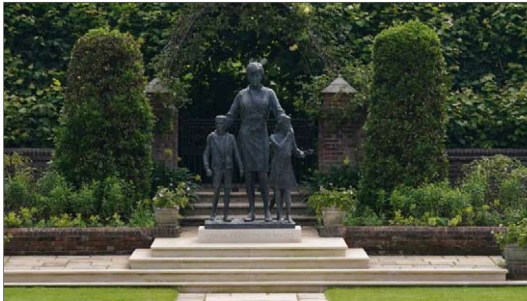
تمثال الأميرة ديانا بعد أن أزاح الستار عنه وويليام وهاري