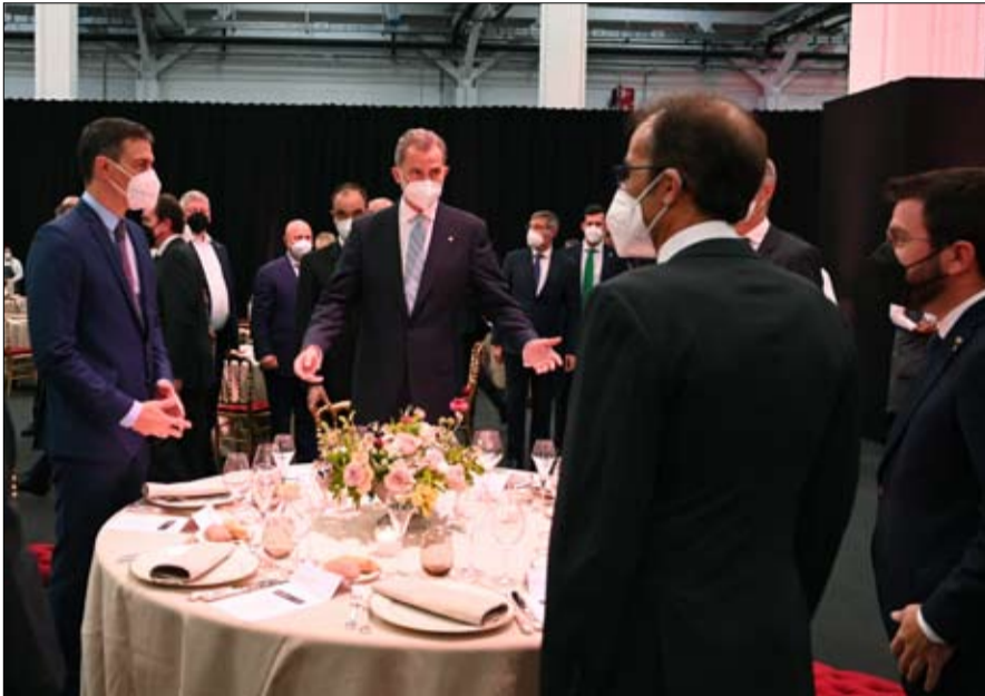
بيدرو سانشيز والملك فيليب السادس وبيير أراغون في حفل عشاء في المؤتمر العالمي للحوار في برشلونة

إن الذين يعارضون إجراءات العفو هم أقلية، يلاحظ أوريول بارتوموس، لكنني أعتقد أنهم يحاولون الحد من هامش المناورة للمتخفين على التفاوض، من خلال التأكيد على أنه إذا تحدثت الجنراليات مع الحكومة المركزية، فسيكونون خونة. أما على الجانب الآخر، سيحاول اليمين واليمين المتطرف منع السلطة التنفيذية الوطنية من المناقشة مع الحكومة الكتالونية، بإفهامها أنه إذا فعلت ذلك، ستسخر الانتخابات... الآن سترى ما إذا كان الذين يريدون التفاوض سيجرؤون على خوضه.