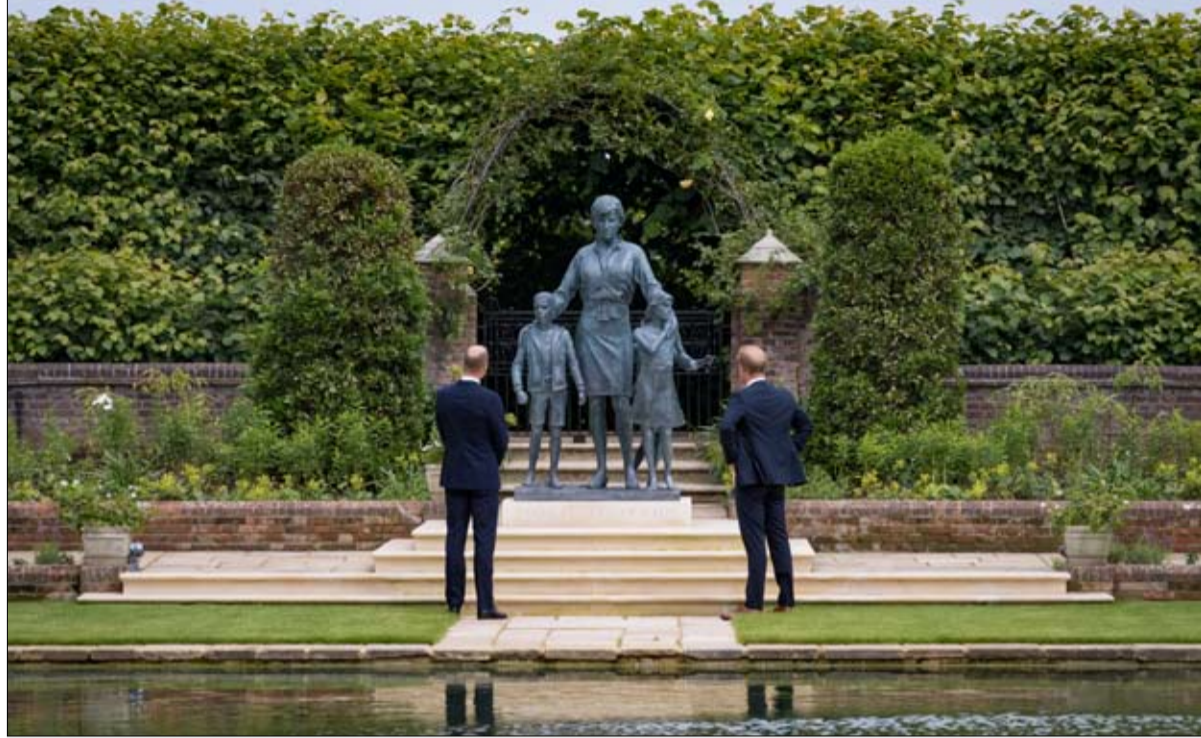
الشقيقان في انفراد بعيداً عن الاضواء