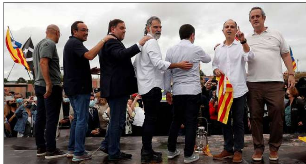
قادة كتالونيا في برشلونة، بعد الحصول على العفو