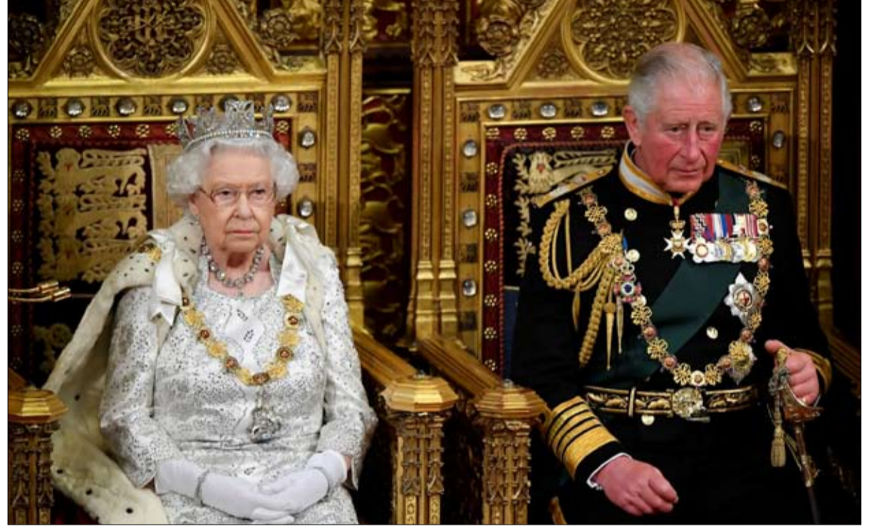
غاب الأمير تشارلز، والملكة إليزابيث، عن الاحتفالية