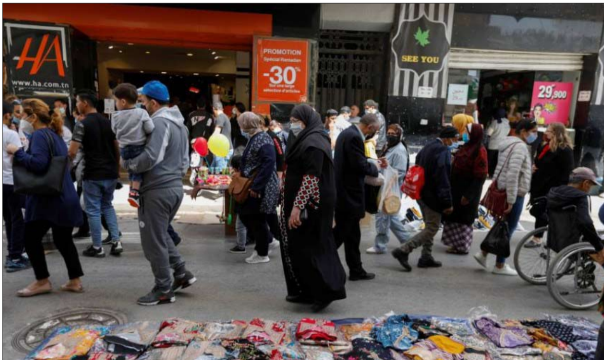
التشاؤم سيد الموقف