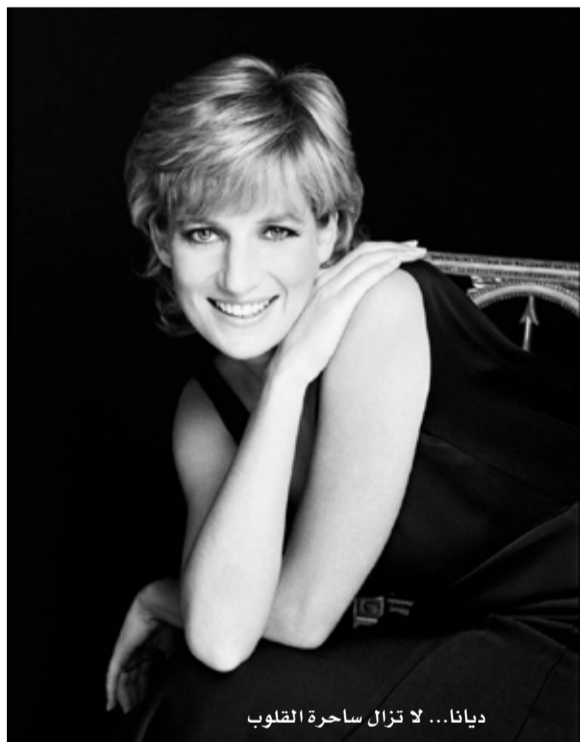
ديانا... لا تزال ساحرة القلوب

ولسبب وجيه: تم إيقافهم بدقة من قبل أجهزة القصر أسفل الحديقة حيث أقيم