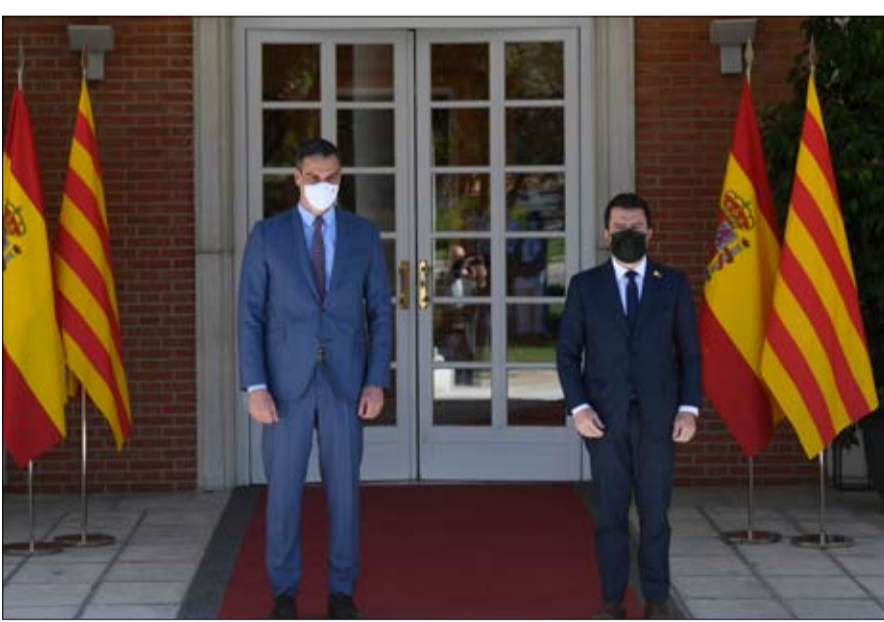
بيدرو سانشيز (يسار) وبيير أراغون (يمين)، في 29 يونيو، في قصر موكلوا، في مدريد