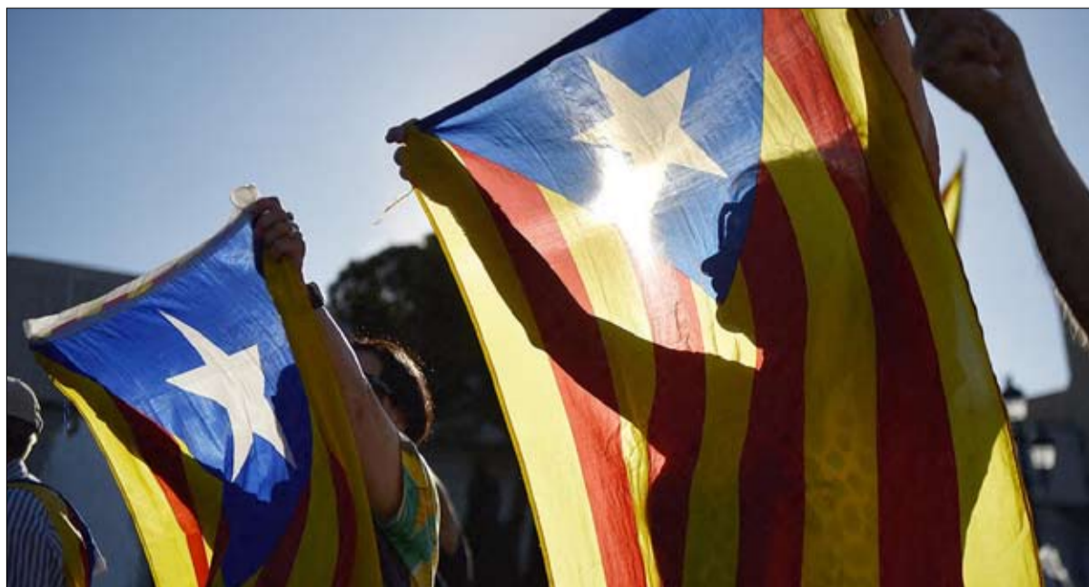
مظاهرة مناصرة للانفصال