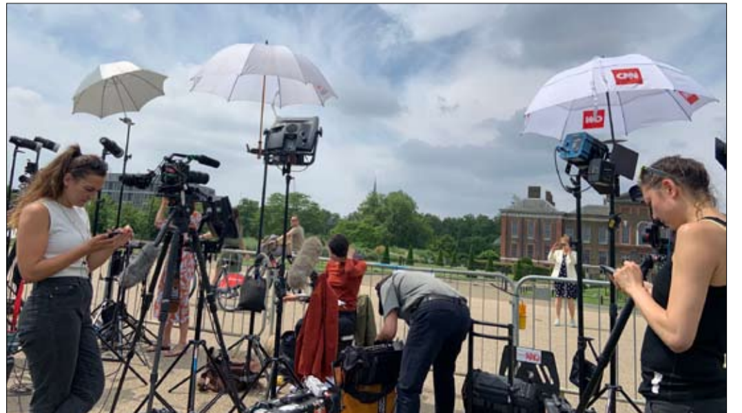
وسائل الاعلام بقيت في التسلل

يمثل الاستبعاد رغبة في عدم تقديم رفع الستار كحدث ملكي، بل حدث عائلي، وبالتالي أكثر حميمية