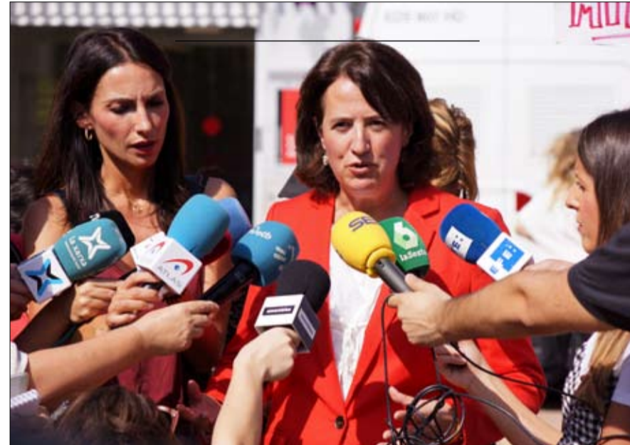
إليسيندا بالوزي، رئيسة المنظمة الانفصالية الكتالونية الرابطة الوطنية، في برشلونة

ليس هذا هو السبب الوحيد. الحكومة الكتالونية الحالية هي انتلاف من ثلاثة أحزاب تطمح إلى الاستقلال. الاشتراكيون الديمقراطيون من "اليسار الجمهوري" في كتالونيا، داخل المعسكر الانفصالي نفسه، يضع أستاذ العلوم السياسية في السياق، اليوم، يظهر "اليسار الجمهوري" في كتالونيا، موقفاً أكثر براغماتية لإرضاء جزء من الناخبين الانفصاليين ممن