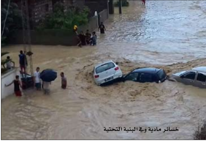
خسائر مادية وفي البنية التحتية

بمحافظة نابل سيلان المياه بغزارة من المرتفعات وفيضان عدة أودية وارتفاع منسوب المياه بالطرق والأنهج مع عجز قنوات تصريف المياه على استيعاب الكميات المناسبة مما أدى إلى تسربها إلى عدة منازل ومؤسسات صناعية وتجارية وانقطاع حركة المرور. وفتحت إلى أن فرق النجدة تواصل تقديم المساعدة اللازمة للمواطنين، وإلى أنه تم تعزيز الوحدات المتدخلة بمضخات مائية إضافية وشاحنات نقل من الوحدات الجهوية للحماية المدنية بتونس وأريانة ومنوبة وبن عروس وينزرت وياجدة والقيروان وقابس ومدنين وقفصة وزغوان إضافة إلى الوحدة المختصة للحماية المدنية.