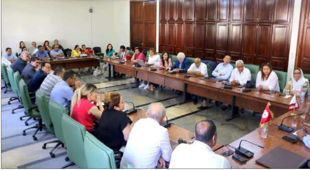
الكتلة البرلمانية لنداء تونس موسم الهجرة الى الشاهد