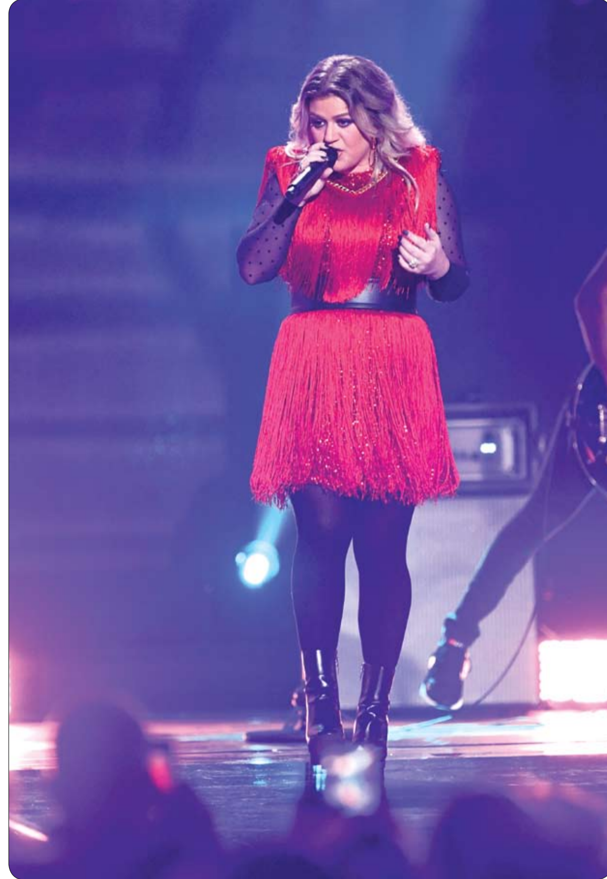
المغنية كيلي كلاركسون تقدم عرضاً مسرحياً خلال مهرجان ايهيرت راديو الموسيقي في ساحة تي موبایل في لاس فيغاس.

وقتل المهندس الذي كان يعمل في منتزه سليف جولين فورست في نيوري عندما ضربت الرياح العاصفة البلاد بقوة تبلغ 90 ميل في الساعة الواحدة، مما تسبب في عدد من الكوارث، وتقول روبن المكومة لصحيفة الإندبندنت: لقد أدركت لأول مرة أن هناك خطأ ما عندما حاولت أن اتصل به في وقت الغذاء واستمر جهاز الرد على المكالمات في الرد على، حاولت الاتصال به ست مرات ولم يكن هناك جواب. وأضاف: جاء ضابط شرطة إلى مكان عملي وأخبرني أنه كان هناك حادث وأنه لم ينح مستردة وسلم دموعها: "اعتقدت أنها كانت كتلة، أو أنه كان يكذب فقط.