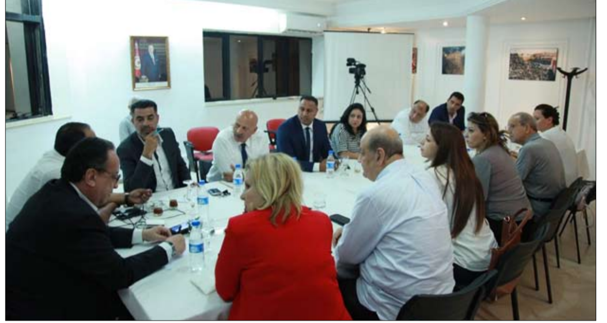
اجتماع الهيئة السياسية لنداء تونس