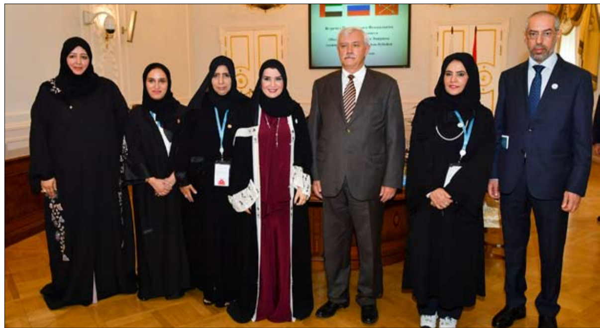
ويخططها واستراتيجياتها التي تنفذها موكدا أنها تحظى بإعجاب واحترام العالم بما تطلعه من مبادرات وتبنيها من خطط، مشيراً إلى أهمية الاستفادة من تجربة الإمارات في عدد من القطاعات الاقتصادية والنشاط الثقافي.