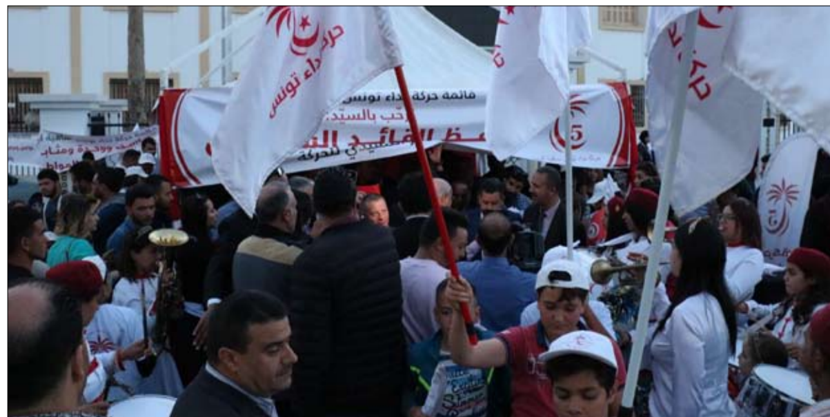
هل هو خريف النداء ونهاية حدثه؟