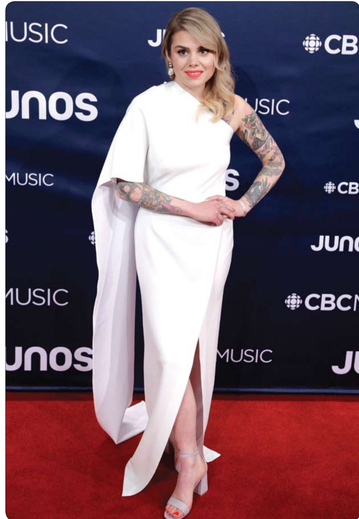
كور دي بيرات لدى وصولها لحضور مهرجان جوائز Juno لعام 2019 في لندن.

وتتميز هذه الحقيبة التي تم إنتاجها ضمن مجموعة خريف 2019 بأنها تصلح كحقيبة للنوم، وتتسع لأشياء كبيرة مثل الأغذية والسنان، واحتوائها على الكثير من المقصورات والجيب، وقد تم طرح هذا المنتج لأول مرة في عرض أزياء لويس فوتون للرجال لخريف وشتاء 2019 في بداية هذا العام.