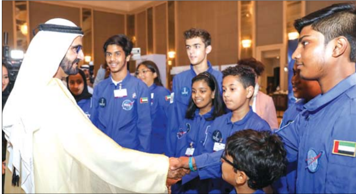
محمد بن راشد يصافح أبناءه من الشباب خلال افتتاح مؤتمر الفضاء العالمي في أبوظبي

•• أبوظبي-وام: استقبل صاحب السمو الشيخ محمد بن زايد آل نهيان ولي عهد أبوظبي نائب القائد الأعلى للقوات المسلحة أمس في قصر البحر كريستوفر كوباسيك الرئيس التنفيذي لشركة «إل 3 تكنولوجيا» الأميركية المتخصصة في قطاع أنظمة أمن الطيران الدفاعية. ويحت الجانبان - خلال اللقاء - إمكانات وفرص التعاون بين الشركة ونظيراتها في دولة الإمارات من الشركات المتخصصة والمؤسسات المعنية بمجالات تكنولوجيا الطيران بما يدعم فرص هذه الصناعة الوطنية الواعدة في الدولة. كما تبادل سموه ورئيس شركة «إل 3 تكنولوجيا» وجهات النظر بشأن عدد من الموضوعات ذات الاهتمام المشترك. حضر اللقاء.. سعادة محمد مبارك المزروعى وكيل ديوان ولي عهد أبوظبي والوفد المرافق للرئيس التنفيذي لشركة «إل 3 تكنولوجيا».