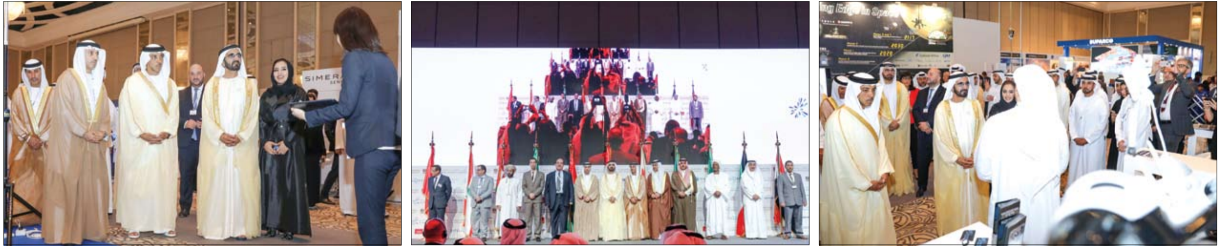
ضمن فعاليات مؤتمر الفضاء العالمي في أبوظبي