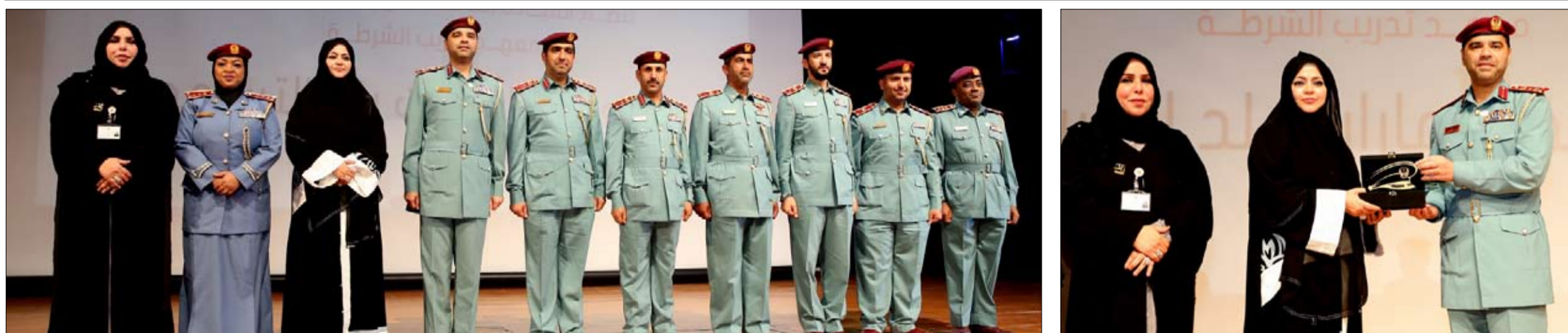
(الإمارات بلد التسامح)

•• أبو ظبي-الفسج: أكدت معالي الدكتورة أمل عبد الله القبيسي رئيسة المجلس الوطني الاتحادي أن سعادة شعب الامارات كانت وستظل أولوية قصوى لدى قيادتنا الرشيدة، التي تعمل لتلازقها بالوطن وتعزيز رفاهية المواطن، حيث تنظر دولة الإمارات إلى المستقبل بروح الثقة بين الشعب والقيادة والتساؤل والابتكار والرؤية المستقبلية الواضحة التي تحمل رسالة التسامح والسلام، وتهدف إلى إسعاد شعب الإمارات والدول الشقيقة والصديقة، فحكومة الإمارات هي حكومة مستقبل تنظر إلى التحديات التي تواجهها المنطقة، وتسعى لأن تكون منارة للعمل والمستقبل والسعادة والأمل. وأشارت معاليها الي أن مفهوم السعادة يتجلى بأبهى صورته في رؤية صاحب السمو الشيخ خليفة بن زايد آل نهيان رئيس الدولة، حفظه الله، في أن سعادة المواطن أولوية قصوى، وتوجيهات أخيه