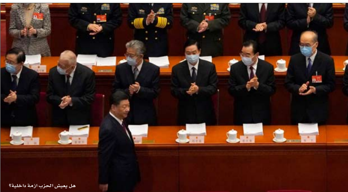
هل يعيش الحزب أزمة داخلية؟