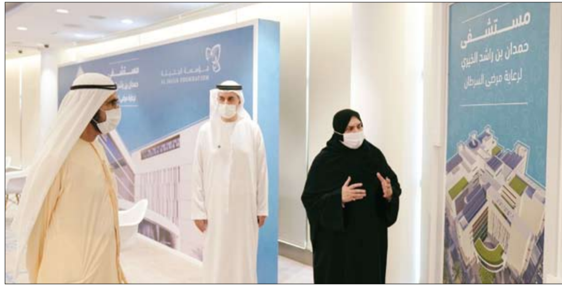
محمد بن راشد خلال اطلاعه على مكونات مستشفى حمدان بن راشد الخيري لرعاية مرضى السرطان

•• أبوظبي- وام: في إطار توجيحات صاحب السمو الشيخ محمد بن زايد آل نهيان ولي عهد أبوظبي نائب القائد الأعلى للقوات المسلحة ، رئيس مكتب فخر الوطن، بتقديم مختلف أوجه الدعم للعاملين في خط الدفاع الأول.. أطلق مكتب فخر الوطن أمس برنامج منح دراسية في التعليم العالي في الجامعات والكليات الحكومية والخاصة على مستوى الدولة. تقدم إلى العاملين في خط الدفاع الأول وأبنائهم. (التفاصيل ص3)