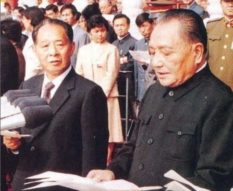
رموز الإصلاح في الميزان

• الفجر - أليكس باييت - ترجمة خيرة الشيباني في مقال نُشر في ماكاو في 25 مارس وخضع للرقابة في بكين، هاجم وين جيا باو، رئيس الوزراء السابق في عهد هو جينتاو، السلطة المركزية وجميع المنجز السياسي لشي جين بينغ. فبالنسبة له، "يجب أن