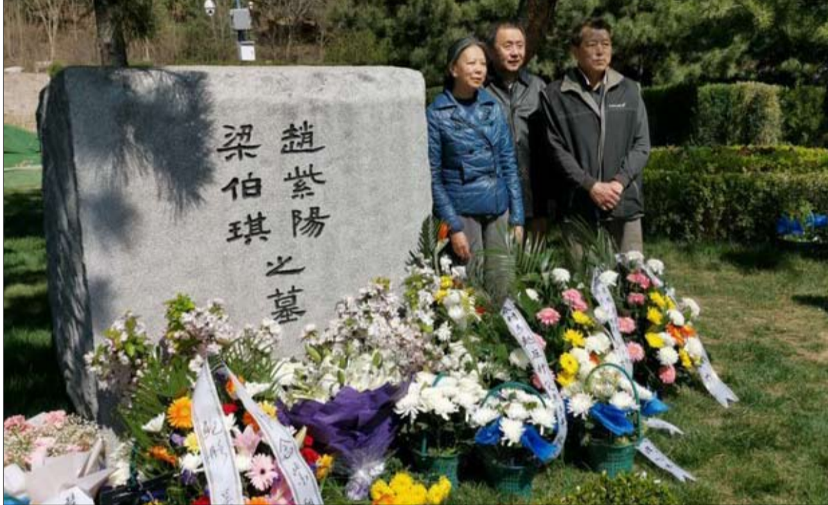
سمح فقط لعائلة تشاو زيانغ بزيارة قبره