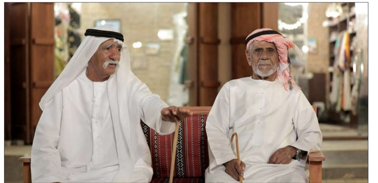
يعرض على «الشرقية من كلباء» يوميا عند 22:00 مساءً