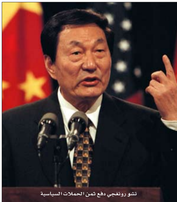
تشو رونججي دفع ضمن الحملات السياسية عن تياراته الفكرية

وانغ كيشان و"الضيف المؤقت"، مقالة وين هي مجرد واحدة من الأحداث الأخيرة التي تثير العديد من الأسئلة حول الوضع داخل الحزب. كانت الحلقة السياسية الثالثة الأخرى، هي منتدى بواو