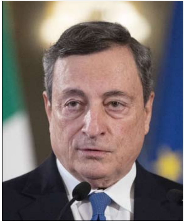
ماريو دراغي نجم صاعد

ويدعم التقرير استنتاجات مماثلة من قبل جماعات حقوقية إسرائيلية وفلسطينية ويأتي في وقت أعلنت المحكمة الجنائية الدولية فتح تحقيق في "جرائم حرب" في الأراضي الفلسطينية المحتلة. وتنفي إسرائيل أن تكون ترتكب جريمة الفصل العنصري أو غيرها من الجرائم ضد الإنسانية.