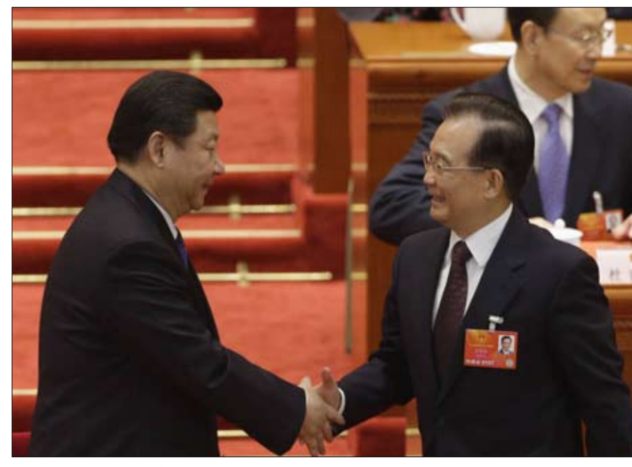
شي جين بينغ ورئيس مجلس الدولة السابق وين جيا باو خلال تعيين شي رسمياً كرئيس للدولة