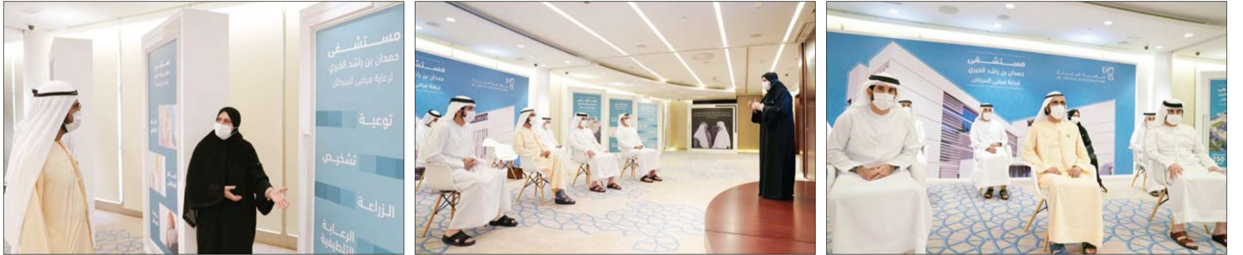
بدعم من سموه وهو الأول من نوعه على مستوى الإمارات:

بعث صاحب السمو الشيخ خليفة بن زايد آل نهيان رئيس الدولة "حفظه الله" برقية تهنئة إلى فخامة فور غناسينغي رئيس جمهورية تونغو بمناسبة ذكرى استقلال بلاده. كما بعث صاحب السمو الشيخ محمد بن راشد آل مكتوم نائب رئيس الدولة رئيس مجلس الوزراء حاكم دبي "رعاه الله" وصاحب السمو الشيخ محمد بن زايد آل نهيان ولي عهد أبوظبي نائب القائد الأعلى للقوات المسلحة برقيتي تهنئة مماثلتين إلى فخامة الرئيس فور غناسينغي.