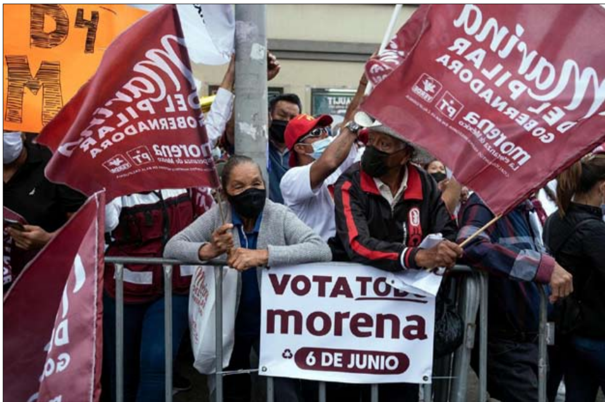
مورينا، حزب الرئيس المكسيكي في وضع غير مريح

العقاب في نخر نظامي القضاء والشرطة المكسيكيين، حيث يتم إغلاق ملفات أكثر من 90 بالائة من الجرائم المبلغ عنها. «املو»، الذي وعد عند انتخابه رئيساً للدولة في يونيو 2018، بمقاربة جديدة لإضعاف أباطرة المخدرات، أي مكافحة الفساد، لم يغير شيئاً، لكن يبدو أن المكسيكيين لا يقفون ضده. لا يزال تصنيف شعبية هذا الرئيس "الشعبي" و"الراديكالي"، الذي يمثل "خطراً على الديمقراطية"، وفق الإيكونوميست، تصل إلى أكثر من 60 بالائة، خاصة بين الأكثر فقراً. عن لو جورنال دي ديمانش