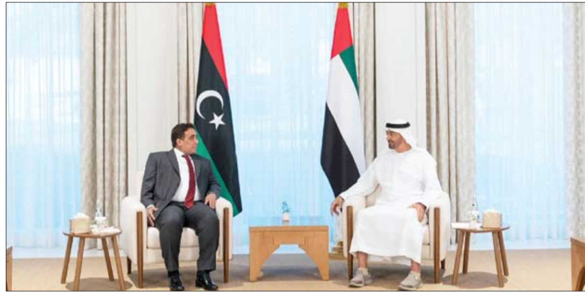
محمد بن زايد خلال استقباله رئيس المجلس الرئاسي في ليبيا (وام)

أعلنت وزارة التربية والتعليم عن تمديد فترة التسجيل في مبادرة سفرأونا الوطنية، برنامج (استعداد) إلى يوم الخميس المقبل الموافق 10 يونيو الجاري، حيث يستهدف الطلبة المواطنين والمقيمين في الصفوف 9 إلى 12 الذين لديهم شغف واهمية للتعليم الذاتي في المدارس الحكومية، وكذلك للطلبة الصف الثامن للمهنيين للصف التاسع، وطلبة الصف الثاني عشر المتأهلين للمرحلة الجامعية في السنة الدراسية القادمة. (التفاصيل ص5)