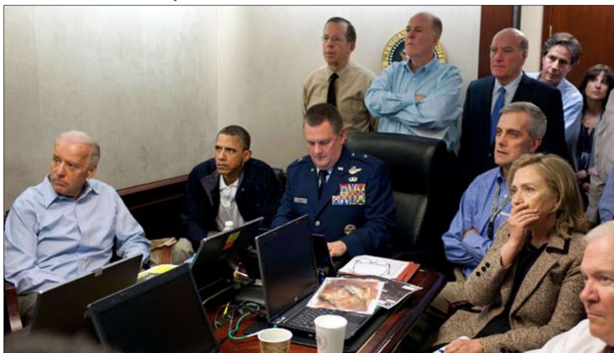
لحظة اغتيال بن لادن في باكستان