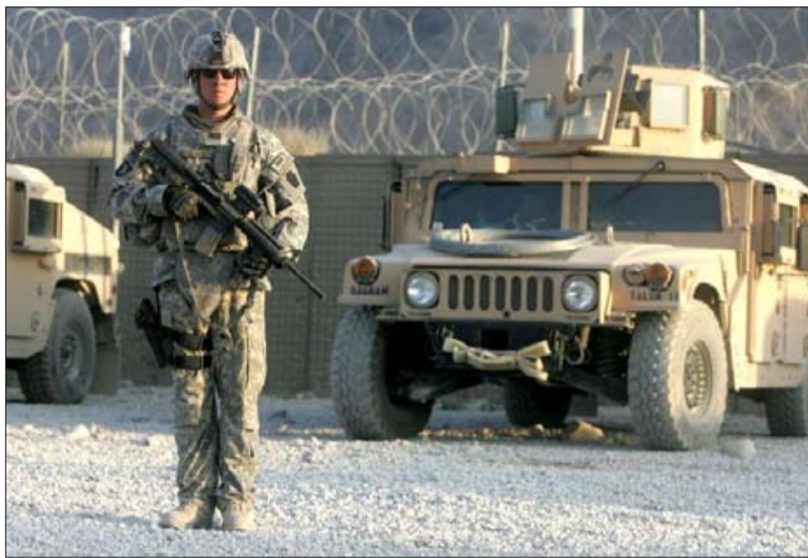
أطول الحروب الأمريكية

7، خلال القرار رقم 2513 من مجلس الأمن التابع للأمم المتحدة في 14 مايو، لكن لم يتم اتخاذ أي قرار في تلك المرحلة؛ لا تعترف طالبان بجمهورية أفغانستان الإسلامية، وترغب في أن ترى مكانها إمارة إسلامية. أما الحكومة الأفغانية، فهي لا