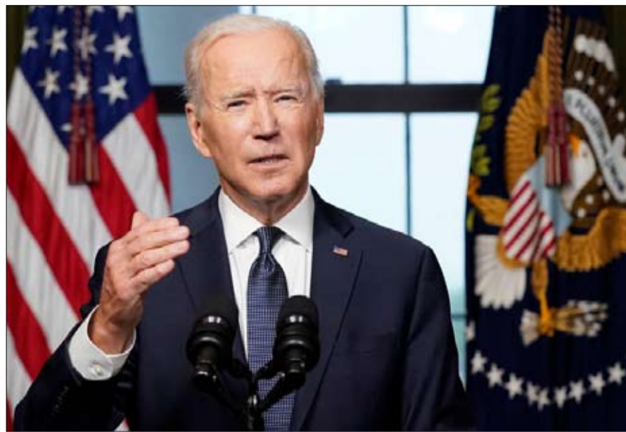
بايدن يؤكد انسحاب الأمريكيان من ارض الافغان

اعتمد التحالف بشكل كبير على محاورين محليين في البلاد، على حساب الغيار الوطني، مما زاد من تقليص دور الحكومة المركزية. وكان المتدخلون في عملية التنمية هم أول من تخطى الدولة وتجاوزها، وقد أصبح تنسيق برامج المساعدة أمراً صعباً من البداية بسبب العدد المتزايد لهؤلاء المتدخلين في هذا المجال. ولم يؤدي هذا إلا إلى زيادة المناهضة بينهم حتى أصبحت سياساتهم غير متسقة؛ وشهدنا، بالتالي، إهداراً سريعاً للموارد. وغذى تدفق الأموال الفساد بقدر ما غنّى الحسوبية، ناهيك عن بعض الاستثمارات التي لم يتم