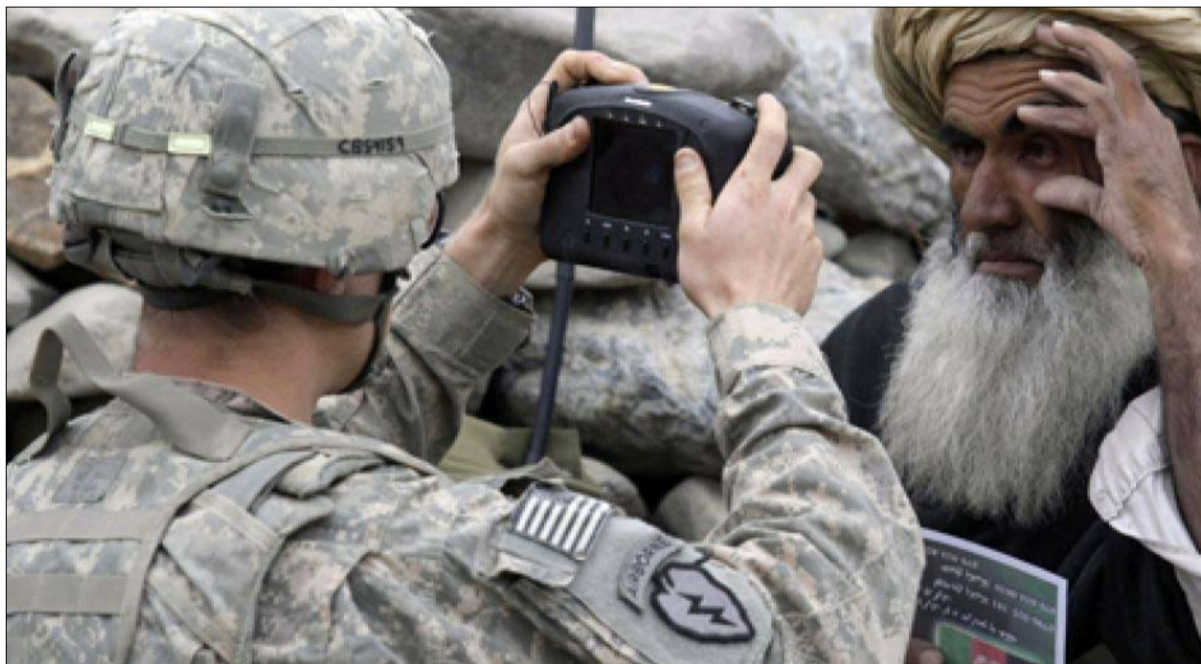
جهل بالواقع الافغاني

عززت السياسة الأمريكية عودة "أمراء الحرب"، التي سهلتها سقوط نظام طالبان، دعمتهم الولايات المتحدة لإعادة احتلال المنطقة، لكن المجتمع الأفغاني أصبح حضورياً بشكل متزايد