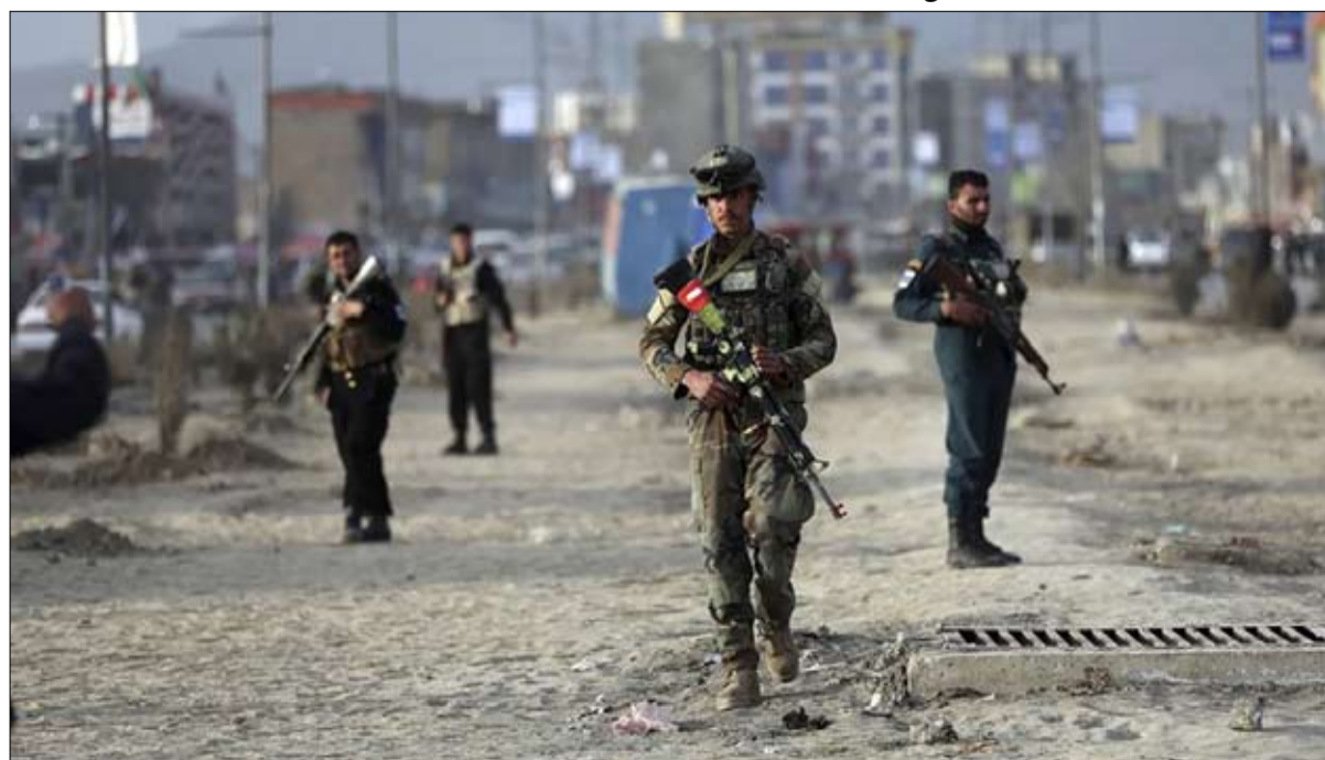
جنود افغان مطالبون بالصمود امام طالبان