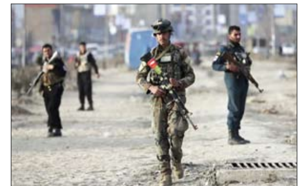
جنود افغان مطالبون بالصمود امام طالبان

قتل ثلاثة مدنيين وأصيب اثنان بجروح إثر قصف تركي على مخيم مخمور في شمال العراق، وفق ما أفاد النائب الكردي رشاد جلالى وكالة فرانس برس، يأتي بعدما هدد الرئيس التركي رجب طيب إردوغان قبل أيام بتنظيف هذا المخيم، وتقوم أنقرة مراراً بمعمليات قصف لشمال العراق للاحقة مقاتلين في حزب العمال الكردستاني المصنف إرهابياً من قبل تركيا والاتحاد الأوروبي وواشنطن. وقال النائب، إن طائرة تركية قامت بقصف حديقة للأطفال، في المخيم الذي يضم لاجئين أكراداً أتراكا.