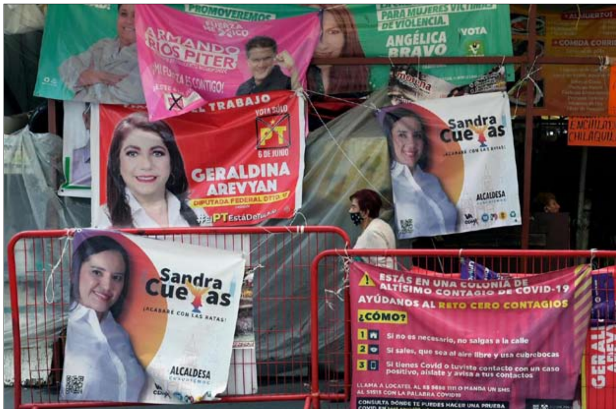
حملة انتخابية شرسة

العقاب في نخر نظامي القضاء والشرطة المكسيكيين، حيث يتم إغلاق ملفات أكثر من 90 بالائة من الجرائم المبلغ عنها. «املو»، الذي وعد عند انتخابه رئيساً للدولة في يونيو 2018، بمقاربة جديدة لإضعاف أباطرة المخدرات، أي مكافحة الفساد، لم يغير شيئاً، لكن يبدو أن المكسيكيين لا يقفون ضده. لا يزال تصنيف شعبية هذا الرئيس "الشعبي" و"الراديكالي"، الذي يمثل "خطراً على الديمقراطية"، وفق الإيكونوميست، تصل إلى أكثر من 60 بالائة، خاصة بين الأكثر فقراً. عن لو جورنال دي ديمانش