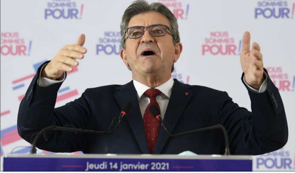
جان لوك ميلينشون

هذه الليبرالية من خلال معارضة عرض استحواذ شركة كوشي لتأجير الكندية على كارفو، أي للاستثمارات الأجنبية في قطاع التوزيع، باسم الدفاع عن السيادة الغذائية؛ إذن، سيد السيدون بعض الصعوبة في جعل السيادة العنصر المركزي للانقسام السياسي الذي يترجم تعارضهم مع كل من ماكرون ولويان، خاصة أن كل واحد منهم، يفسر إرث الجنرال بطريقته الخاصة، ويدعي أنه يحتفظ بقطعة من الديغولية الحقيقية. فمن يستطيع أن يقول كيف كان ديغول نفسه سيحفظ السيادة اليوم؟