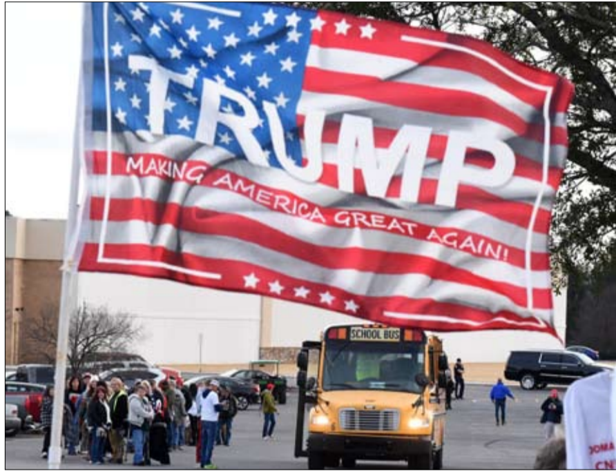
استقطاب وشرح يصعب جسره

وهذا ليس خطأ، فردود الفعل على الإعلان التجاري، يمينا ويساراً، تقول الكثير عن صعوبة تحقيق ذلك. يحق لغير المسيحيين والمحدثين التساؤل عن سبب دعوتهم للانضمام إلى وسط موجود في كنيسة مسيحية، لكن الرسالة مع ذلك تأخذ عناء الإشارة إلى أنها مفتوحة لجميع الذين يرغبون في التامل والصلاة هناك بأي طريقة يشاؤون وبما يرونه مناسباً.