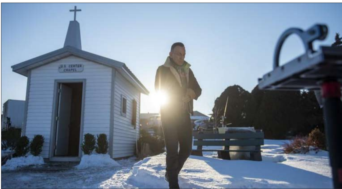
لماذا الكنيسة يتساءل اليسار

على اليمين كما اليسار، في المدن كما في الأرياف، لا يخفي الأمريكيون رغبتهم في العثور على قواسم مشتركة