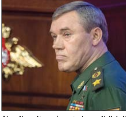
الجنرال الروسي غيراسيموف سيد الحرب الهجينة

في تقرير بعنوان إعادة التفكير في الدفاع لمواجهة أزمات القرن الحادي والعشرين، نشر في 9 فبراير، أعرب معهد مونتبن عن قلقه إزاء عدم استعداد فرنسا للتحديات الهجينة، حتى لو كانت، حسب هؤلاء الخبراء، تتمتع بمزايا كبيرة للتعامل معها. (التفاصيل ص 10)