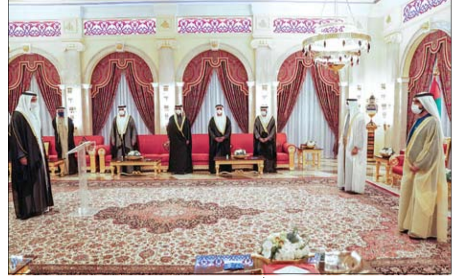
محمد بن راشد ومحمد بن زايد يشهدان أداء اليمين الدستورية لشخبوط بن نهيان وزير دولة

بالتأييد عن رئيس الدولة منحا أنور قرقاش وزكي نسيبة وسام الاتحاد