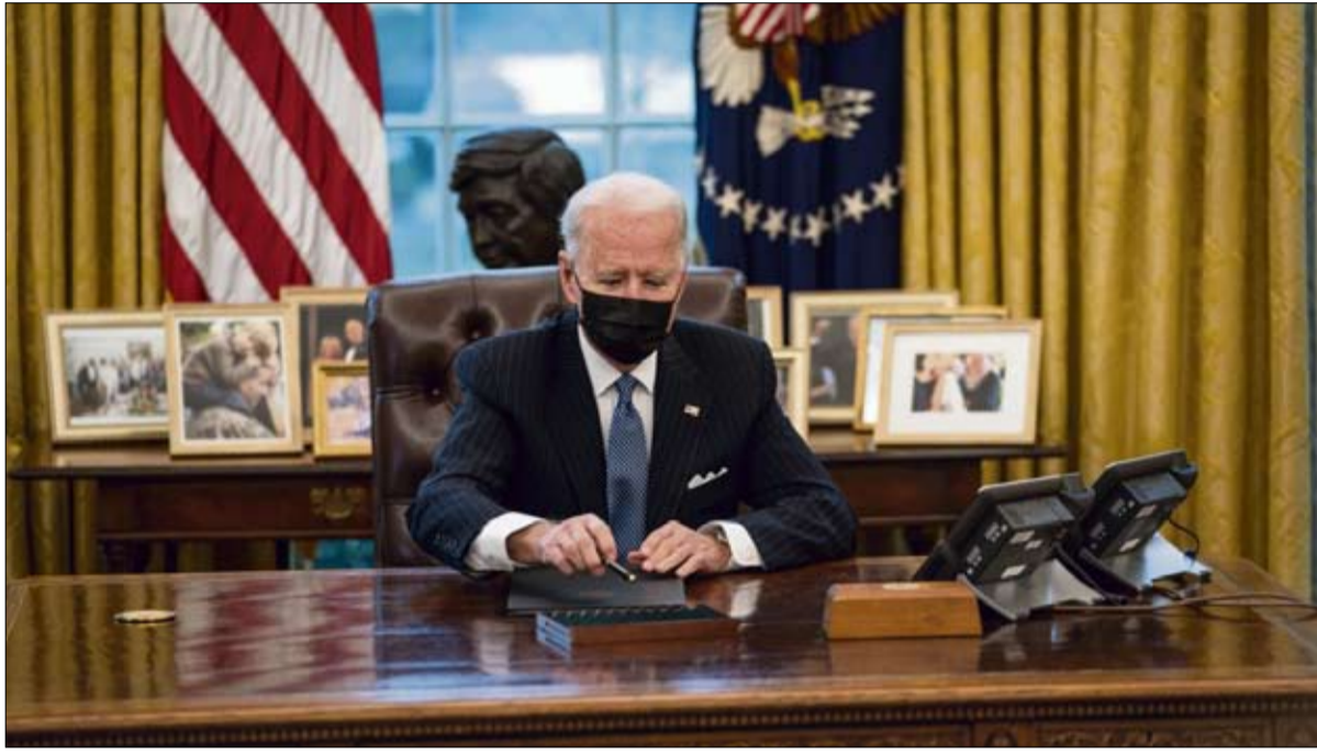
جو بايدن اسفتمته وسطيته

تقد أراد مطرب الروك المعجوز من نيو جيرسي والشركة المصنعة لركبته الصالحة لجميع التضاريس - وهما رمزاً للثقافة الشعبية الأمريكية - أثر فيهما مرور الزمن - تقاسم رسالة رائعة للغاية، لكن ليس غداً سيتكس الأمريكيان من جميع الاقلاق في كنيسة كنساس الصغيرة هذه بروح المصالحة التي يطالبون بها. x أستاذ العلوم السياسية / مركز الدراسات والبحوث الدولية في جامعة مونريال لتنمية المعرفة حول الرهانات الدولية