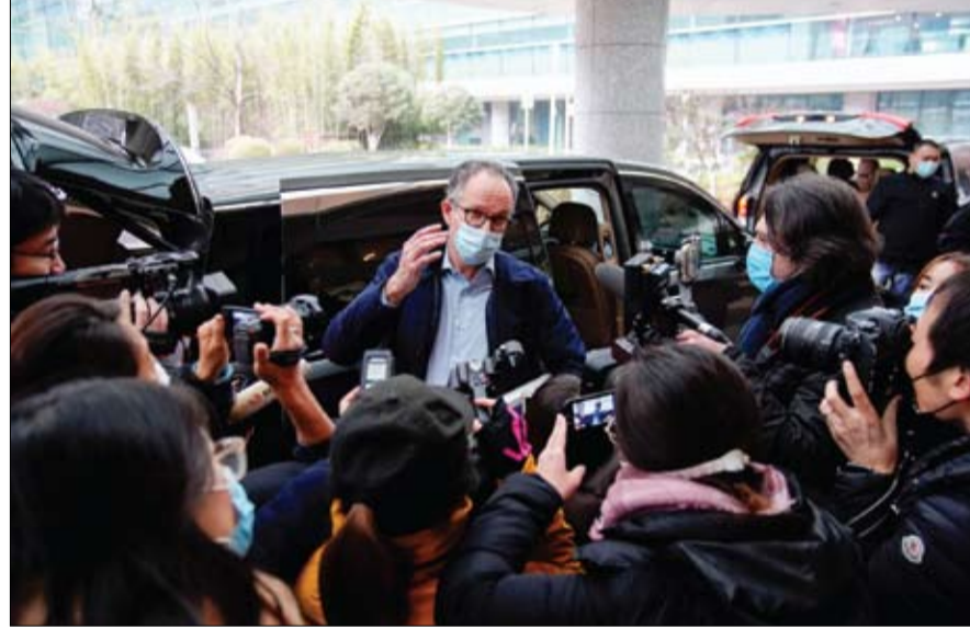
بيتر دازاك عضو منظمة الصحة العالمية يتحدث لوسائل الإعلام لدى وصوله إلى المطار، في ووهان.

شكك خبير من بعثة منظمة الصحة العالمية إلى ووهان الصينية، لكشف منشأ فيروس كورونا، في صحة المعلومات الأمريكية عن الوباء، بعد تعليقات من الخارجية الأمريكية. وقال بيتر دازاك عضو البعثة على تويتر: لا تشكوا كثيراً في المعلومات الأمريكية، في إشارة إلى تصريحات متحدث باسم الخارجية، تجنب فيها تبني الاستنتاجات الأولية لخبراء منظمة الصحة العالمية، بعد جولتهم في ووهان. وأظهرت بيانات مجمعة اقتراب إجمالي الإصابات بفيروس كورونا في أنحاء العالم من 107 ملايين، حتى صباح الأربعاء، وأظهرت أحدث البيانات على موقع جامعة جونز هوبكنز الأمريكية، أن إجمالي الإصابات بلغ 106.903 ملايين، في حين تجاوز عدد المتعافين 59.7