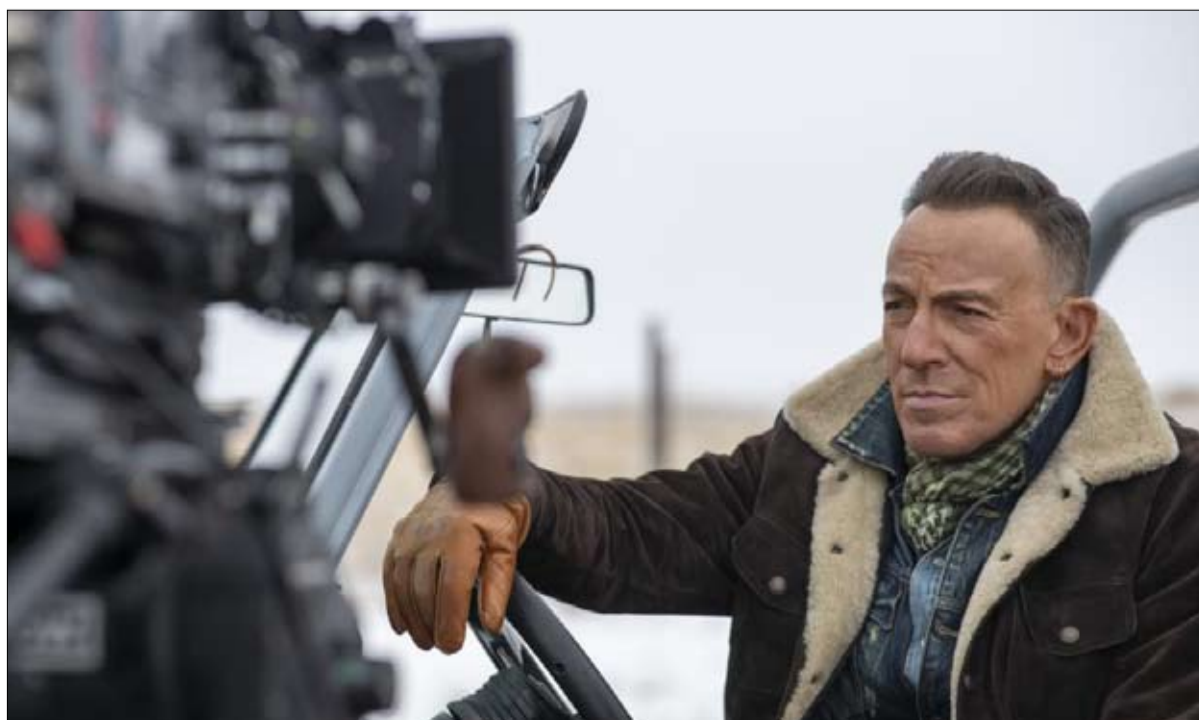
رسالة سياسية في إعلان