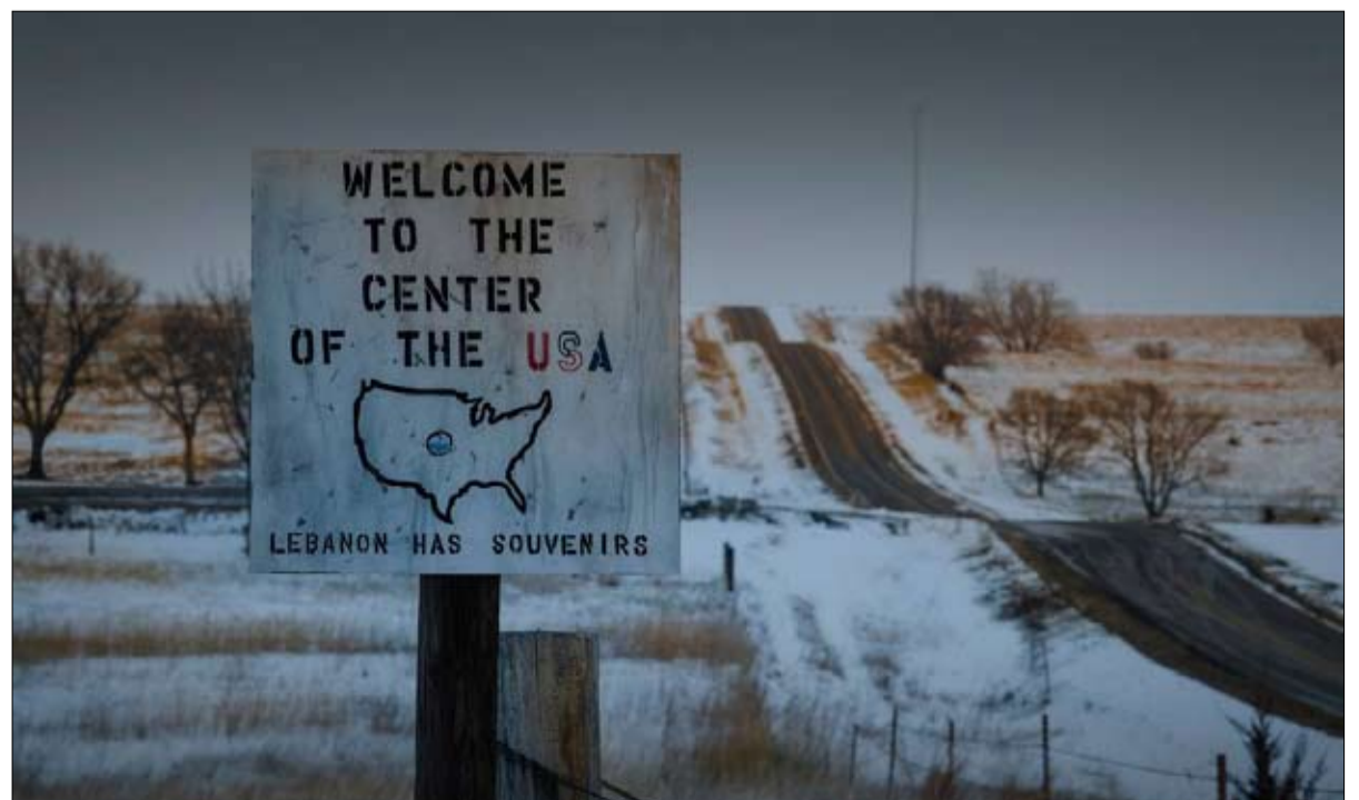
هذا الوسط الجغرافي والثقافي البعيد النماز

ويجب أيضاً أن تكون عديم الاحساس بشكل ملحوظ حتى لا تعترك قشعريرة وانت ترى عازف الروك الحزين هذا، المولود في الولايات المتحدة، وهو يمشي بقبعة رعاة البقر في سيارته الطبيعية ذات أفق لامتناهي تحيط بتلك الكنيسة الصغيرة الواقعة في وسط اللامكان في كانساس، بالضبط في الوسط الجغرافي لما يسمى في الولايات المتحدة بـ «48 السفلى».