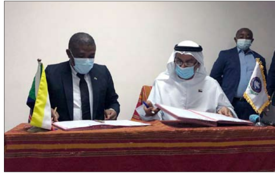
وأهدافه السامية التي من شأنها تعزيز الأمن والاستقرار والسلام في أفريقيا والعالم ككل. والتعليمية والإعلامية. وأكد ذوالكمال دعم بلاده المستمر للمجلس العالي للتسامح والسلام من خلال المنظومة البرلمانية

وقع المجلس العالي للتسامح والسلام اتفاقية مع وزارة الشؤون الخارجية والتعاون الدولي في جمهورية جزر القمر لفتح المكتب الإقليمي للمجلس في جزر القمر الاتحاد القمري وذلك بالعاظمة موروني. ووقع الاتفاقية من جانب المجلس معالي أحمد بن محمد الجروان رئيس المجلس .. فيما وقعها من جانب جمهورية جزر القمر معالي السيد ظاهر ذوالكمال وزير الشؤون الخارجية والتعاون الدولي. تأتي الاتفاقية في إطار تعزيز العلاقات والتعاون الثنائي بين المجلس العالي للتسامح والسلام وجزر القمر بهدف نشر وإعلاء قيم التسامح والسلام