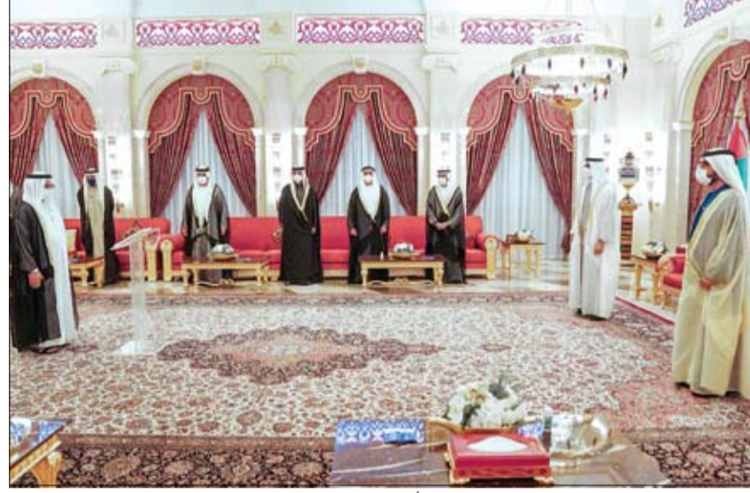
محمد بن راشد ومحمد بن زايد يشهدان أداء اليمين الدستورية لخليفة المرر وزير دولة (وام)

أعاد صاحب السمو الشيخ محمد بن زايد آل نهيان ولي عهد أبوظبي نائب القائد الأعلى للقوات المسلحة تسمية أكاديمية الإمارات الدبلوماسية إلى أكاديمية أنور قرقاش الدبلوماسية. تكريماً لجهود معالي الدكتور أنور بن محمد قرقاش، المستشار الدبلوماسي لصاحب السمو رئيس الدولة في خدمة قضايا الدولة وتعزيز حضورها الإقليمي والدولي. وتأتي مبادرة سموه تسمية أكاديمية أنور قرقاش الدبلوماسية.. تقديراً لدور معالي الدكتور قرقاش وعطاءاته المخلصة خلال السنوات الماضية في العمل الأكاديمي والسياسي وكونه أحد رواد العمل الدبلوماسي في الدولة.