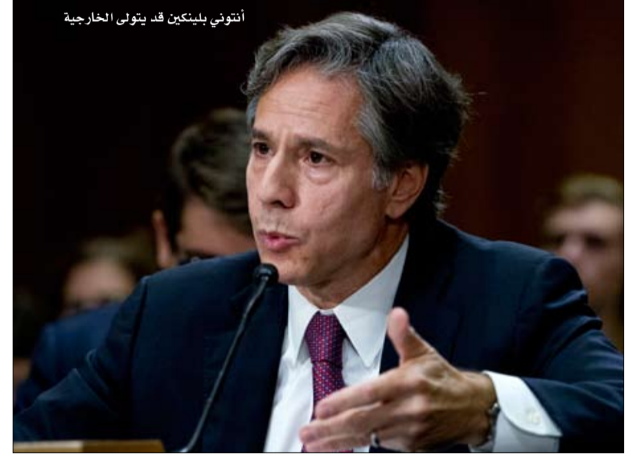
أنتوني بلينكين قد يتولى الخارجية

•• الفجر -خيرة الشيباني تيد كوفمان، كأنه الشقيق التوام لجو بايدن، رغم أنه يكبره بثلاث سنوات. ولد في ولاية بنسلفانيا، مثله، وهو نتاج خالص للطبقة الوسطى، انضم المهندس من حيث التكوين هذا إلى الشاب الديمقراطي عندما قرر أن يصبح عضواً في مجلس الشيوخ عام 1972؛ إنهما لا يتفصلان، وانتهى الأمر بكوفمان إلى دخول مجلس الشيوخ عام 2009 ليحل محل جو بايدن، الذي أصبح نائب رئيس باراك أوباما. واليوم، ها هو خادم لا يعرف الكلل، على رأس الفريق الانتخابي الذي يستعد لتولي بطله السلطة.