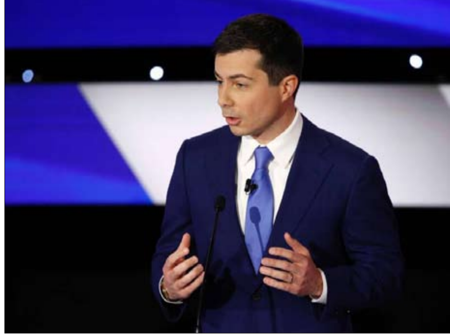
بيت بوتيجيج السفير الأمريكي لدى الأمم المتحدة

لإثبات قدرته على الحوار مع اليمين، يخطط جو بايدن لإسناد حقيبة أو أكثر للجمهوريين