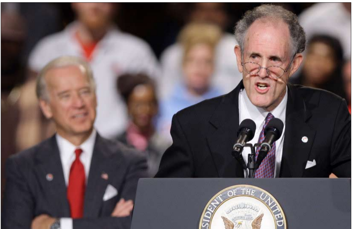
تيد كوفمان قائد أوكسترا المرحلة الانتخابية