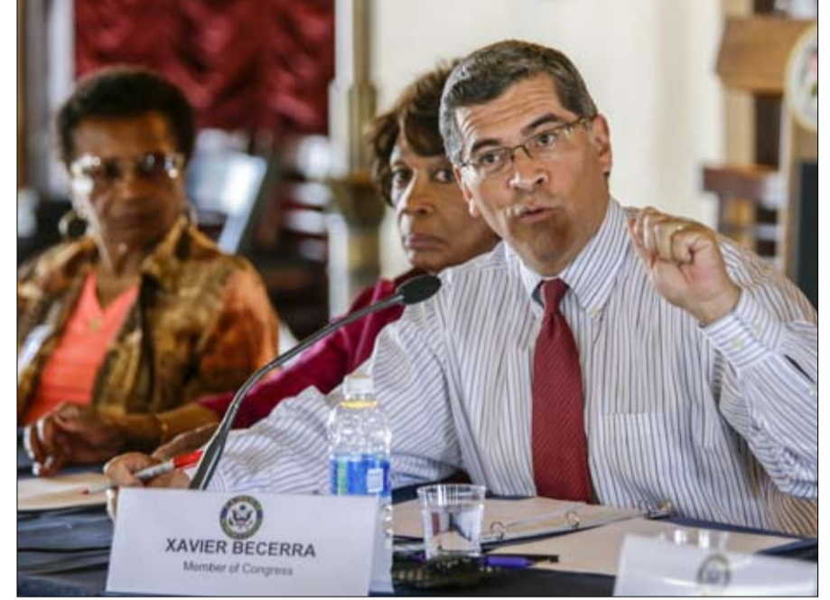
كزافييه بيسيرا مرشح لوزارة العدل أو الأمن الداخلي

في ظل هذه الظروف، ستعتمد التعيينات المستقبلية بشكل كبير على تطور الوضع السياسي