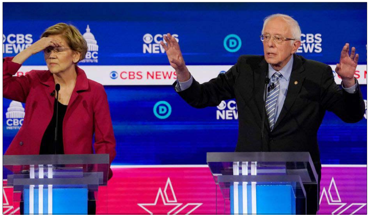
ساندرز ووارن... لا مكان لليسار على ما يبدو