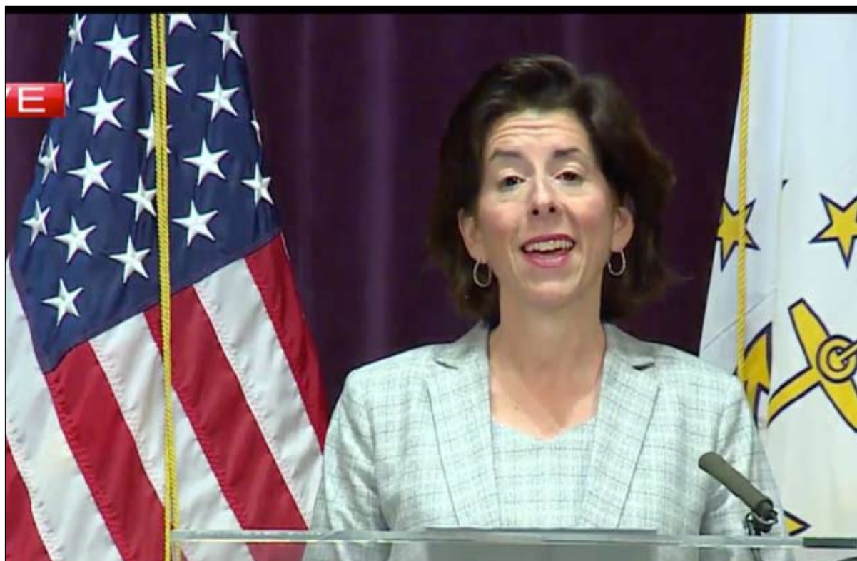
جينا ريموندو لاعناش الاقتصاد