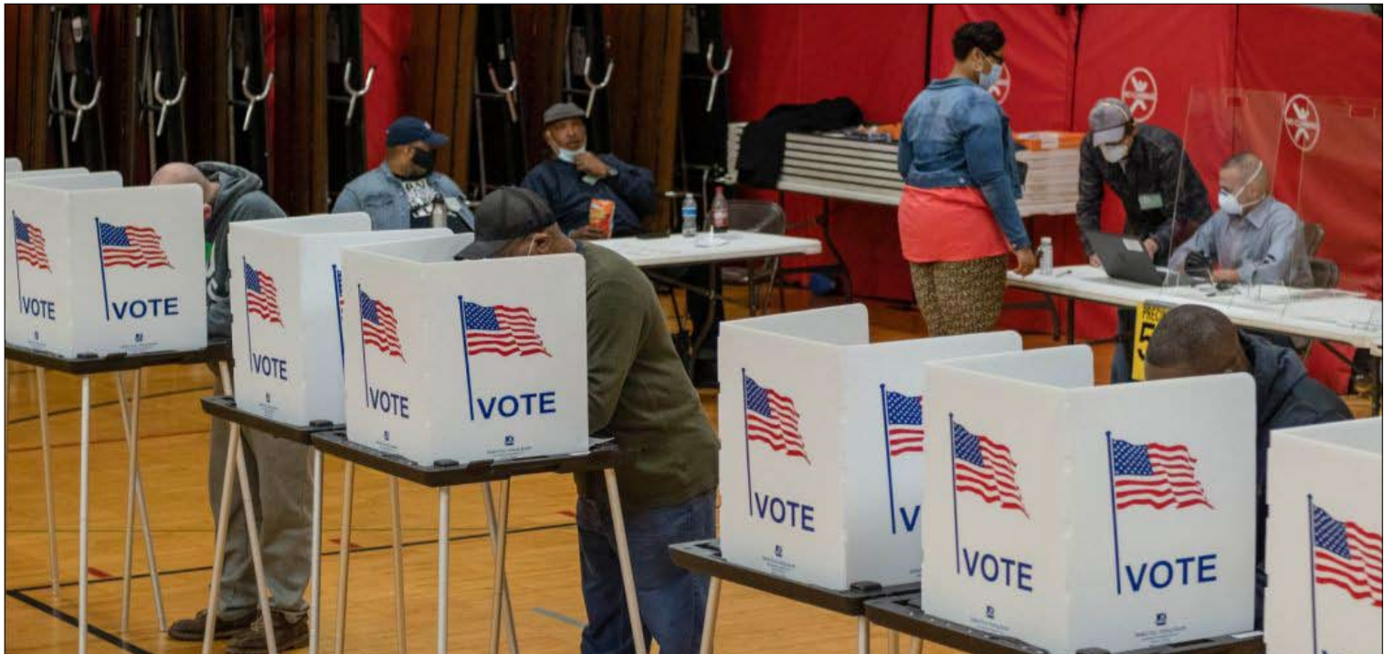
قالت الصناديق كلمتها ولكن...