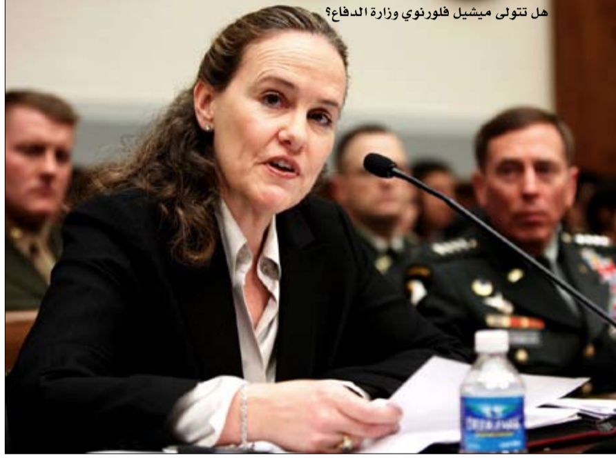
هل تتولى ميشيل فلورنوي وزارة الدفاع؟

•• الفجر -خيرة الشيباني تيد كوفمان، كأنه الشقيق التوام لجو بايدن، رغم أنه يكبره بثلاث سنوات. ولد في ولاية بنسلفانيا، مثله، وهو نتاج خالص للطبقة الوسطى، انضم المهندس من حيث التكوين هذا إلى الشاب الديمقراطي عندما قرر أن يصبح عضواً في مجلس الشيوخ عام 1972؛ إنهما لا يتفصلان، وانتهى الأمر بكوفمان إلى دخول مجلس الشيوخ عام 2009 ليحل محل جو بايدن، الذي أصبح نائب رئيس باراك أوباما. واليوم، ها هو خادم لا يعرف الكلل، على رأس الفريق الانتخابي الذي يستعد لتولي بطله السلطة.