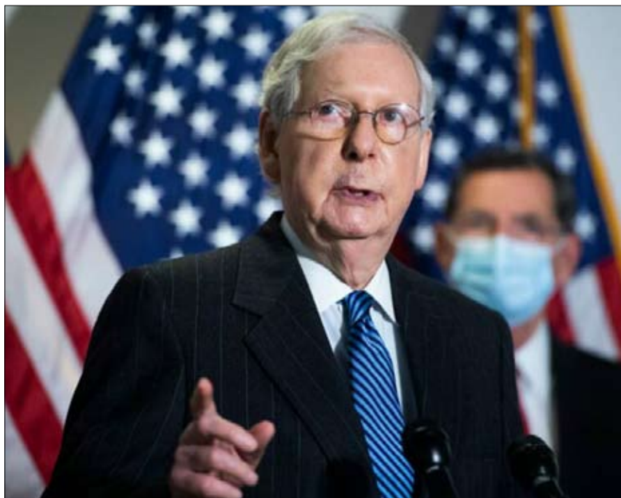
شوكة ميتش ماكونيل زعيم الجمهوريين