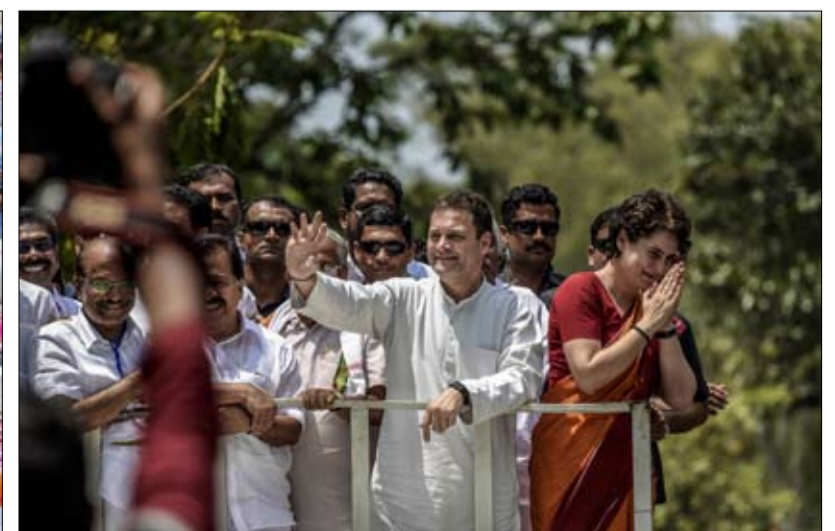
راهور وشقيقته استعادة مجد أسرة وحزب