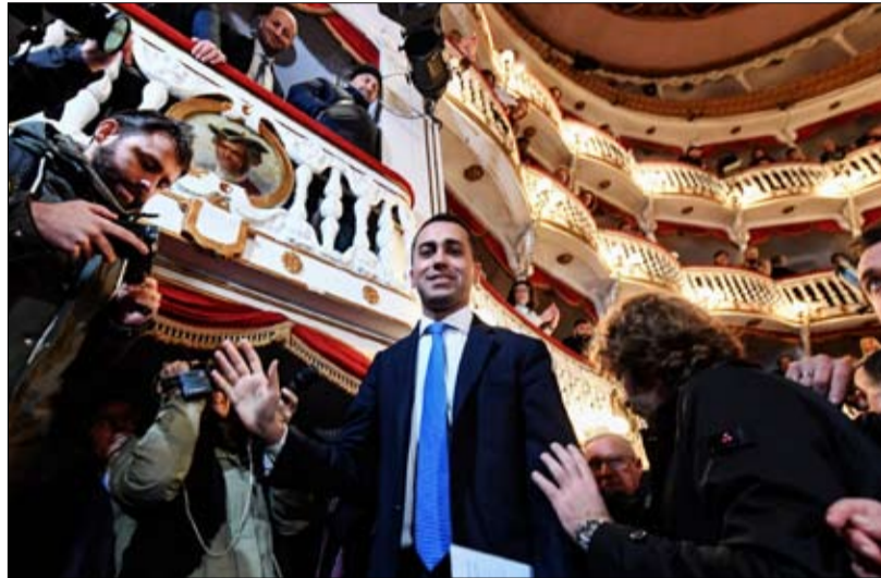
لويجي دي مايو حركة 5 نجوم في صعود

لم تصل درجة العقوبة بعد، ولكنها تحذير؛ فقد خسرت رابطة ماتيو سالفيني 6 نقاط في