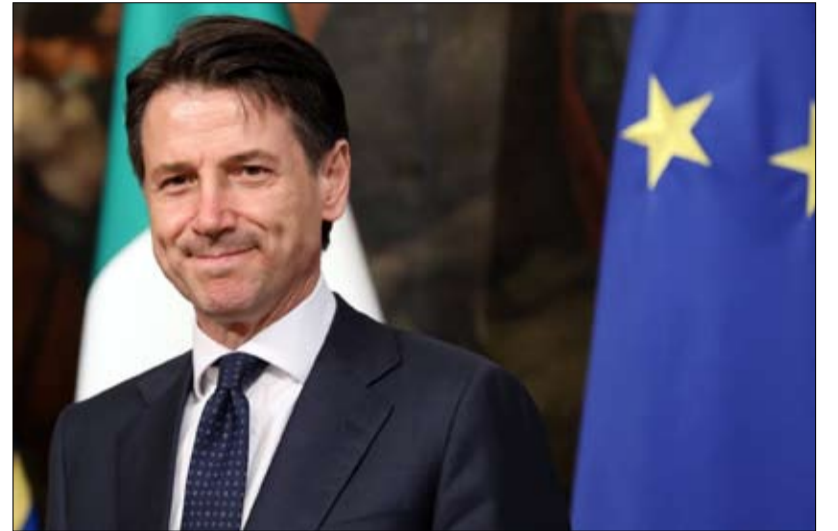
تغيير رئيس الوزراء مسألة شائكة

لقد بنى سالفيني شعبيته على إدارة صارمة لأزمة الهجرة، ولم تعد هذه الأخيرة تشكل اليوم رافعة انتخابية قوية. ولا يمكن للجمود في الملفات الاقتصادية، ومخاطر الركود الذي يحوم فوق إيطاليا، إلا أن يُثير قلق "قاعدته" الانتخابية المولفة من الشركات الصغرى والمتوسطة، فقط.