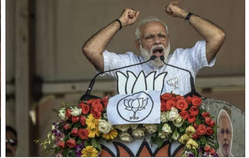
مودي تركيز على الهوية وغياب البرنامج