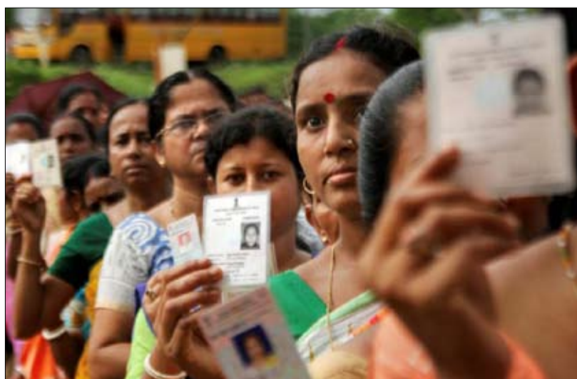
انتخابات تاريخية وحاسمة