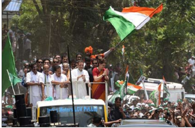
في كيرالا يبريد راهول بناء جسر بين الشمال والجنوب