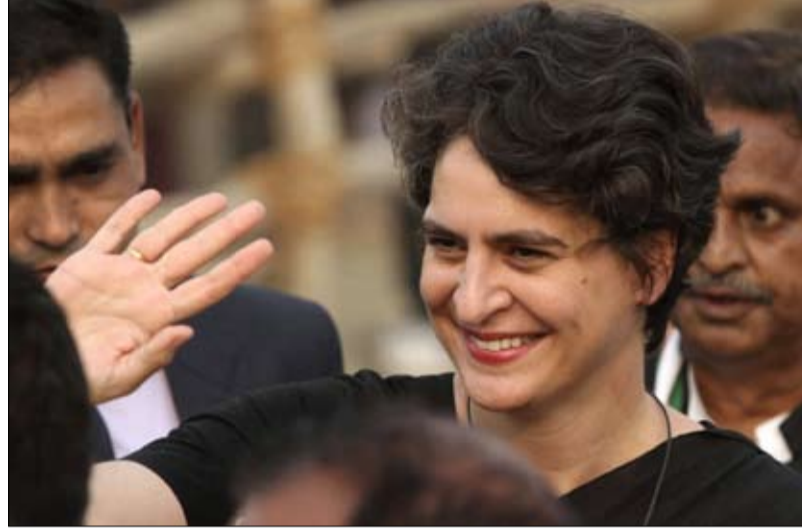
بريانكا غاندي في نصره شقيقها والمؤتمر