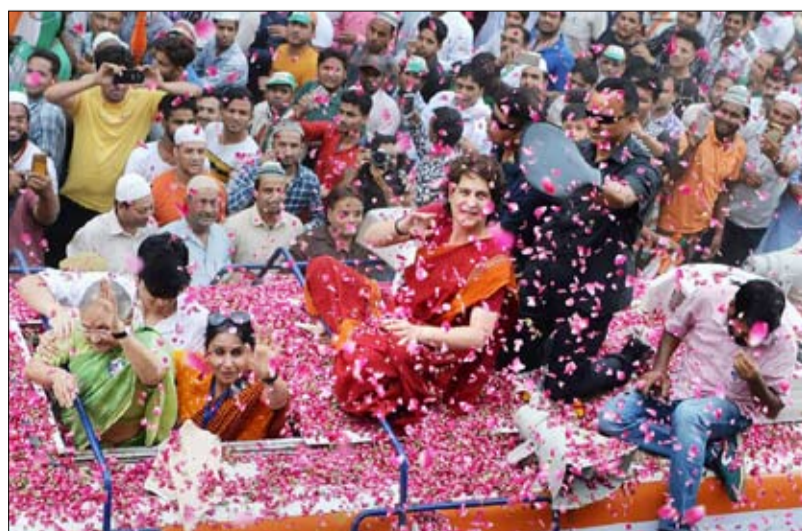
كاريزما وحضور جماهيري لافت