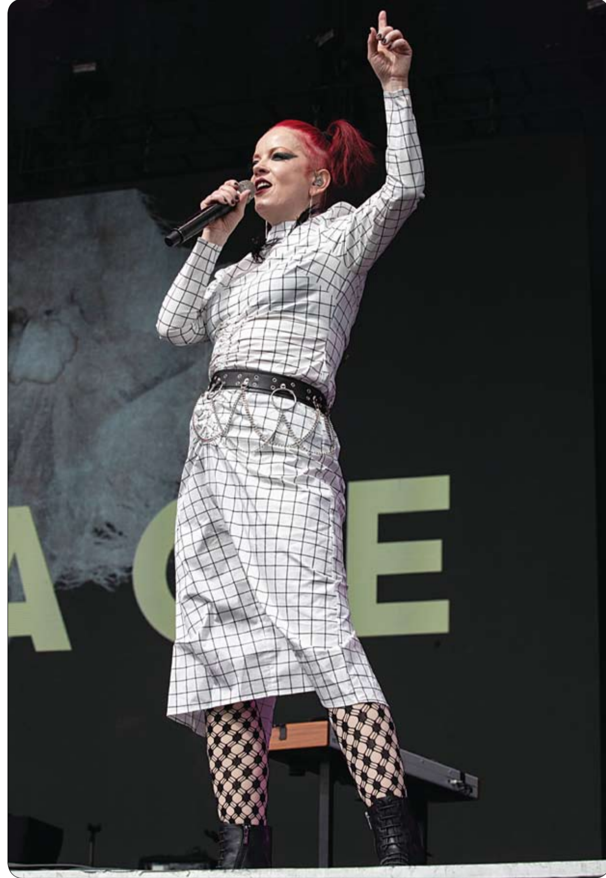
المغنية الاسكتلندية شيرلي مانسون تشدو خلال مهرجان تكساس الموسيقي بالولايات المتحدة.

واستغرام، بحسب موقع إن دي تي. في. وكتبت إحدى التعليقات إنه أمر مدهل، لقد رأيت الحذاء باللونين الأخضر والرمادي، في حين شاهده زوجي باللونين الأزرق والأبيض، وعلق آخر رأيت اللونين الرمادي والأخضر في البداية، ثم نظرت من خلال نظراتي فشاهدته باللونين الأزرق والأبيض. وحاولت الصفحة التي نشرت الصورة تفسير هذه الظاهرة، بالقول إن الأشخاص الذين شاهدوا الحذاء باللونين الأزرق والأبيض لديهم الجانب الأزرق من الدماغ مهيم على عملية الرؤية، في حين يهيمن الجانب الأزرق لدى الأشخاص الذين شاهدوا بالأخضر والرمادي، إلا أن العديد من مستخدمي تويتر لم يقتنعوا بهذا التفسير.