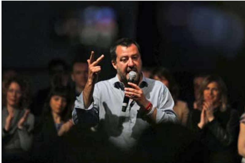
سالفيني تراجع الرابطة