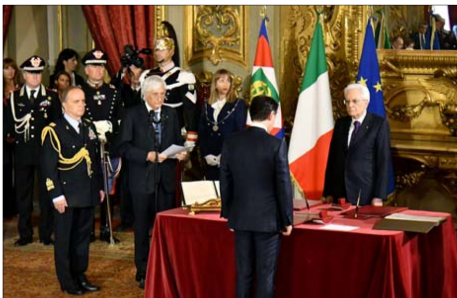
هل تتجه إيطاليا إلى أزمة سياسية وانتخابات مبكرة

الفضاء الإعلامي. فتقزيم احتفالات الانتصار على النازية والفاشية عام 1945، وخطابه من الشرفة التي كان تحدث منها موسوليني خلال زيارة إلى فوري، وكتاب حواري