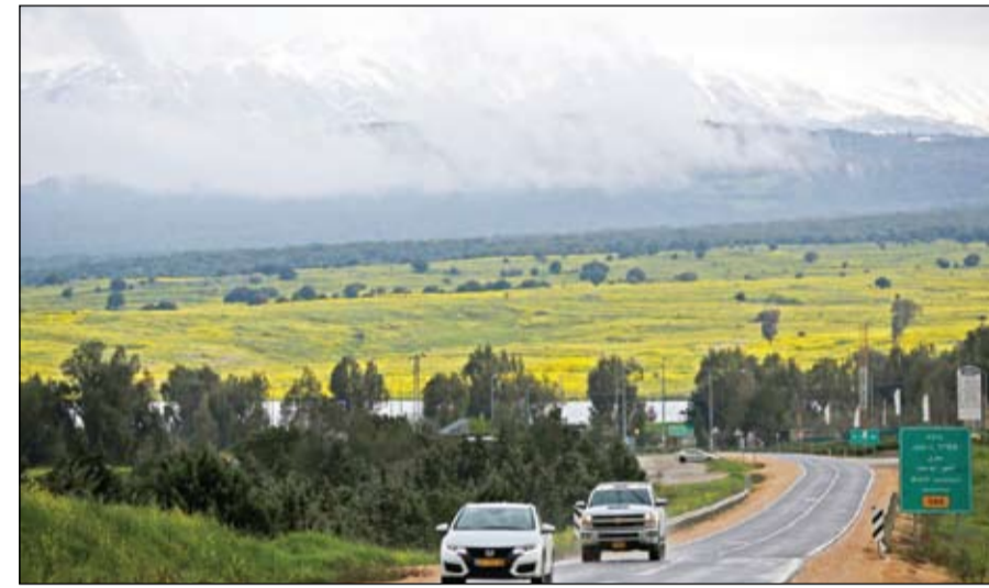
صورة أرشيفية لمرقعات الجولان السورية المحتلة

أوضح نتانيا هو أنه سيطلب رئيس إسرائيل رؤوفين ريفلين بمد المهمة التي منحها إياه لذلك عقب فوزه في الانتخابات العامة التي أجريت في أبريل (نيسان) الماضي، وذلك بسبب الأعياد والعطلات التي تعاقبت خلال