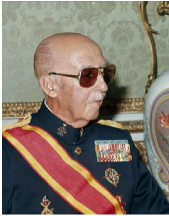
فرانكو اقام علاقات واقعية مع كاسترو

•• الفجر -جان جاك كورلياندسكي -ترجمة خيرة الشيباني تمنح الصحافة الإسبانية مساحة، مبدئياً، مفاجئة في ظرف تحكمه أزمة الوباء والكوارث البيئية المختلفة،