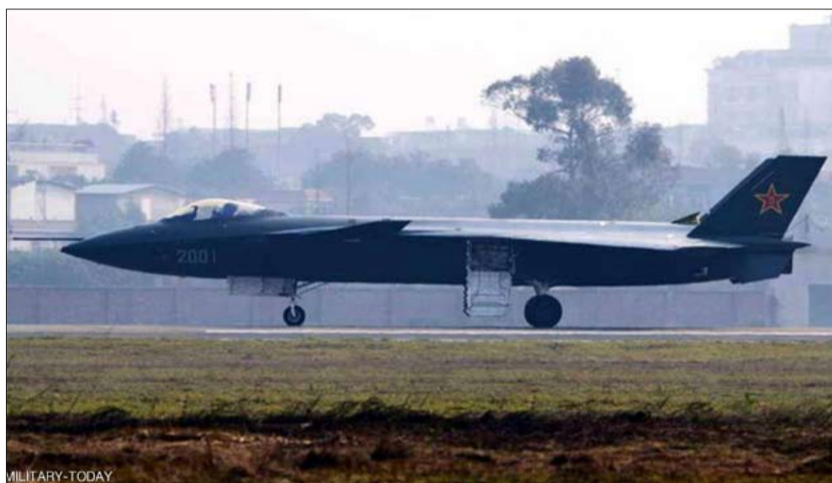
الطائرة الصينية المقاتلة جاي 20

وتجدر الإشارة هنا، إلى الترسانة النووية المتاحة للولايات المتحدة والصين. هنا أيضاً، لا شيء للمقارنة لأن للولايات المتحدة 5800 رأساً نووياً، منها 1400 في حالة تأهب دائم وجاهزة للإطلاق في أي وقت، مقارنة بـ 250 إلى 350 رأساً حربياً على