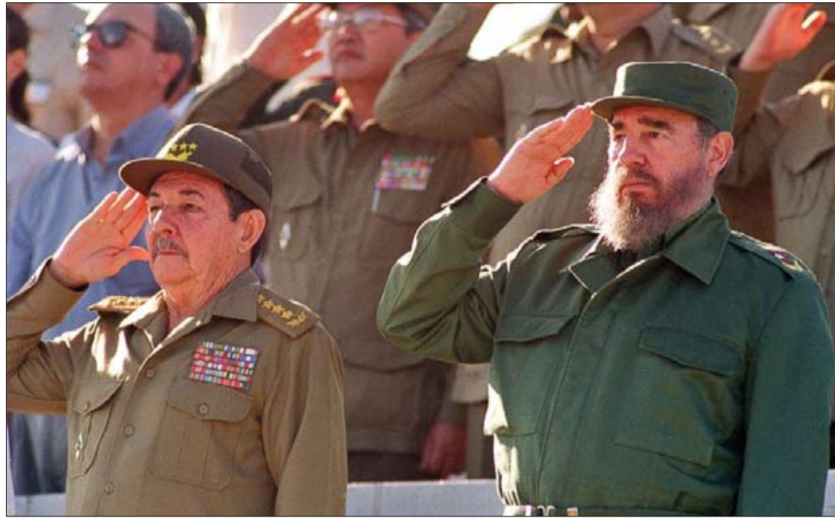
فيدل وراؤول من أصل إسباني