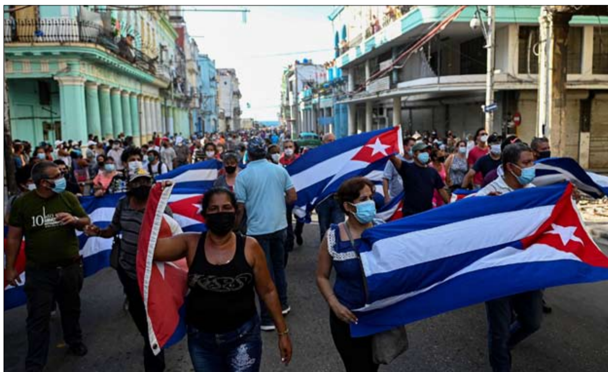
الانتفاضة في كوبا تشغل الاسبان