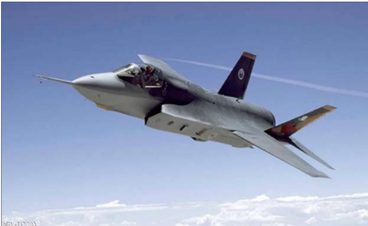
لوكهيد مارتن اف 35

- أنظمة الأسلحة الصينية "متأخرة عدة سنوات" عن نظيرتها في الولايات المتحدة