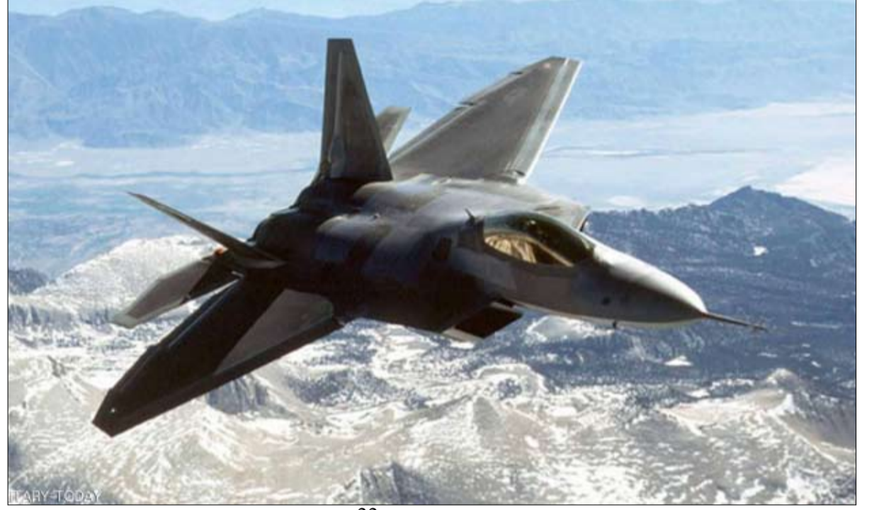
الأمريكية رابتور اف-22