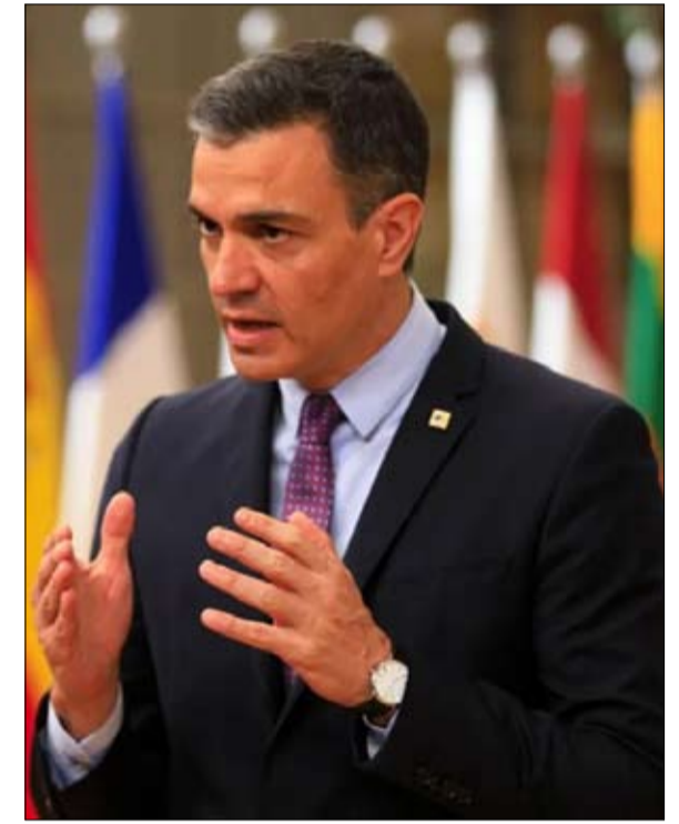
اليمين الإسباني يهاجم حكومة سانثيز بخصوص كوبا

اليمن، مشيطنا اليسار، المشتبه في رضاه عن الشيوعية. وهكذا، وفقاً للتناوب الانتخابي، تستعيد إسبانيا مع اليسار دبلوماسية الدولة مع هافانا، بينما أعاد الحزب الشعبي وفوكس اليوم، تنشيط المرسل المعادي لكوبا الذي اخترعه خوسيه مارييا أثنار في عام 1996 لإدانة الاشتراكيين والتقدميين من جميع الأقطاب.