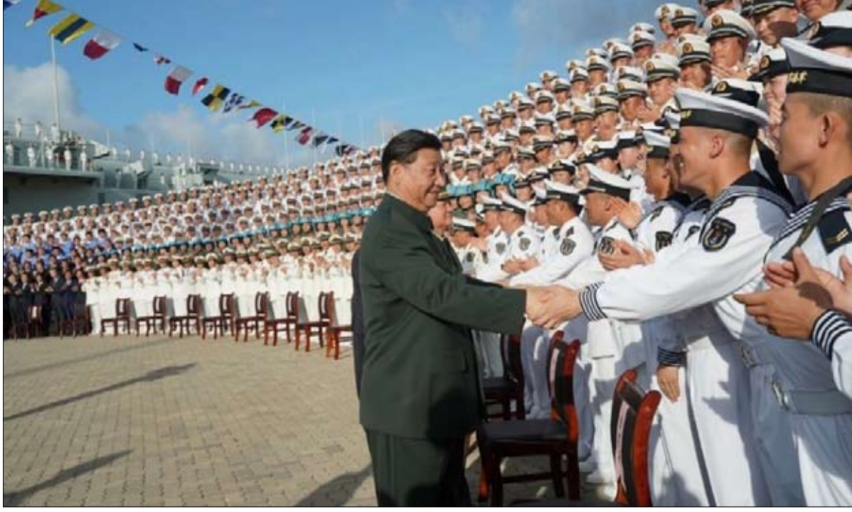
الجيش الصيني أكبر عددا ولكنه متخلف تسليحا