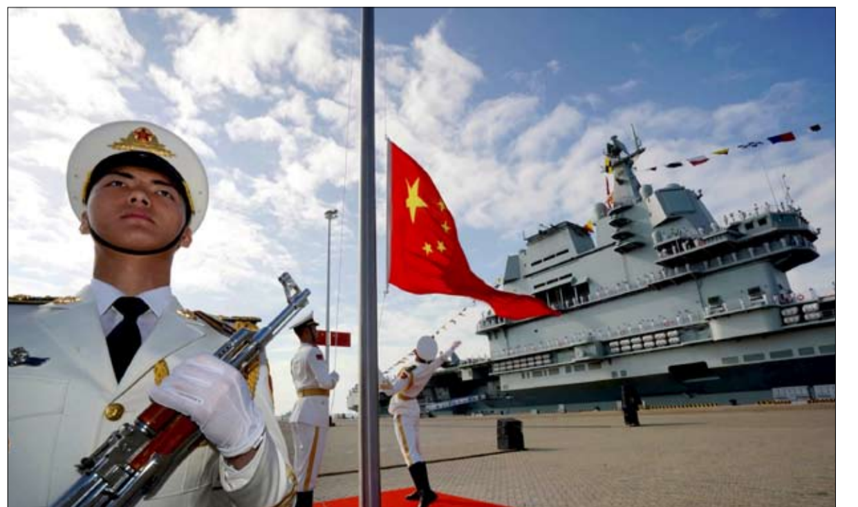
رفع العلم على حاملة الطائرات الصينية شاندونغ