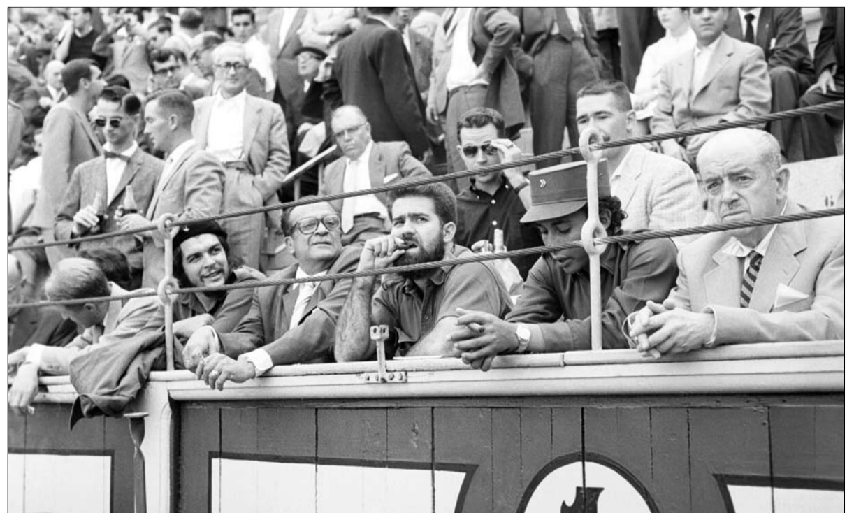
جيفارا في مدريد