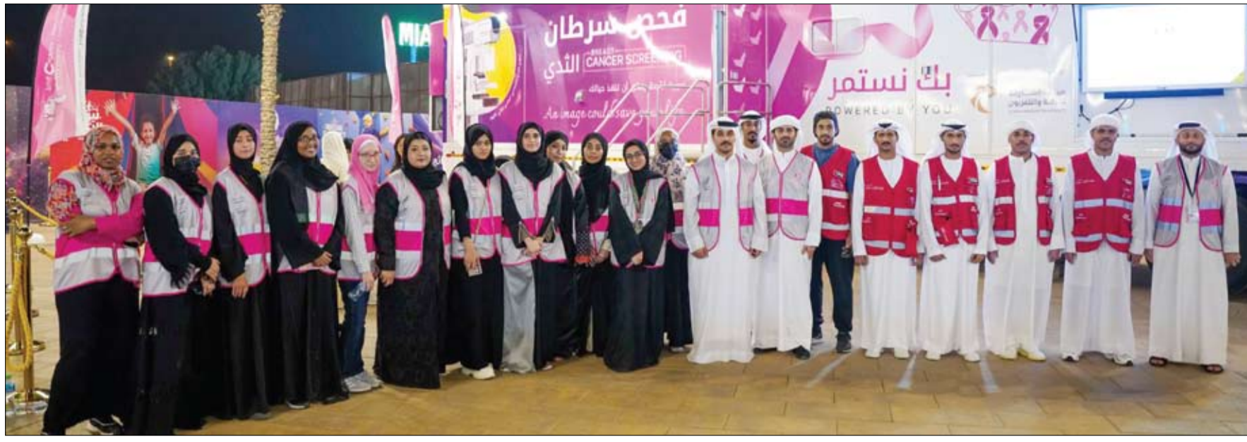
ضمن المبادرات التابعة لـ «جمعية أصدقاء مرضى السرطان» لمكافحة سرطان الثدي