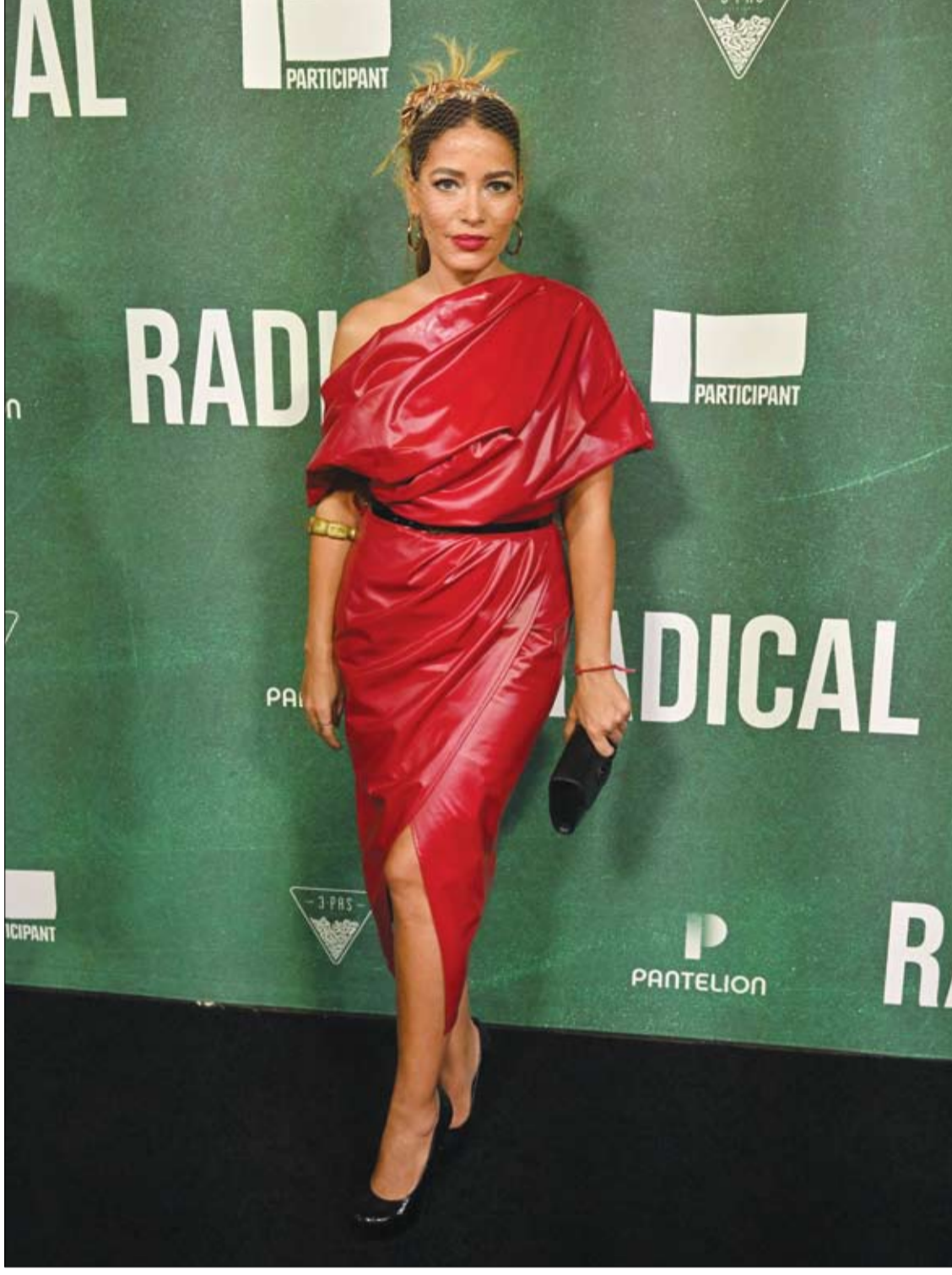
الممثلة المكسيكية أدريانا فونيسكا لدى حضورها العرض الأول لفيلم Radical في لوس أنجلوس.

اتضح لفريق من علماء جامعة سنغافورة الوطنية أن الاستهلاك اليومي للعنب يمكن أن يحسن الرؤية لدى كبار السن. وتشير مجلة Food & Function إلى أن هذه التجربة العشوائية التي أجراها الفريق العلمي شملت 34 متطوعا طلب منهم تناول 1.5 كوب من العنب يوميا لمدة 16 أسبوعا، وكان أفراد المجموعة الضابطة يتناولون دواء وهميا. وقد اكتشف الباحثون بعد انتهاء التجربة أن الكثافة البصرية للصبغ البقعي (MPOD) لدى المشاركين الذين تناولوا العنب قد تحسنت بشكل ملحوظ. وبالإضافة إلى ذلك، ارتفع مستوى مضادات الأكسدة والفيتولات في البلازما. وتتوافق هذه النتائج مع نتائج الدراسات السابقة التي أظهرت أن تناول العنب يحمي بنية شبكية العين ووظيفتها. وتجدر الإشارة، إلى أن العنب يحتوي على كميات كبيرة من مضادات الأكسدة الطبيعية والبوليفينول، التي يمكنها أن تقلل من الإجهاد التأكسدي الناتج عن الشيخوخة.