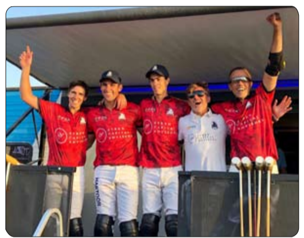
مجموعته صعوبات وان تفاوتت طريقه معبدا الى حد كبير بينما تعرض فريق الحبثور الى حرج بالغ بينهما اذا ان فريق الإمارات كان

في مباراته مع فريق مهرة ومجموعة اياكس للاستثمار وفريق بنجاش .