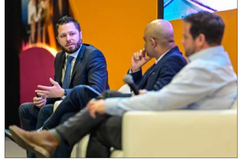
تخزين الطاقة يشكل الحل الأمثل لإنشاء منظومة طاقة مكتفية ذاتياً