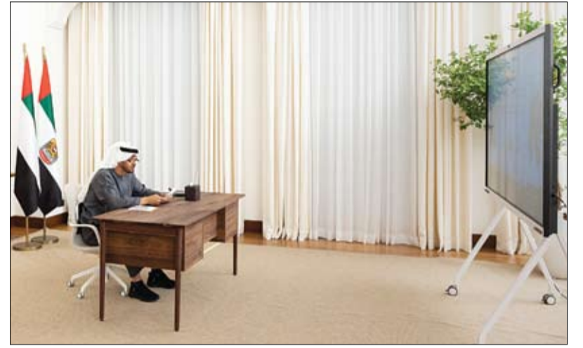
خلال قمة عبر الاتصال المرئي