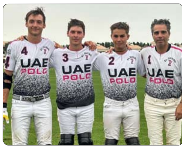
ويمثل فريق الإمارات اليوم سمو الشيخة ميثاء بنت محمد بن راشد

بنتلي وفي الثالثة والثلاث تبدأ عدة عروض حركية لطلاب المدارس ثم عروض للزلاء ثم تقدم فرقة كل من محمد الحبثور وماثير بيري وجيان جوريتش وباوتيسا بايوجار . ولا يتوقف مهرجان اليوم عند حد مباراة الختام بين فريق الإمارات ونظيره الحبثور ايضاً بل ان المهرجان يبدأ من العاشرة صباحاً حيث يبدأ توافد الجمهور ثم الغداء الذهبي في الثانية عشرة ظهراً وفي الواحدة والرابع تقدم فرسية شرطة دبي عروضاً في الرشاقة والدقة وفي الحضور لعرض الإضاءة الليلية ثم الختام في الثامنة مساءً.