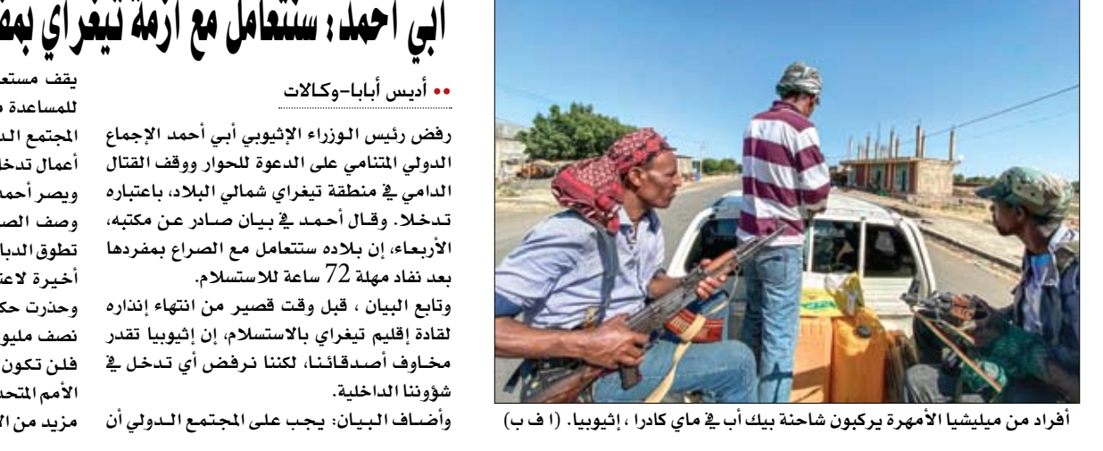
أفراد من ميليشيا الأمهرة يركبون شاحنة بيك أب في ماي كادرا، إثيوبيا.

أبي أحمد: ستعامل مع أزمة تيغراي بمفردنا ومن دون تدخلات أنيس أبابا-وكالات: رفض رئيس الوزراء الإثيوبي أبي أحمد الإجماع الدولي المتنامي على الدعوة للحوار ووقف القتال الدامي في منطقة تيغراي شمالي البلاد، باعتباره تدخلا. وقال أحمد في بيان صادر عن مكتبه، الأربعاء، إن بلاده ستعامل مع الصراع بمفردها بعد نفاذ مهلة 72 ساعة للاستسلام. وتابع البيان، قبل وقت قصير من انتهاء إنذاره لقادة إقليم تيغراي بالاستسلام، إن إثيوبيا تقدر مخاوف أصدقائنا، لكنها ترفض أي تدخل في شؤوننا الداخلية. وأضاف البيان: يجب على المجتمع الدولي أن يقف مستعدا حتى تقدم حكومة إثيوبيا طلباتها للمساعدة من المجتمع الدولي، وأضاف: إننا نحت أعمال تدخل غير مرحب بها وغير قانونية. ويصر أحمد، الحائز على جائزة نوبل للسلام، على وصف الصراع بأنه عملية لإنفاذ القانون، بينما تطوق الدبابات ميكيلي عاصمة تيغراي. في محاولة أخيرة لاعتقال قادة جبهة تحرير شعب تيغراي. وحذرت حكومة أحمد سكان المدينة البالغ عددهم نصف مليون نسمة بالابتعاد عن قادة الجبهة والافلن تكون هناك رحمة، وهي لغة حذر مفوض الأمم المتحدة لحقوق الإنسان من أنها قد تؤدي إلى مزيد من الانتهاكات للقانون الإنساني الدولي.