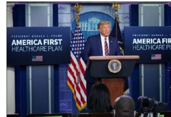
ترامب يتحدث عن خفض أسعار الأدوية