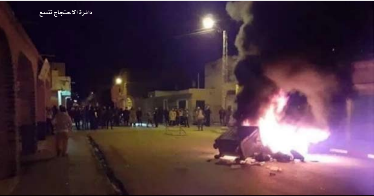
دائرة الاحتجاج تسع

مهددا. وقال العميد إن الوضع يؤسف له ومن متسدد بالخطر. محذرا من المسقف على رؤوس الجميع.