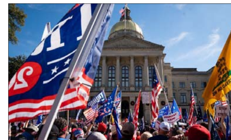
جماهير ترامب ولاء مطلق