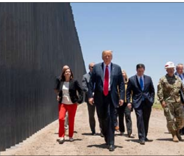
الاحتفاء بـ 200 ميل من الجدار على الحدود مع المكسيك

كان عمال المناجم الضخم من بين الذين وضعوا آمالاً كبيرة عام 2016 على دونالد ترامب. فهل أوفى بالوعد التي قطعها لهم؟ للأسف نعم. خلال فترتي ولاية باراك أوباما، انخفض عددهم بشكل حاد، واستقر خلال السنوات الثلاث الأولى من ولايته فوق 50 ألفاً. ورغم كل شيء، أفلس العديد من شركات التعدين، وانخفض استخدام الضخم لإنتاج الكهرباء، وهو اتجاه طويل المدى يجب أن يستمر: عام 1990، تأتي الكهرباء في الولايات المتحدة بنسبة 52٪ على ارتكاب تجاوزات. وإذا أضفنا إلى ذلك عمليات الطرد (أقل عدداً مما كان عليه في عهد أوباما لأنه، على عكس ما يريد ترامب تصديقه، لم يكن