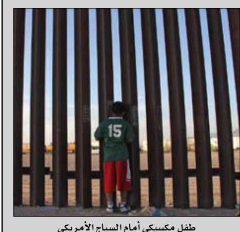
طفل مكسيكي أمام السياج الأمريكي

خارج الولايات المتحدة للأشخاص الذين يدعمونه لأنهم يأملون في أن يرسم نجاحه معالم نجاحهم، لا شك، دونالد ترامب، على عكس جميع السياسيين، يفعل ما يقول، وما يفعله يسير في الاتجاه الصحيح؛ إنه لا يتصرف للدفاع عن مصالح طبقة محظوظة تستخدم السلطة والمال العام لصلحتها، وإنما للدفاع عن الشعب، وتحديداً، الشعب الأمريكي؛ أمريكا أولاً، وأمريكا عظيمة مرة أخرى..