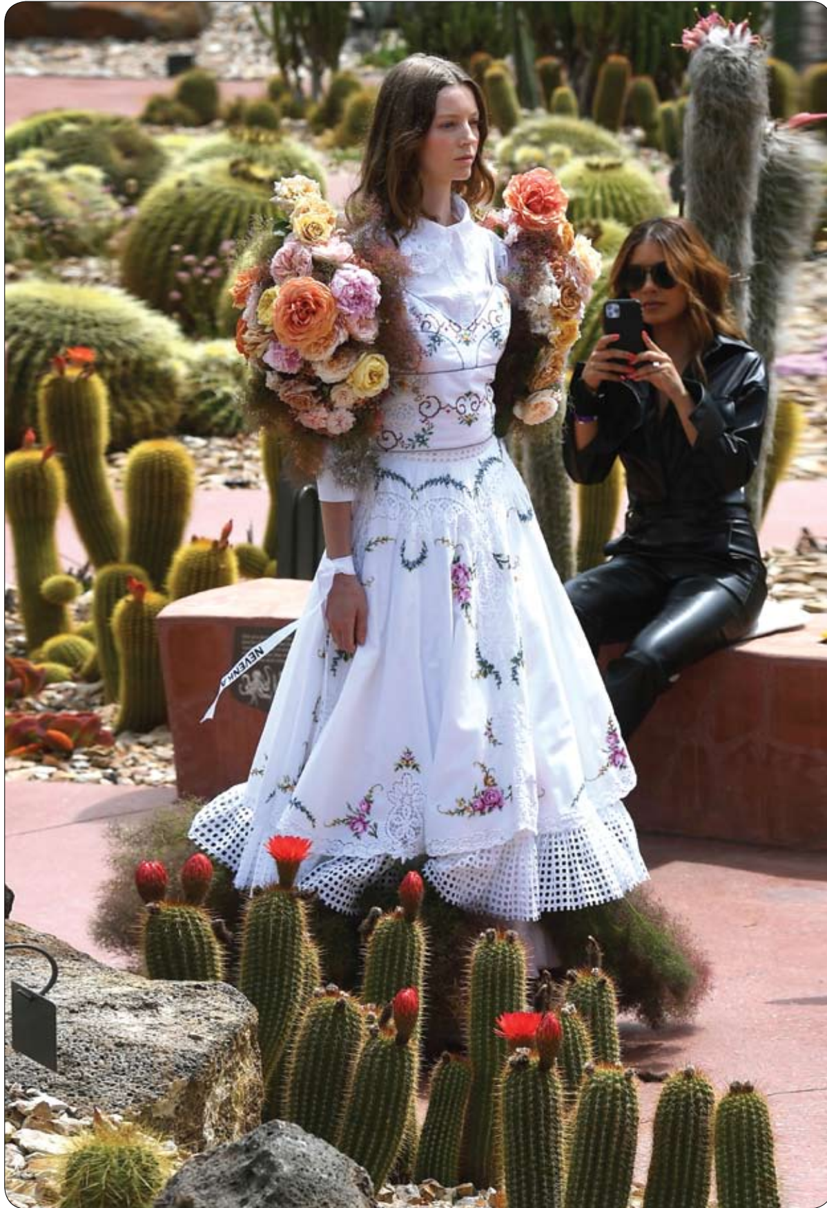
عارضة أزياء تستعرض أزياء العلامة الأسترالية Nevenka في الحدائق النباتية الملكية خلال أسبوع الموضة في ملبورن.

تم افتتاح أول فندق مطلي بالذهب بالكامل في العالم، في مدينة هانوي بفييتنام مؤخراً، بعد أن استغرق بناؤه زهاء 11 عاماً من العمل المتواصل. ويتميز الفندق بمقايض الأبواب والجدران المطلية بالذهب، وأحواض الاستحمام والمراحيض الذهبية الثمينة. كما يقدم الطهاة في الفندق، أطباقاً شهية من شرائح اللحم المغطاة بورق الذهب، من عيار 24 قيراط، وحلويات رائعة. والمثير للمعشاة، أن الإقامة في الفندق في غرفة عادية ليست بأسهظة الثمن، حيث لا تتجاوز 150 دولاراً أمريكياً في الليلة الواحدة. في حين تصل تكلفة الإقامة في الأجنحة الكبرى إلى 900 دولار أمريكي، وتصل تكلفة استئجار شقة فندقية ليوم واحد إلى أكثر من 5000 دولار أمريكي. وقد أبدى العديد من الزبائن إعجابهم بالفندق على موقع "تريب أدايزر"، حيث امتدحوا موجودات الفندق الذهبية الكثيرة ابتداءً من الحمام وانتهاءً بفناجين القهوة وأطباق الطعام الذهبية. يذكر بأن الفندق الذي يتألف من 25 طابقاً، قد يتم تصنيفه على أنه الفندق الأكثر فخامة في العالم، ومن المتوقع أن يشهد إقبالاً كبيراً من السياح بعد انتهاء جائحة كورونا، بحسب ما ورد في صحيفة ستار البريطانية.