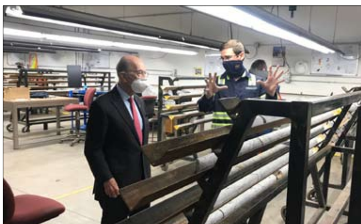
سياسة لم توقف غلق المصانع