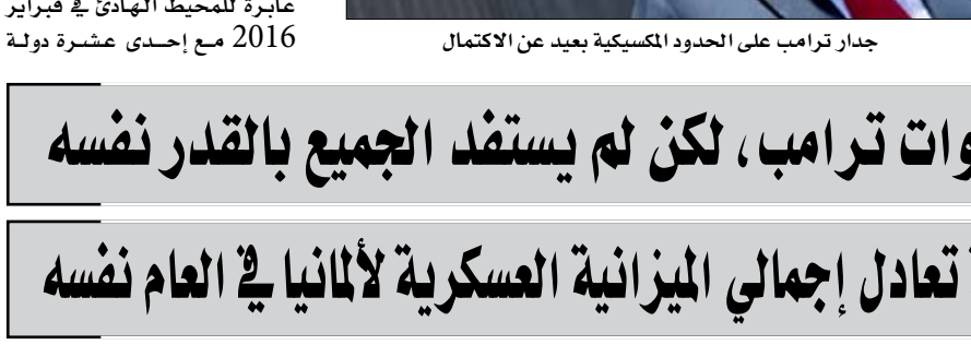
جدار ترامب على الحدود المكسيكية بعيد عن الاحتفال

ارتفاع حاد في عجز الموازنة كلما تعلق الأمر بالسياسة المالية، لم يستطع دونالد ترامب الحصول على كل ما يريده. البرلانيون الجمهوريون، الذين كانوا دائماً متحفظين للغاية عندما يتعلق الأمر بزيادة الإنفاق العام، رفضوا منحه الائتمانات لتحسين البنية