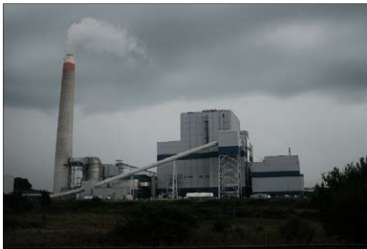
الضخم لتصنيع الكهرباء

أخرى، منها كندا والمكسيك واليابان وأستراليا، من أجل مواجهة النفوذ المتزايد للصين في هذا المجال. وما ان تم انتخاب ترامب، سحب هذا الأخير بلاده من هذه الاتفاقية (مثل انسحابه من اتفاقية باريس للمناخ) وأهان الموقعين عليها. النتيجة: 15 نوفمبر، وقعت الصين اتفاقية تجارة حرة رئيسية، الشراكة الاقتصادية الإقليمية الشاملة، مع 14 دولة أخرى (اليابان وأستراليا وكوريا الجنوبية ونوزيلندا ودول الآسيان العشر). لا شك أن جو بايدن سيقود سياسة حازمة تجاه الصين، لكن يمكننا أن نأمل بأنه سيفعل ذلك بتداه أكثر