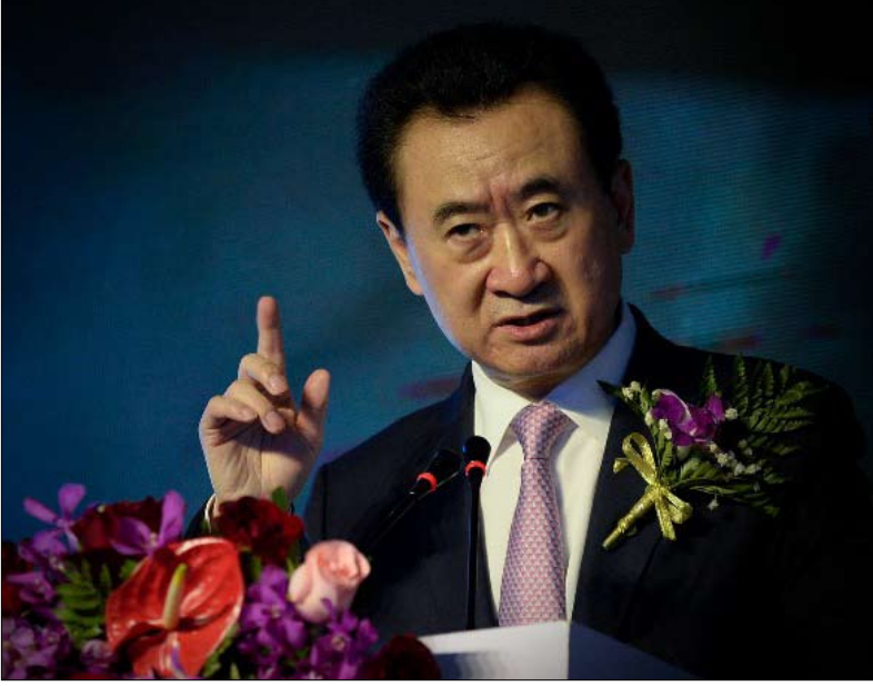
جيان لين، رئيس مجموعة وندا مورس عليه ضغط

«من الجيد أن نصبح أغنياء»، و«تحقيق الثراء أمر مجيد»... هكذا تحدث دنغ شياو بينغ بشكل ملحوظ عام 1992 خلال جولة في جنوب الصين،