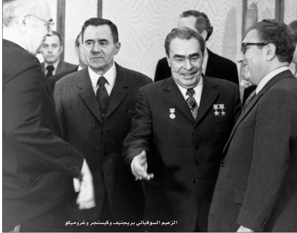
الزعيم السوفييتي بريجنيف وكيسنجر وغروميكو

ولد هنري عام 1924 في فورت، بافاريا، لعائلة يهودية، فر هنري الشاب من النازية عام 1938 مع والديه ليحقق مصيره. درس في جامعة هارفارد بعد الحرب، وأصبح البند اليميني لنيكسون وروكفلر، حاكم نيويورك. بعد ذلك، تولى رئاسة الدبلوماسية الأمريكية طيلة سبع سنوات، وأكد ذاته باعتباره المستشار الأكثر نفوذاً لرئيسين متعاقبين، ريتشارد نيكسون (1969-1974) وجيرالد فورد (1974-1976). في بحث مضمّن "هنري كيسنجر، الأوروبي" (عن دار غاليمارد)، وضع المحامي جيريمي غالون، 35 عاماً، هذا السياسي الماكر على مستوى ميتينريخ، الدبلوماسي التمسائي الذي كان دوره حاسماً في تحديد معالم أوروبا ما بعد نابليون خلال مؤتمر فيينا عام 1815.