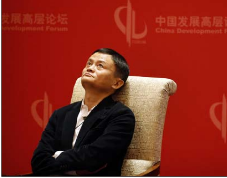
جاك ما اتهمت شركته بممارسة الاحتكار