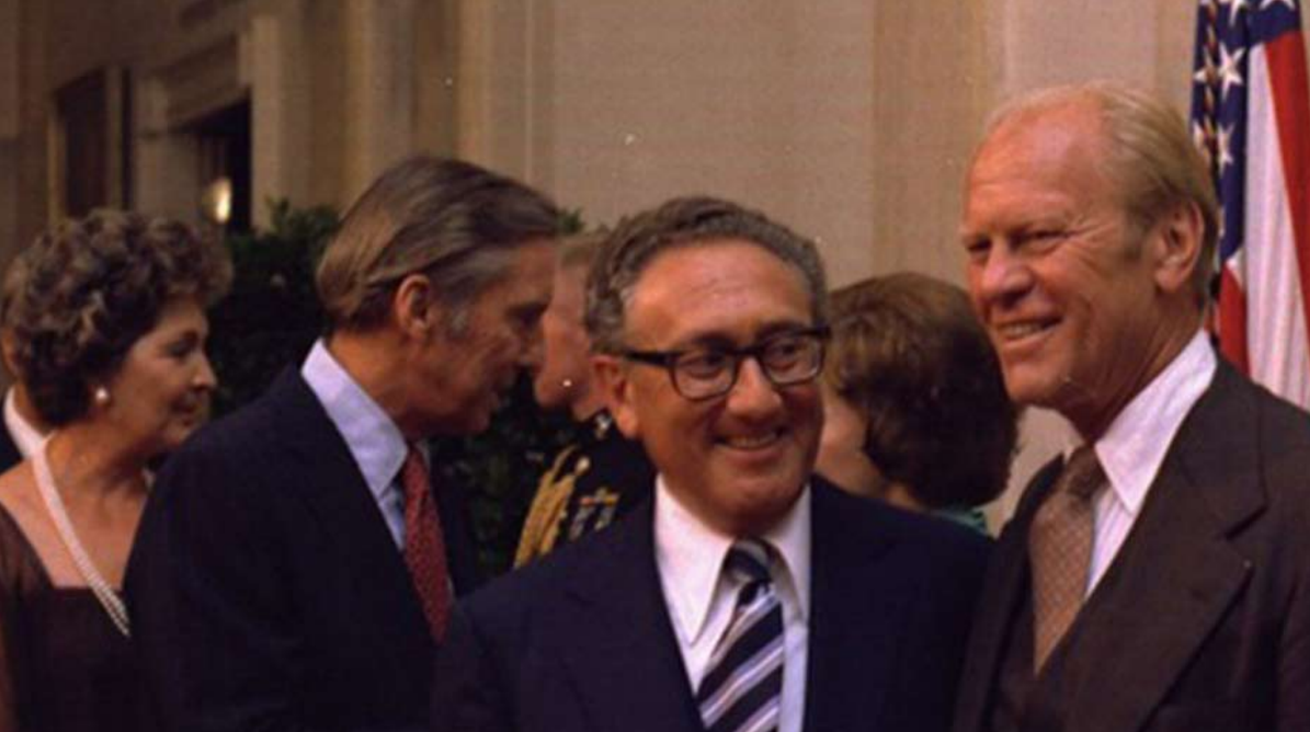
هنري كيسنجر وجيرالد فورد 7 سبتمبر 1977

لم تعد أوروبا تكتب التاريخ، وأصبح مصيرها يقرره الخصوم