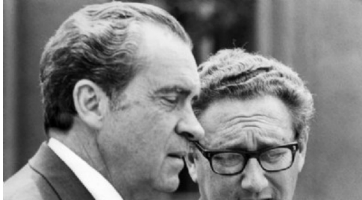
الرئيس الأمريكي ريتشارد نيكسون وهنري كيسنجر مايو 1972 في سايزبورغ