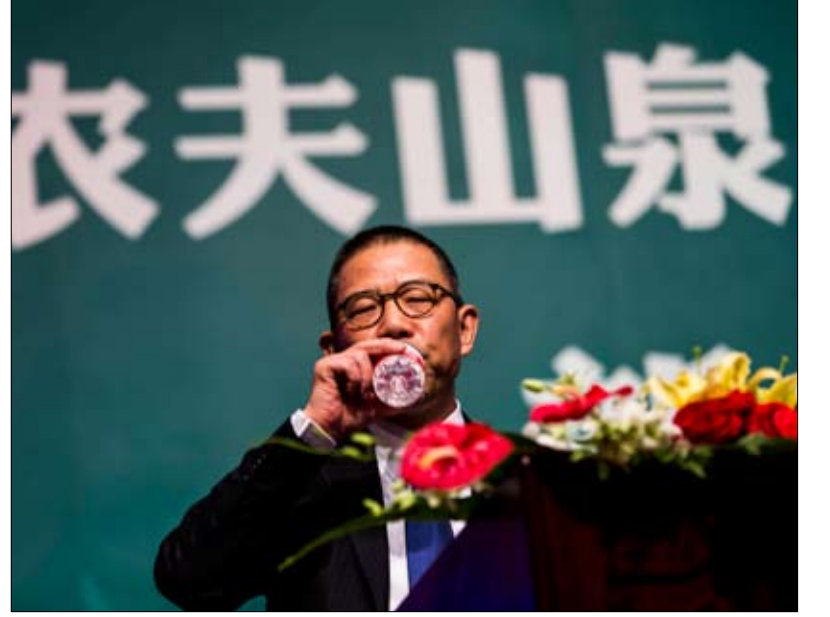
تشونغ شانشان الثروة الثالثة عشرة في العالم، والتي تقدر بنحو 68 مليار دولار 2011