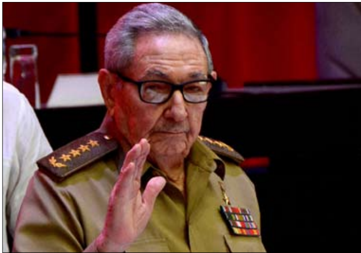
زعيم الحزب الشيوعي الكوبي السابق راؤول كاسترو

يحظى لوبيز مييرا، باحترام كبير من قبل الجيش، لكن لا طموح سياسي له