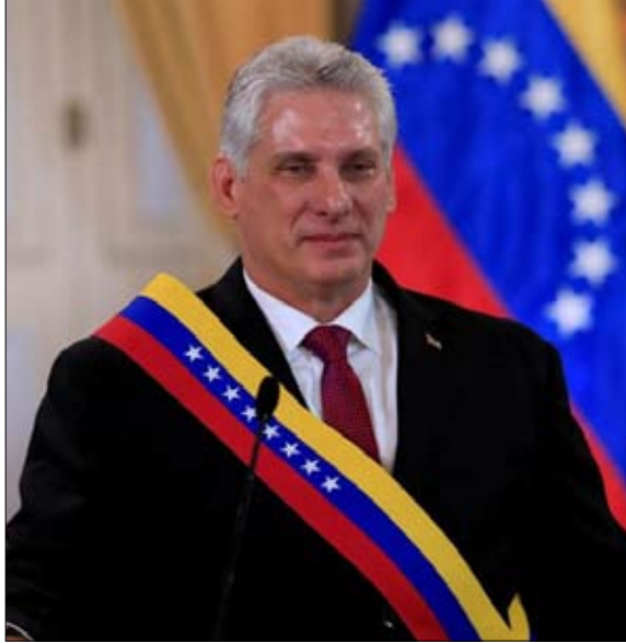
ميجيل دياز كانيل خليفة لا يسعد السلطة فعلاً

منذ المؤتمر الثامن للحزب الشيوعي الكوبي الشهر الماضي، لم يعد أي من أسرة كاسترو من بين الهيئات الحاكمة للجزيرة... الأولى منذ عام 1959. من يتذكر أوزفالدو دورتيكوس؟