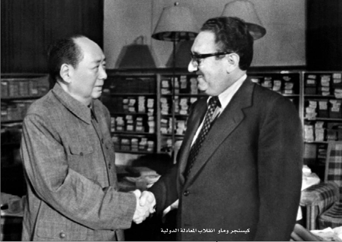
كيسنجر وماو انقلاب المعادلة الدولية