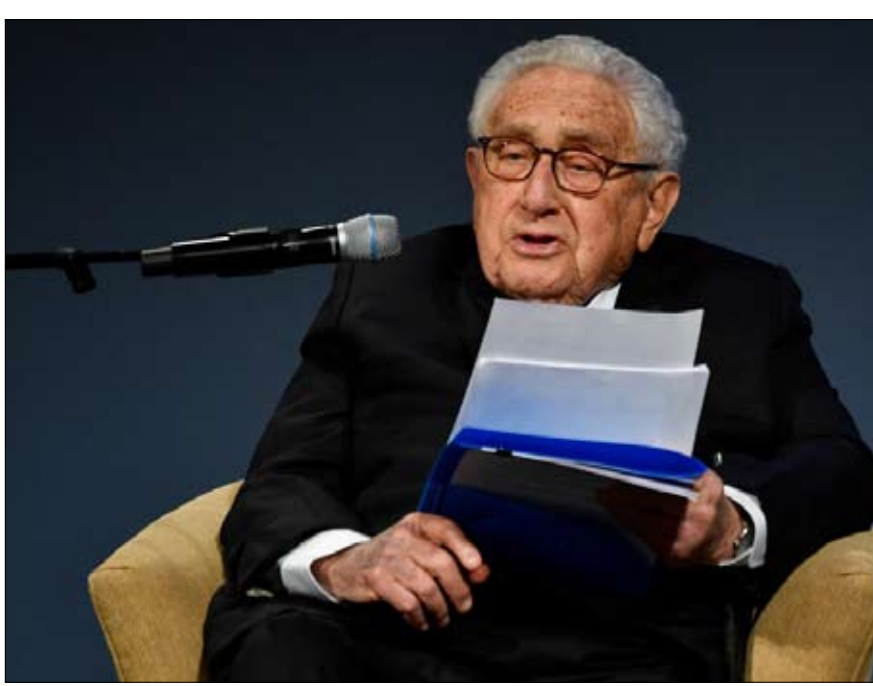
هنري كيسنجر صانع النظام العالمي الحالي

التي صاغها كيسنجر وطبقها. ولكن، ما هي الدروس التي يمكن أن نتعلمها من مؤلف كتاب "الدبلوماسية"، وهو كتاب جامع، وشهادة جيوسياسية نشرت عام 1994؛ أولاً، أن العلاقات الدولية تتنزل على المدى الطويل وتتطلب شجاعة يبدو أنها غالباً ما تفلت من أيدينا اليوم. منذ فترة طويلة جداً، يلاحظ الكاتب غالون بيرو، أن الاتحاد الأوروبي قد انحرف إلى دبلوماسية تزيديان تتخللها الأخلاق والمثالية، ولكنها ساهمت فقط في عزلنا وتحقيرنا. نحن الأوروبيين، لم نعد نكتب التاريخ. وفي الأزمات التي تتكشف على أعتابنا وتؤثر بشكل مباشر على استقرارنا، لسنا مدعويين حتى إلى طاولة المفاوضات، كما ان خصومنا ومناهبنا يقررون، من خلال قراراتهم، مستقبل أوروبا. في وقت ليس ببعيد، في يوغوسلافيا السابقة، في قلب قارتنا، لم يتمكن قادتنا من تفادي الربيع.