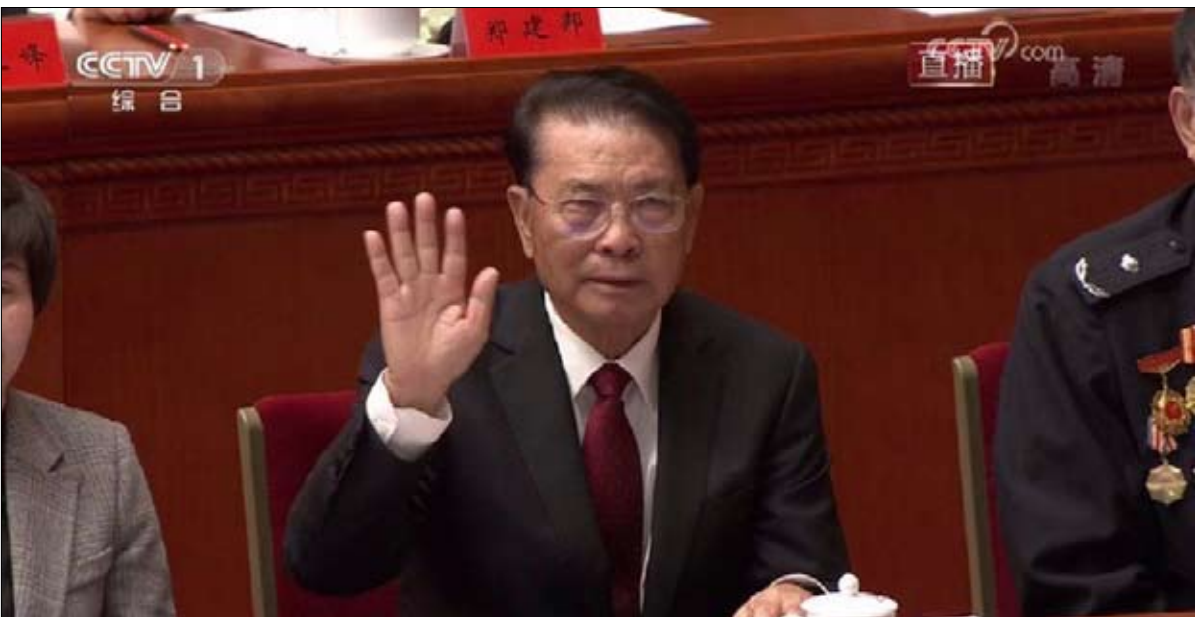
هو يا شيانغ جيان، الذي تقدر ثروته بـ 37 مليار دولار