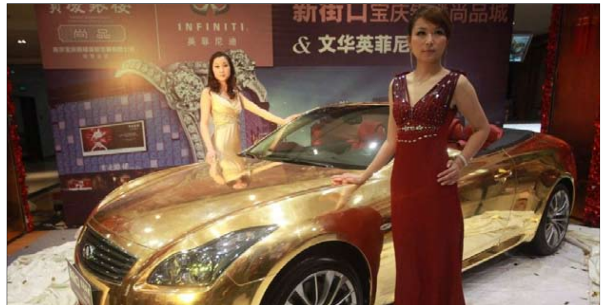
سيارة من الذهب معروضة في متجر مجوهرات في مقاطعة جيانغسو عام 2011