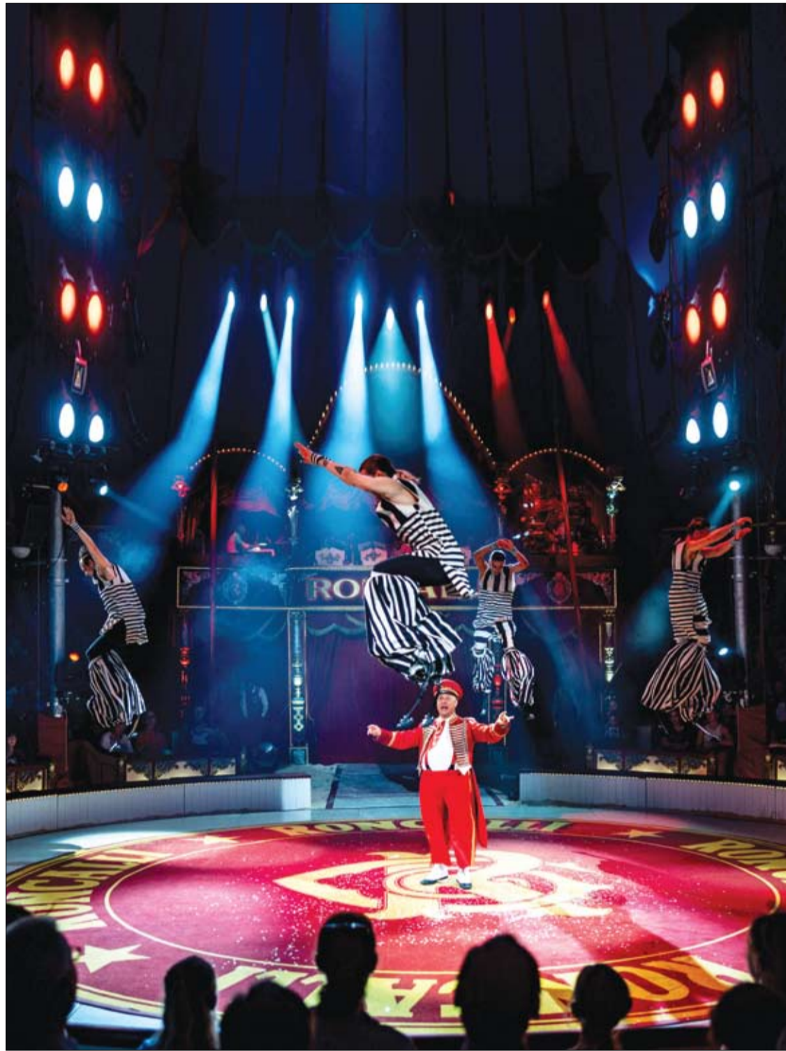
فنانون يقدمون عرضاً للألعاب البهلوانية خلال عرض سيرك روتكالي في لوبيك، شمال ألمانيا. (أ ف ب)

ويشير الطبيب، إلى أنه في كثير من الأحيان، يحدث إبهام القدم الأروح (تشوه اصبع القدم الكبير) عند الأشخاص الذين يشاركون بشكل احترافي في رقص الباليه أو الجمباز الإيقاعي أو التزلج على الجليد. بالنسبة إلى راقصات الباليه ولاعبي الجمباز، فإن سبب التشوه ناجم عن الحمل الزائد في القوس الأمامي للقدم بسبب المشي على أنصاف أصابع القدم، بالنسبة للمتزلجين على الجليد - بسبب هيئة حذاء التزلج.