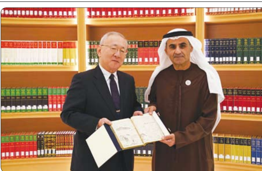
أبو ظبي - الفجر

استقبل سعادة الدكتور علي بن تميم، رئيس مجلس إدارة هيئة أبوظبي للغة العربية، الأمين العام لجائزة الشيخ زايد للكتاب، في مكتبه بمكتبة قصر الوطن، سعادة اكيهيكو ناكاميما سفير اليابان لدى دولة الإمارات العربية المتحدة. رحب رئيس هيئة أبوظبي للغة العربية بسعادة السفير الياباني، مؤكداً أهمية تعزيز التعاون الثقافي مع اليابان. من جهته، أشنى سفير اليابان على حسن الاستقبال في صرح يمثل أحد أهم معالم الجذب الثقافي، مؤكداً شغفه باللغة العربية وأدائها، والعمل على التبادل الثقافي والتعاون المثمر مع مؤسسة اليابان الثقافية والمعاهد المعنية باللغة العربية والترجمة. وتبادل الطرفان جملة من المقترحات منها تنظيم ورش عمل للإبداع والكتابة الشعرية والسردية بين الشباب اليابانيين والإماراتيين.