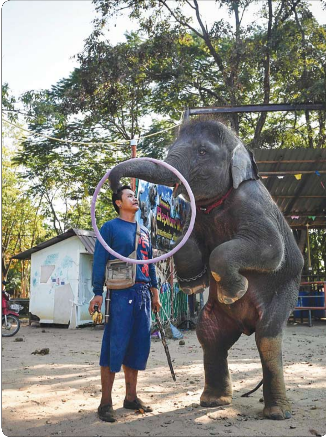
مدرب يدرّب الفيل الصغير «بلوي» على أداء استعراض في مقاطعة سورين شمال شرق تايلاند.

هل تتعرض للشعور بالجوع المتكرر خلال ساعات عملك؟، إذا كنت ترغب في تهدئة شهيتك وتجنب تلك المنتجات الغذائية الغنية بالسعرات الحرارية، فإليك بعض الاقتراحات لتناول وجبات خفيفة صحية يمكنك أن تأخذها معك لتناولها في العمل، وفقا لموقع step to health 1 - وجبات خفيفة صحية بالخضار: اختر الخضروات المفضلة لديك (الجزر، الكوسة، البنجر، إلخ) ثم قطعها إلى شرائح رقيقة جدا ويمكن تناولها مع رقائق الخبز المحمص البني. - أدهنها بزيت الزيتون والأعشاب العطرية (توابل، فلفل، إكليل الجبل، كاري، إلخ). - أخبزها في الفرن لمدة 20 دقيقة في درجة حرارة متوسطة. 2- زبادي بالفواكه والقررفة والشوكولاته الداكنة: الخيار الأفضل عند اختيار الزبادي هو الزبادي دون إضافة السكر أو المحليات. - يمكنك اختيار زبادي طبيعي كامل الدسم حسب احتياجاتك وتفضيلاتك الفردية. - يفضل المذاق الحلو للفواكه والقررفة والشوكولاته الداكنة، سيكون هذا المزيج لذيذاً ومقبلاً. - شيء مهم آخر يجب تذكره هو التأكد من أن الشوكولاته الداكنة تحتوي على 70% على الأقل من الكاكاو. - يمكنك تغيير الفاكهة التي تختار إضافتها لإنشاء خيارات مختلفة. - امزج كل شيء ووضعه في حاوية بلاستيكية لأخذها في العمل. 3- بسكويت الشوفان والموز الصحي: إذا كنت أحد الأشخاص الذين يحبون تناول وجبة خفيفة بين الوجبات، فإليك نوعاً مختلفاً من الوصفات. - أولا امرس الموز الناضج بشوكه واخبطه مع الشوفان. - إذا أردت، أضف بعض القررفة المطحونة والمكسرات والفواكه المجففة مثل الزبيب. - ثم قسم العجينة إلى أجزاء صغيرة حول ملعقة كبيرة. - ضعها على ورقة خبز وخبزها لمدة 15-20 دقيقة على 180 درجة، واتركها تبرد.