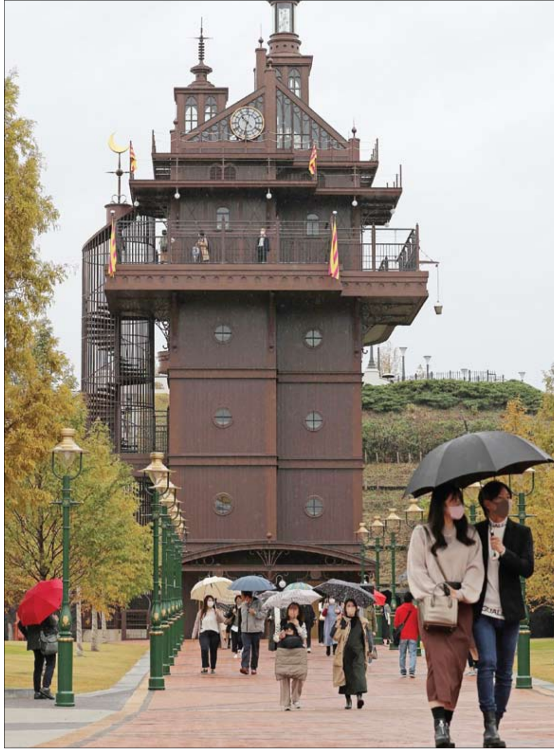
الزوار يسحبون عبر 'برج المصعد، بالقرب من المدخل، في اليوم الأول لافتتاح حديقة جيبلي الجديدة في ناغاكوت، اليابان. ا ب

وجدت دراسة جديدة أن النساء اللواتي يتبعن نظاماً غذائياً نباتياً يرتفع خطر الإصابة لديهن بكسر الورك بنسبة 33% مقارنة بمن يأكلن اللحوم. شاركت أكثر من 26000 امرأة تتراوح أعمارهن بين 35 و69 عاماً من جميع أنحاء المملكة المتحدة في الدراسة، وقيمت مخاطر الإصابة بكسر الورك بين النباتيين، والنساء اللواتي يتناولن الأسماك ولكن ليس اللحوم، واللواتي يتناولن اللحوم في بعض الأحيان مقارنة مع الذين يتناولون اللحوم بانتظام. ولاحظ الباحثون بعد حوالي 20 عاماً، 822 كسراً في الورك بين النساء، حوالي 3%. وأن ارتفاع خطر الإصابة بكسر الورك كان فقط بين النباتيات مقارنة بالنساء اللواتي تناولن اللحوم بانتظام. وتم استخلاص البيانات من دراسة مجموعة النساء في المملكة المتحدة، والتي تتعقب النساء بمرور الوقت لتقييم المخاطر بين النظام الغذائي والصحة. وقال المؤلف الرئيسي للدراسة جيمس ويبستر: "دراستنا تسلط الضوء على المخاوف المحتملة فيما يتعلق بكسر الورك لدى النساء النباتيات، ومع ذلك فهي لا تحذر الناس من التخلي عن النظم الغذائية النباتية، كما هو الحال مع أي نظام غذائي، من المهم فهم الظروف الشخصية وما هي العناصر الغذائية. اللازمة لنمط حياة صحي متوازن".