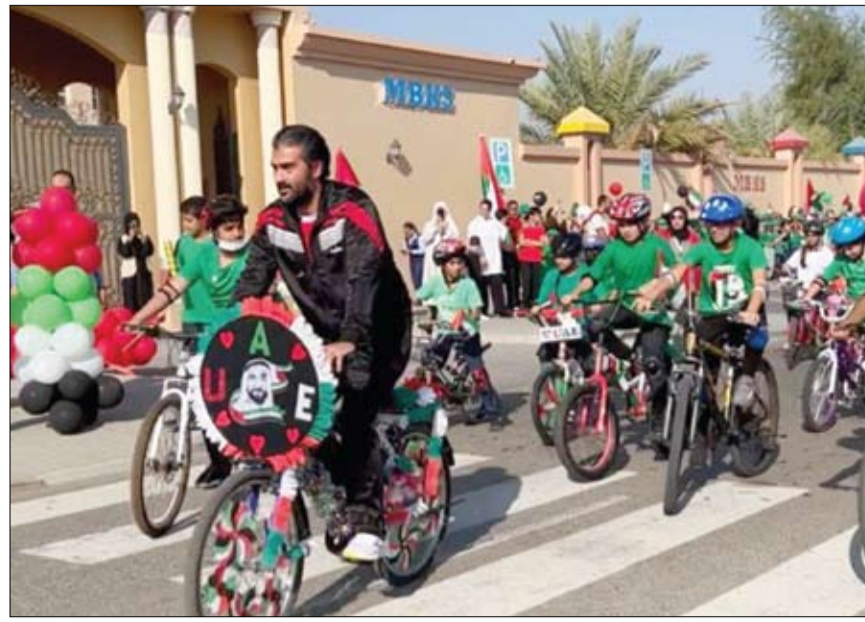
برعاية شما بنت محمد