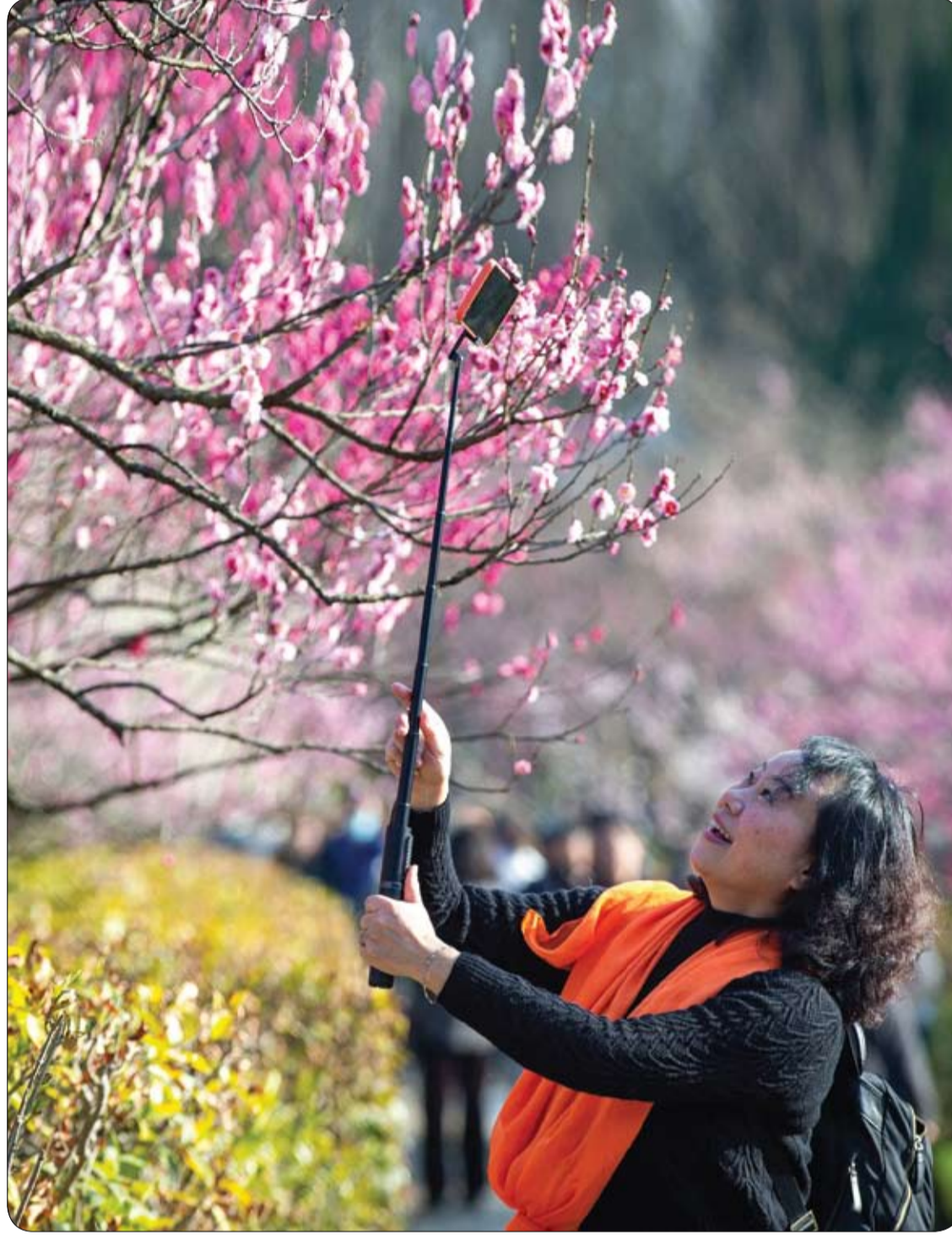
امرأة تلتقط صوراً سيلفي وسط الأزهار في مهرجان نانجينغ الدولي لأزهار البرقوق في نانجينغ

لعل أبرز التدخلات الرامية إلى مكافحة الملاريا هي سرعة توفير العلاج الناجح المتمثل في العقاقير التي تحتوي على مادة الأرتيميسينين وفسفات الكلوروكين؛ وحث الفئات الخططرة على استخدام التاموسيات المعالجة بمبيدات الحشرات؛ والرش داخل المباني باستخدام مبيد للحشرات من أجل مكافحة الحشرات النواقل.