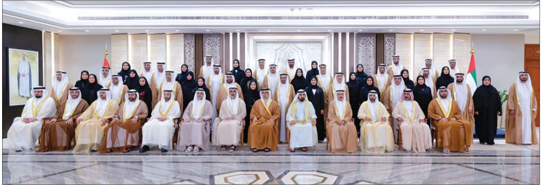
محمد بن راشد ومتصور بن زايد وأولياء العهود والشيخ في صورة تذكارية مع أعضاء المجلس الوطني الاتحادي (وام)

حمدان بن زايد يتفقد سير العمليات التشغيلية بمحطة قطار الاتحاد بمدينة المرفأ دبي - الطفرة-وام: زار سمو الشيخ حمدان بن زايد آل نهيان، ممثل الحاكم في منطقة الطفرة، محطة شركة الاتحاد للقطارات للنقل بالسكك الحديدية في مدينة المرفأ، للاطلاع على سير العمليات التشغيلية في منطقة الطفرة. (التفاصيل ص4)