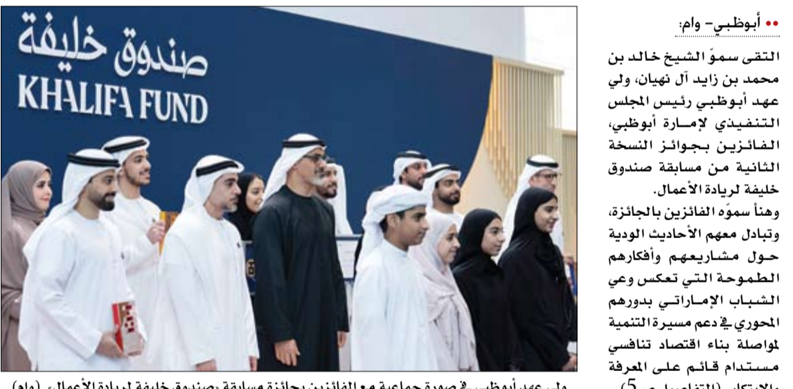
ولي عهد أبو ظبي في صورة جماعية مع الفائزين بجائزة مسابقة «صندوق خليفة لريادة الأعمال»