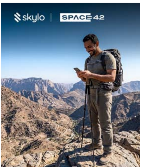
جديدة من الأجهزة الذكية الحالية والمستقبلية، على أن يتم طرحها في المستقبل القريب.

والتجارة العالمية. وأكدت سعادة نورة خليفة السويدي، الأمينة العامة للاتحاد النسائي العام، أن إطلاق المسار الدولي من البرنامج التدريبي «أطلق» يأتي في إطار جهود الاتحاد الرامية إلى نقل التجربة الإماراتية الرائدة في تمكين المرأة إلى أفاق عالمية، مستندة إلى الدعم اللامحدود من القيادة الرشيدة، ورؤية سمو الشيخة فاطمة بنت مبارك «أم الإمارات»، في تمكين المرأة وتعزيز جاهزيتها للمشاركة الفاعلة في القطاعات الحيوية والمستقبلية. وتوجهت سعادتها بالشكر والتقدير إلى مجموعة موانئ أبوظبي لجهودها النوعية في تطوير البرنامج، وتوظيف خبراتها الوطنية الرائدة في مجالات التجارة الرقمية