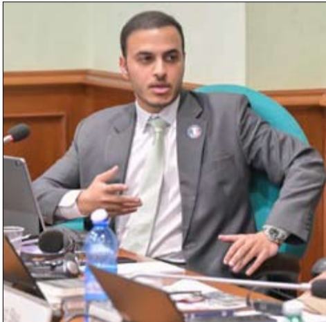
لتشمل أوروبا، والعالم العربي، وأفريقيا، وآسيا، والأمريكتين.