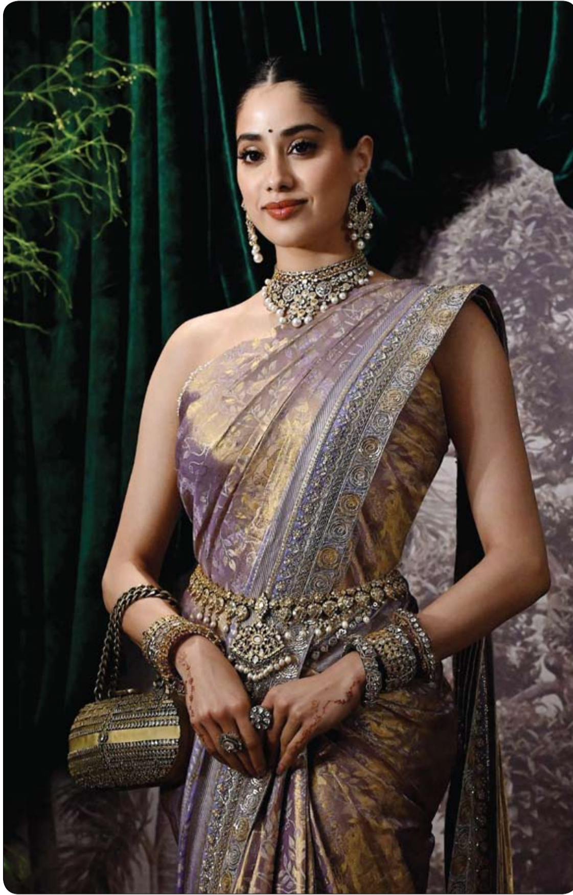
الممثلة الهندية جاني جاني كابور لدى حضورها حفل زفاف شقيقتها أنشولا كابور في مومباي.

تعرض طفل يبلغ من العمر 11 عاماً لهجوم مفاجئ من تمساح أثناء رحلة صيد برفقة والده في ولاية فلوريدا الأمريكية، ما أدى إلى فقدانه يده اليمنى بعد محاولات عدة لإبقائها. وذكرت لجنة فلوريدا لحماية الأسماك والحياة البرية (FWC)، أن الحادث وقع داخل مخيم نيلسون للصيد بالقرب من مدينة أوماتيلا في مقاطعة ماريون، بعد تلقي بلاغ يفيد بتعرض طفل لعضة تمساح أثناء صيده الأسماك من الشاطئ. ونقل الطفل، الذي عرّفته عائلته باسم برودي تيري، إلى المستشفى لتلقي العلاج، فيما أوضحت اللجنة أن أحد ضباطها تمكن من إطلاق سراح التمساح الذي بلغ طوله نحو 8 أقدام و7 بوصات.