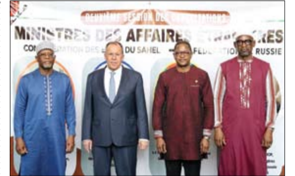
لافروف خلال لقائه وزراء خارجية النيجر وبوركينا فاسو ومالي في نيامي

زيلينسكي يعلن استهداف منشأة نفطية روسية على بُعد 1500 كيلومتر •• عواصم - وكالات: أعلن الرئيس الأوكراني فولوديمير زيلينسكي، الخميس، أن القوات الأوكرانية، تواصل تنفيذ ما وصفه بخطة العقوبات بعيدة المدى، ومن ذلك توجيه ضربة على منشأة نفطية روسية على مسافة تقارب 1500 كيلومتر من حدود أوكرانيا. وقال زيلينسكي في منشور على منصة (إكس)، يفند محاربونا خطة العقوبات بعيدة المدى رداً على إطالة روسيا أمد الحرب واستمرار هجماتها. وقد شهدت الأيام الأخيرة ضربات ناجحة استهدفت منشآت تدعم قطاع النفط الروسي وتغذي سياسته الحربية وفق تعبيره. وأوضح الرئيس الأوكراني أن