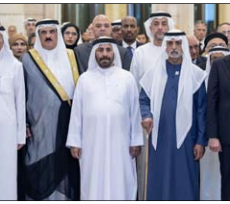
التاريخية التي تجمع الشعبين الشقيقين، وقال إن العلاقات بين الإمارات ومصر هي قصة وفاء وشراكة مصر امتدت لأكثر من نصف قرن، وإن دعائمها أرساها المغفور له الشيخ زايد بن سلطان آل نهيان، طيب الله ثراه، الذي آمن بمصر ودورها المحوري، فيما

متكاملة تقوم على الثقة المتبادلة ووحدة الرؤى تجاه القضايا الإقليمية. وأشار إلى أن المواقف المتبادلة بين البلدين أكدت أن أمن مصر والإمارات كل لا يتجزأ، مشيداً بالمواقف الأخوية التي جسدت التضامن بين البلدين، مثنياً ما حقته دولة الإمارات من تطور في قدراتها الدفاعية والأمنية، وما أظهرته مؤسساتها من جاهزية واحترافية في حماية أراضيها ومشاركتها الحيوية، بما عزز أمن المجتمع ورسخ مكانة الإمارات نموذجاً للدولة القادرة على حماية منجزاتها ومواصلة مسيرة التنمية. ونوه بالدور الذي يقوم به أبناء الجالية المصرية في دولة الإمارات، مؤكداً أنهم ليسوا مجرد جالية مقيمة، بل شركاء في مسيرة النهضة والتنمية التي تشهدها