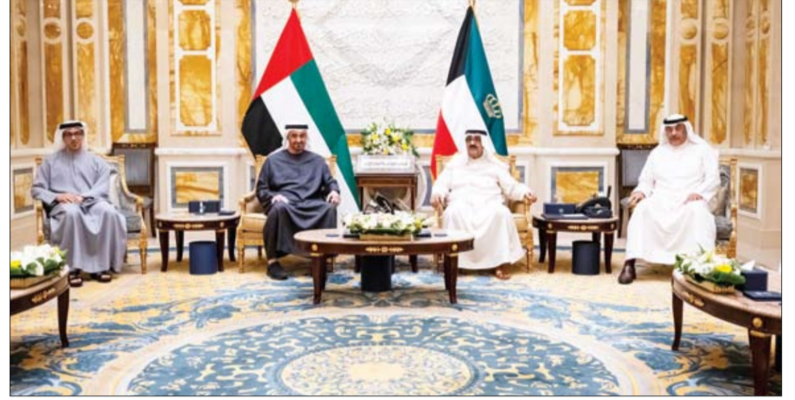
خلال زيارة أخوية.. محمد بن زايد ومشعل يبحثان تعزيز علاقات التعاون والتطورات في الشرق الأوسط