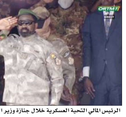
الرئيس المالي التحيه العسكرية خلال جنازة وزير الدفاع.

مؤكداً أن موسكو ستواصل دعمها العسكري في مواجهة الجماعات المسلحة. وأضاف أن العمليات الروسية تأتي في إطار مكافحة التهديدات الإرهابية التي تشهدها البلاد. وجاءت التصريحات الروسية عقب هجمات واسعة أعلنت عنها وزارة الدفاع الروسية، حيث أفادت بأن مسلحين تابعين لجماعة ما يسمى بـ«نصرة الإسلام والمسلمين» وجهت تحرير أفراد شتوا في 25 من أبريل هجمات منسقة استهدفت العاصمة باماكو وعددا من المدن الرئيسية، بينها سيغاري وغاوا مالي يستند إلى طلب واحتياجات الحكومة الحالية.