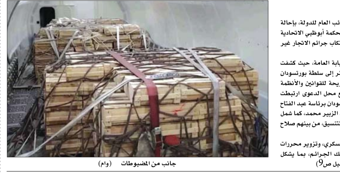
جانب من المضبوطات

أمر معالي المستشار الدكتور حمد سيف الشامسي، النائب العام للدولة، بإحالة 19 متبهما بينهم ست شركات مسجلة في الدولة إلى محكمة أبوظبي الاتحادية الاستثنائية (دائرة أمن الدولة)، وذلك على خلفية ارتكاب جرائم الاتجار غير المشروع في العتاد العسكري والتزوير وغسل الأموال. جاء قرار الإحالة عقب تحقيقات موسعة أجرتها النيابة العامة، حيث كشفت الوقائع عن محاولة التهمين تمرير شحنة من الذخائر إلى سلطة بورتسودان عبر أراضي الإمارات العربية المتحدة، في مخالفة صريحة للقوانين والأنظمة المعمول بها في الدولة. وأظهرت التحقيقات أن الوقائع محل الدعوى ارتبطت بصفتان تمت بطلب من لجنة التحقيق أن الوقائع محل الدعوى ارتبطت بالبرهان ونائبه ياسر العطا، ويتتبع من عثمان محمد الزبير محمد، كما شمل نطاق الاتهام شخصيات نسبت إليها أدوار في التوجيه والتنسيق، من بينهم صلاح عبد الله محمد صالح (الملقب بصالح قوش). ويواجه المتهمون تهم الاتجار غير المشروع في العتاد العسكري، وتزوير محرمات رسمية واستعمالها، وغسل الأموال المحصلة من تلك الجرائم، بما يشكل مخالفة جسيمة لقوانين الدولة وأنظمتها. (التفاصيل ص9)