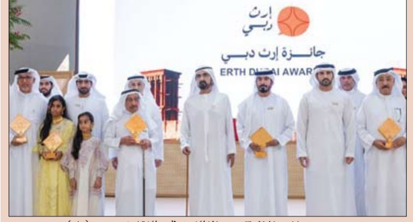
محمد بن راشد خلال تكريمه الفائزين في «جائزة إرث دبي»

كرم صاحب السمو الشيخ محمد بن راشد آل مكتوم، نائب رئيس الدولة رئيس مجلس الوزراء حاكم دبي، «رعاه الله»، بحضور سمو الشيخ حمدان بن محمد بن راشد آل مكتوم، ولي عهد دبي، نائب رئيس مجلس الوزراء وزير الدفاع، رئيس المجلس التنفيذي لإمارة دبي، امس الخميس الفائزين في «جائزة إرث دبي»، إحدى أكبر الجوائز المتخصصة في مجال التوثيق الثقافي والاجتماعي وذلك خلال حفل رسمي أقيم في متحف المستقبل احتفاءً بإسهامات الأفراد والجهات في حفظ الذاكرة الحية لإمارة دبي وصون هويتها الوطنية، وترسيخ ثقافة التوثيق المجتمعي باعتبارها ركيزة أساسية من ركائز الوصي الوطني واستدامة الهوية. وأكد سمو الشيخ حمدان بن محمد بن راشد آل مكتوم أن مسيرة دبي نحو الصدارة العالمية تستند إلى هوية راسخة وذاكرة حية تشكل جزءاً أصيلاً من نموذجها التنموي، مشيراً إلى أن الحفاظ على الإرث وتوثيق التحولات الثقافية والاجتماعية يسهم في تعزيز قدرة المجتمع على مواصلة التقدم بثقة، ما يضمن استدامة النمو القائم على التوازن بين الأصالة والحداثة. وأضاف سموه أن رؤية وتوجيهات صاحب السمو الشيخ محمد بن راشد آل مكتوم أرست نهجاً واضحاً في ترسيخ التاريخ والهوية جزءاً من مشروع دبي الحضاري. (التفاصيل ص3)