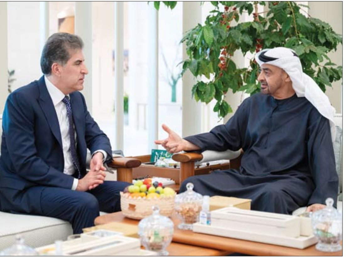
رئيس الدولة خلال مباحثاته مع رئيس إقليم كردستان العراق الشقيق (وام)

استقبل صاحب السمو الشيخ محمد بن زايد آل نهيان رئيس الدولة حفظه الله، معالي نجييرفان بارزاني رئيس إقليم كردستان العراق الشقيق. وبحث سموه مع معالي نجييرفان بارزاني، خلال اللقاء، مختلف أوجه التعاون بين دولة الإمارات العربية المتحدة وجمهورية العراق الشقيق عامة وإقليم كردستان خاصة وسبل تنميته وتوسيع آفاقه بما يعود بالخير والنماء على الشعبين الشقيقين. كما تبادل الجانبان وجهات النظر بشأن عدد من القضايا محل الاهتمام المشترك، وفي مقدمتها التطورات الإقليمية بما تنطوي عليه من تداعيات خطيرة على الأمن والاستقرار الإقليمي والدولي. من جهة أخرى تلقى صاحب السمو الشيخ محمد بن زايد آل نهيان رئيس الدولة حفظه الله أمس اتصالاً هاتفياً من معالي كريستوفر لاسكن رئيس وزراء نيوزيلندا، بحثاً خلاله مختلف جوانب التعاون والعمل المشترك بين البلدين وسبل تعزيزهما خاصة في المجالات الاقتصادية والتجارية والاستثمارية والطاقة المتجددة بما يحقق مصالحهما المتبادلة. وذلك في إطار اتفاقية الشراكة الاقتصادية الشاملة بين البلدين. (التفاصيل ص2)