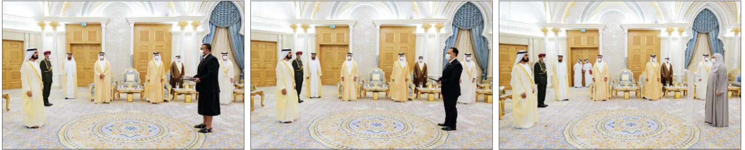
منوهاً بدور وزارة الخارجية والتعاون الدولي في بناء جسور الاتصال والتواصل مع جميع سفراء الدول الشقيقة والصديقة

تماشياً مع خطة وزارة الصحة ووقاية المجتمع لتوسيع وزيادة نطاق الفحوصات في الدولة بهدف الاكتشاف المبكر وحصر الحالات المصابة بفيروس كورونا المستجد "كوفيد - 19" والمخالطين لهم وعزلهم أعلنت الوزارة عن إجراء 287,544 فحصاً جديداً خلال الساعات الـ 24 الماضية على فئات مختلفة في المجتمع باستخدام أفضل وأحدث تقنيات الفحص الطبي. وساهم تكثيف إجراءات التقصي والفحص في الدولة وتوسيع نطاق الفحوصات على مستوى الدولة في الكشف عن 1,513 حالة إصابة جديدة بفيروس كورونا المستجد من جنسيات مختلفة، وجميعها حالات مستقرة وتخضع