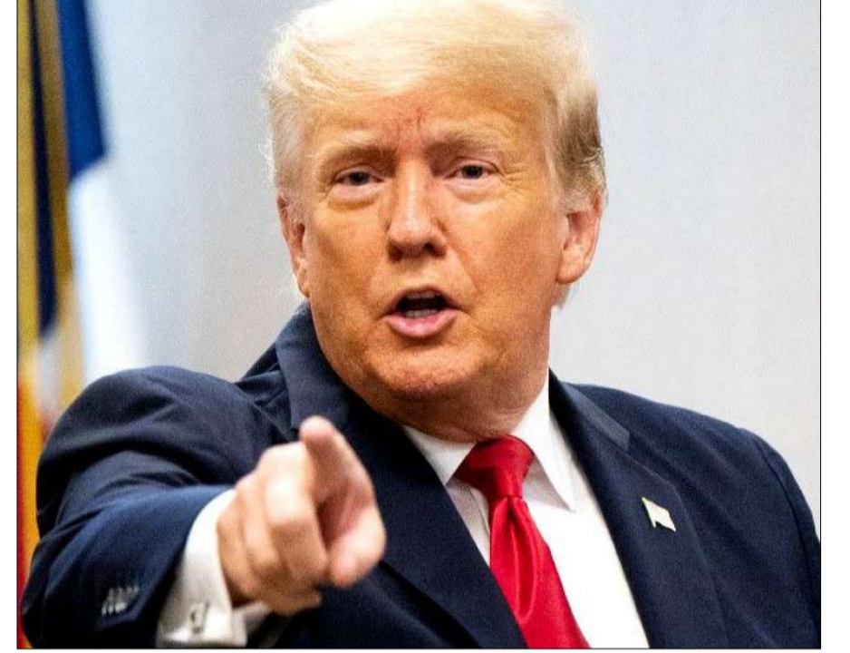
ترامب على قائمة أسوأ التلاميذ

مع كل تغيير إداري منذ عام 2000، تستجوب القنات السياسية "سي-سيان" لجنة من المؤرخين والمراقبين للحياة السياسية الأمريكية من أجل إنشاء ترتيب للرؤساء. بالنسبة لنسخة 2021، تمت دعوة أكثر من 140 خبيراً لتقييم هؤلاء في فئات مختلفة من القيادة، الإقناع العام، وإدارة الأزمات، والإدارة الاقتصادية، والسلطة الأخلاقية، والعلاقات الدولية، والعلاقات مع الكونغرس، والعدالة المتساوية للجميع، والأداء في سياق العصر. إلخ. دونالد ترامب ينضم إلى هذه القائمة لأول مرة. ورغم أنه ليس الأخير في الترتيب، إلا أنه لن يكون المستأجر الخامس والأربعون للبيت الأبيض سعيداً بالترتبة التي حصل عليها.