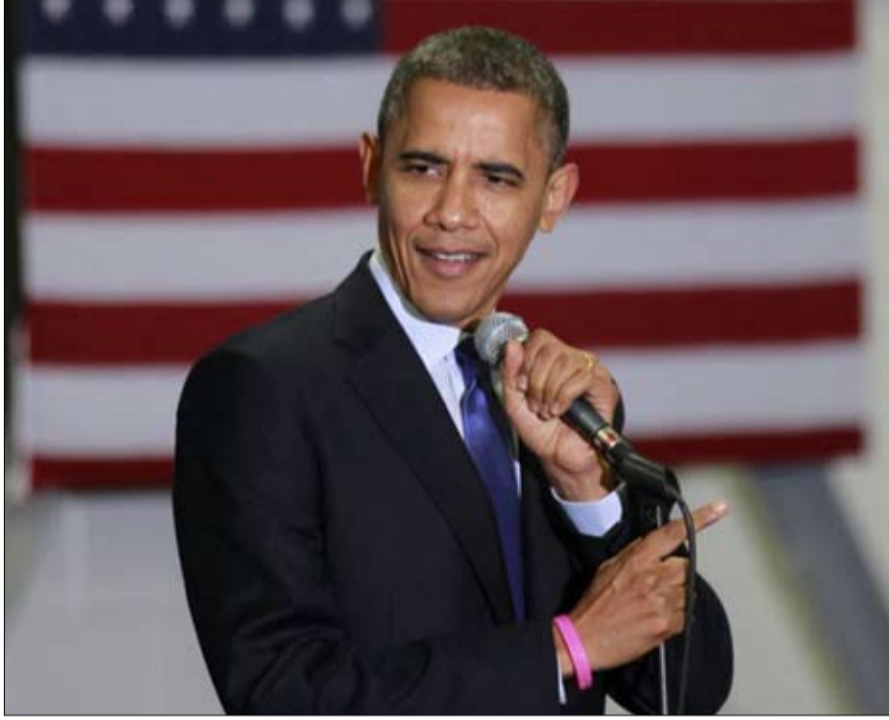
التساؤل عن المركز العاشر الممنوح لباراك أوباما

المرتبة 21، وهو الآن 19. نفس الشيء بالنسبة لجورج دبليو بوش الذي انتقل من المركز 36 إلى المركز 29 في عقدين من الزمن. لذلك يمكن أن يظل دونالد ترامب وأنصاره متفائلين. مع ذلك، فإن الريموندات تدل بأن تكون معقدة. حتى وليام هنري هاريسون، الذي تولى بعد شهر واحد فقط من توليه منصبه، هو في وضع أفضل (40).