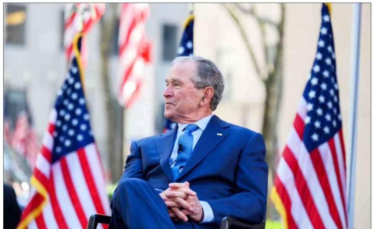
بوش.. تحول إيجابي خلال عقدين