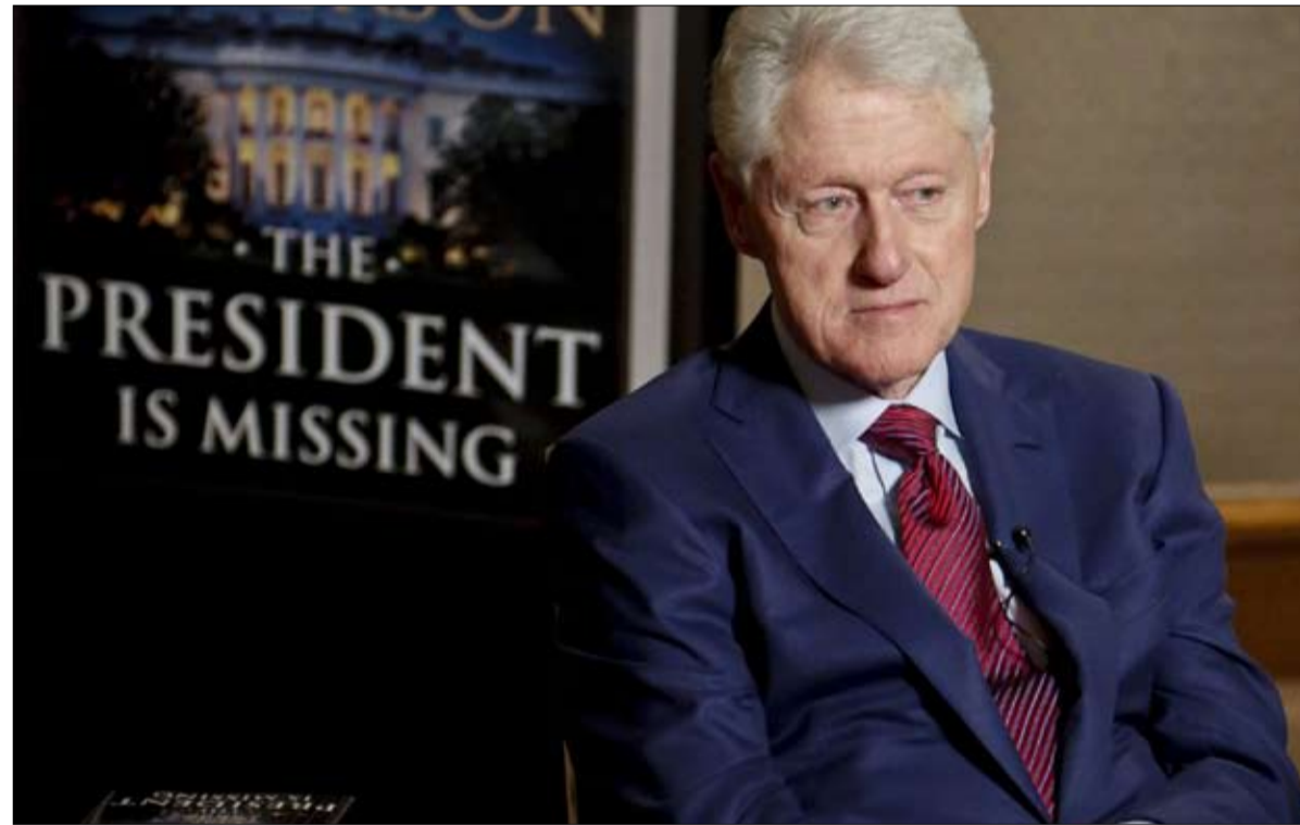
بيل كلينتون.. تغير ترتيبه إلى الاحسن

يمكن أن يتغير موقع ترامب في الترتيب، خاصة إذا نجح في رهانه على العودة إلى البيت الأبيض عام 2024