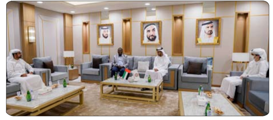
التقى محمد عبدالله هزام الظاهري الأمين العام لاتحاد الإمارات لكرة القدم أمس في مقر الاتحاد بدبي الدكتور حسن محمد عبدالله برفو عضو مجلس إدارة الاتحاد السوداني لكرة القدم، رئيس لجنة المنتخبات الوطنية الذي يزور البلاد حالياً. ونقل برفو تحيات الدكتور كمال

شداق رئيس الاتحاد السوداني إلى الشيخ راشد بن محمد التعيبي رئيس اتحاد الإمارات لكرة القدم عبر رسالة رسمية سلمها إلى الأمين العام. ويحث اللقاء سبل تعزيز التعاون المشترك بين الاتحادين الشقيقين على كافة المستويات الفنية والإدارية وتبادل الخبرات، من خلال إقامة الدورات والورش التدريبية المشتركة،