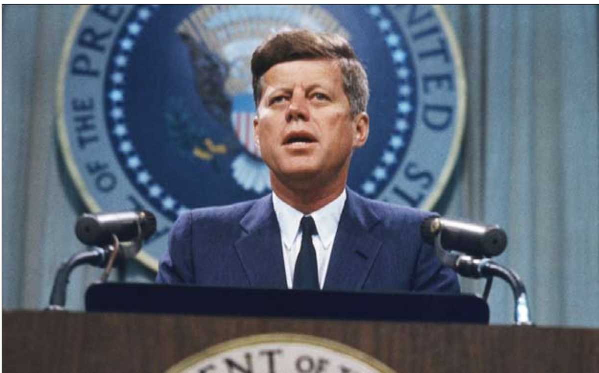
كينيدي.. ترتيب متقدم لفترة حكم قصيرة

على العكس من ذلك، فإن ليندون جونسون، خليفته، يحتل المركز الحادي عشر رغم أنه ساعد في تعزيز الحقوق المدنية وسمح بإنشاء برامج اجتماعية رئيسية للرعاية الطبية / ميديكيد. ولئن كانت إدارته السيئة للغاية لحرب فيتنام قد شابت السنوات