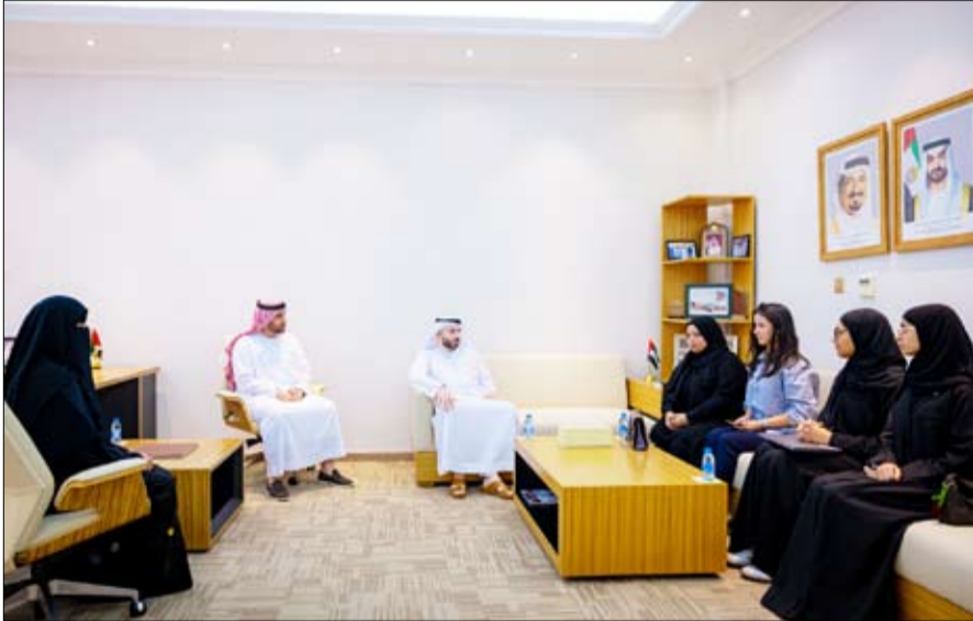
يسهم في تنمية مهارات الطلبة، وتعزيز مشاركتهم في استشراف مستقبل قطاع النقل، وتطوير الحلول الذكية والمستدامة. وقالت إن الاستثمار في عقول الأجيال القادمة يمثل ركيزة أساسية في بناء مستقبل قطاع النقل، وتطوير