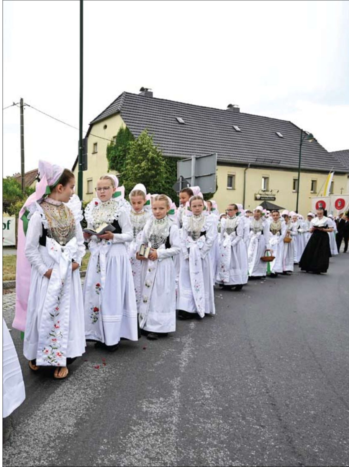
فتيات يرتدين الملابس التقليدية ويشاركن في موكب كوربوس كريستي السنوي في كروستويتز، ألمانيا.

وفي شكلها الإضافي، تستخدم النترتير بشكل أساسي في تلوينها وتأثيراتها المضادة للميكروبات والمنكهات لأنواع عديدة من اللحوم والأسماك ومنتجات الجبن.