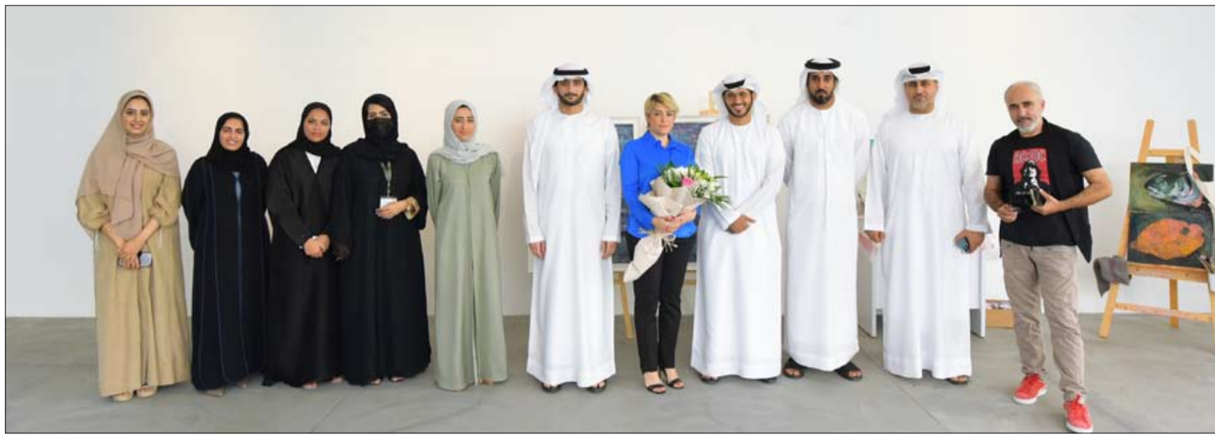
معرض "التبدل والتحول" يفتح أبوابه أمام الجمهور في مكتبة الصفا