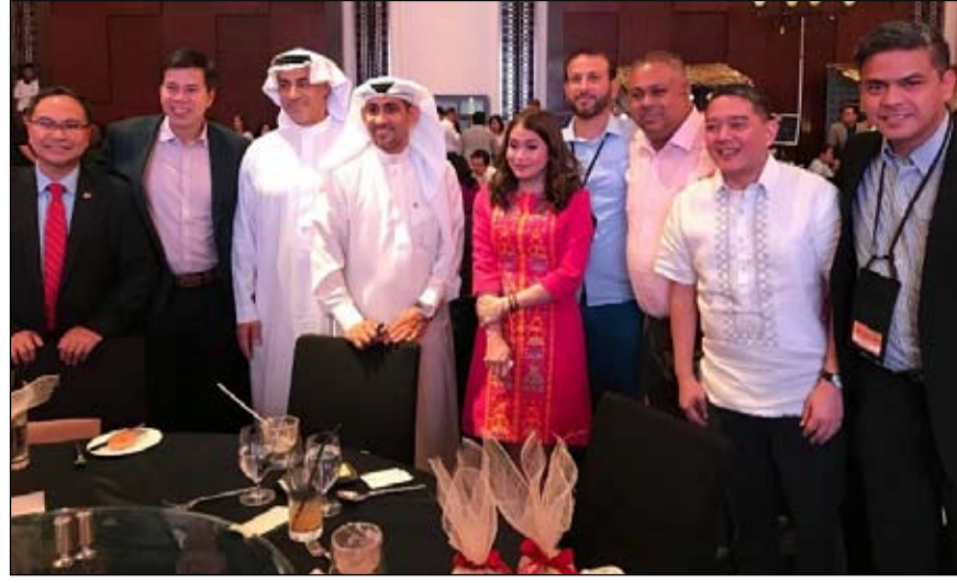
الفلبين تستضيف وكلاء السفر الراندين أثناء فعاليات «ذا فلبين ترافل أكستشينج»

وكان لافتاً النشاط الذي شهدته القطاع التجاري "الجملة والتجزئة" منذ بداية العام الجاري فقد وصل الرصيد التراكمي للتمويلات التي حصلت عليها من البنوك إلى نحو 157 مليار درهم مع نهاية شهر يونيو الماضي بزيادة قدرها 4.5 مليار درهم بالمقارنة مع شهر ديسمبر الماضي. ووصلت نسبة مشاركة القطاع في الناتج المحلي الإجمالي غير النقطي بالأسعار الثابتة 16.6% نهاية العام الماضي وهو ما يعد مؤشراً على الأهمية التي يحظى بها في دعم الاقتصاد الوطني وتنوع قاعدة الدخل لدولة الامارات بشكل عام.