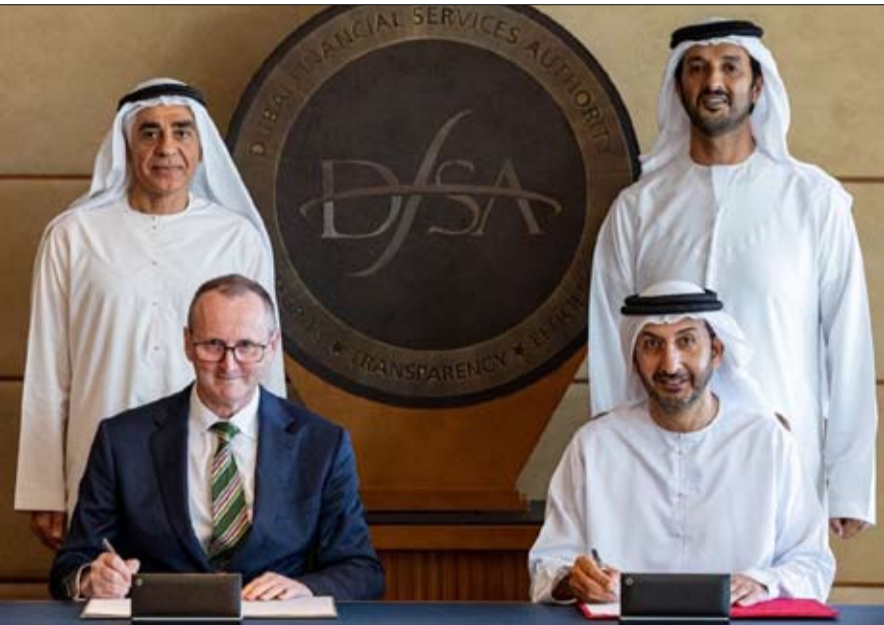
تبادل المعلومات، والتنسيق في تعزيز منظومة متكاملة للخدمات المالية تتسم بالمرونة والشفافية وداعمة للنمو في مركز دبي المالي العالمي، وإمارة دبي، ودولة الإمارات العربية المتحدة.