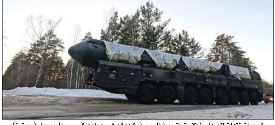
تدريبات لقوات الصواريخ الاستراتيجية الروسية في موقع غير معلوم في سيبيريا، روسيا.

عواصم-وكالات: ذكرت وزارة الدفاع الروسية أمس أن قوات الصواريخ الاستراتيجية أعدت تدريبات في سيبيريا تضمنت تحركات موهمة لصواريخ (بارس) الباليستية العابرة للقارات، والقادرة على حمل رؤوس نووية. وقالت الوزارة إن الطواقم تدربت على مجموعة من الأنشطة، بما في ذلك استخدام التموه والإخفاء لحجب تحركات الصواريخ التي تنطلق من الأرض في الميدان. وتدربوا أيضاً على التصدي لهجمات معادية افتراضية ومواجهة أسلحة الهجوم الجوي. ولم تعلن الوزارة عن أي عمليات إطلاق صواريخ وتجري روسيا تدريبات منتظمة لقواتها النووية الاستراتيجية لاختبار جاهزيتها