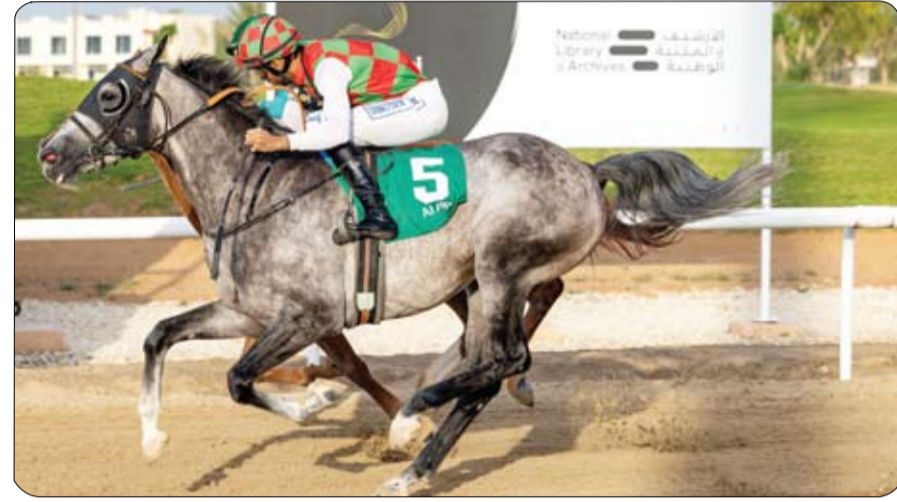
متري أيضاً، للخيول عمر 4 سنوات فما فوق، وجوائزها 40.000 درهم. ويتطلق الشوط الثالث لمسافة 2000 متر، للخيول عمر 4 سنوات فما فوق، وجوائزها 70.000 درهم. كما تتنافس الخيول عمر 4 سنوات 1800 متر، وجوائزها 80.000 درهم.

وتشارك الخيول عمر 5 سنوات فما فوق، (إنتاج الإمارات)، والتي لم تقم بسباقين في الشوط السادس لمسافة 1600 متر، وجوائزها 80.000 درهم. وتم تخصيص الشوط السابع (أ) لمسافة 1400 متر، للخيول عمر 4 سنوات فما فوق، (إنتاج الإمارات)، وجوائزها 40.000 درهم، بينما شارك في الشوط الثامن (ب) لمسافة 1400 متر أيضاً، الخيول عمر 4 سنوات فما فوق، (إنتاج الإمارات) وجوائزها 40.000 درهم. وتتجه الأنظار إلى الشوط التاسع لمسافة 1000 متر، بمشاركة الخيول عمر 4 سنوات فما فوق، للمنافسة على لقب سباق العين للسرعة، وجوائزها 100.000 درهم.