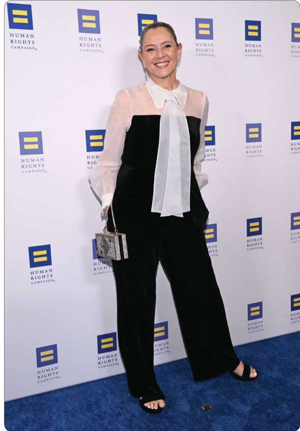
التمثلة الأمريكية كامرين مانهايم لدى حضورها حفل عشاء حملة حقوق الإنسان لعام 2026 في لوس أنجلوس

في خطوة وصفت بأنها غير مسبقة منذ أكثر من 85 عاماً، كشف تقرير لصحيفة "ديلي ميل" عن بدء أعمال نحت إضافة جديدة إلى جبل راشور الشهير في ولاية ساوث داكوتا الأمريكية، عبر تنفيذ تمثال للرئيس الأمريكي دونالد ترامب إلى جانب الجوهج الأربعة التاريخية الموجودة على الجبل. يشارك في المشروع فريق من النحاتين المثبتين بالبحال، في عملية نحت دقيقة، حيث تُعد هذه الإضافة الأولى منذ عقود طويلة إلى النصب التذكاري الذي يخلد رؤساء الولايات المتحدة الأكثر تأثيراً.