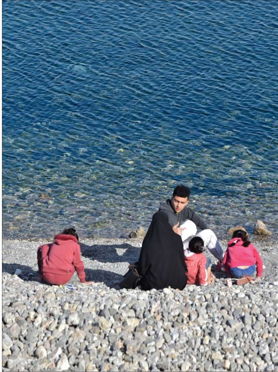
عائلة تجلس على الشاطئ خلال طقس جيد في الجزائر العاصمة

وقالت هيرش: "ليس لدينا الآن فهم أفضل للبيولوجيا العصبية للتوحد والاختلافات الاجتماعية فحسب، بل أيضا للآليات العصبية الأساسية التي تقود الروابط الاجتماعية النموذجية".