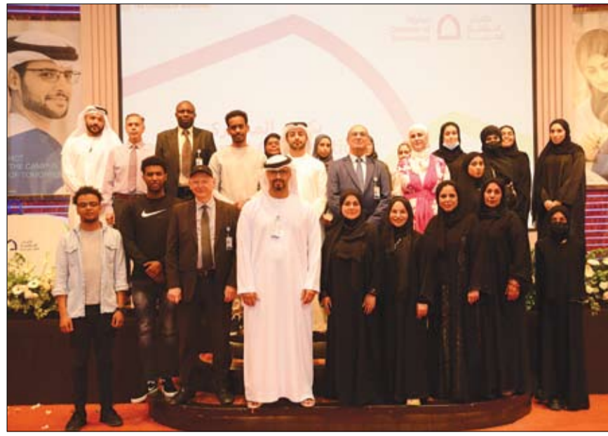
مشاركة كليات التقنية العليا - العين للطالبات