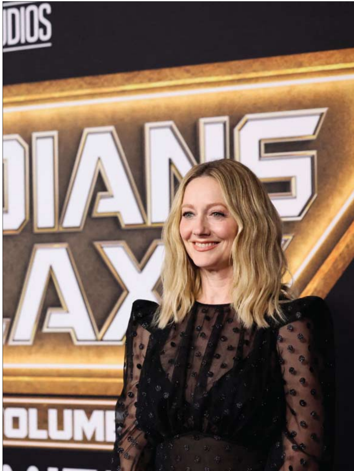
الممثلة جودي جريير تحضر العرض الأول لفيلم 'Guardians of the Galaxy Vol. 3' في لوس أنجلوس.

ورغم أن أفلام الرعب قد تساعد بشكل مؤقت في التخفيف من الشعور بالألم، إلا أن هيئة الخدمات الصحية الوطنية (NHS) توصي بمراجعة الطبيب إذا كنت تعاني من الألم مدة 12 أسبوعا أو أكثر.