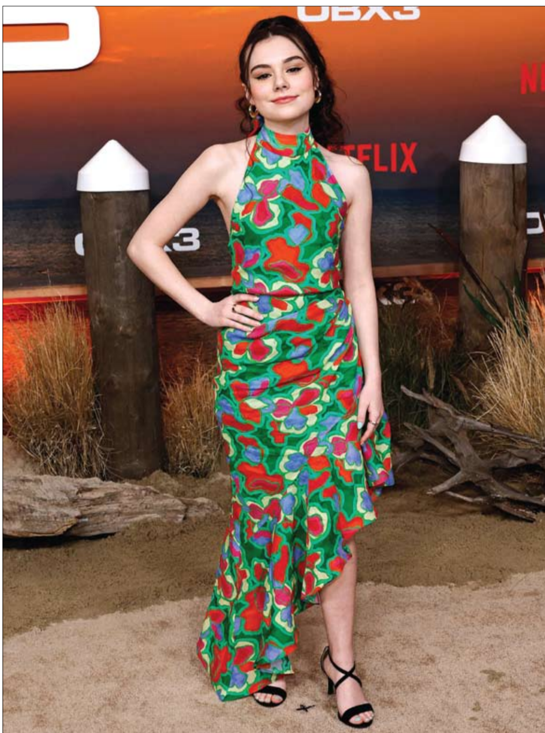
جوليا أنتونيلي لدى حضورها العرض الأول للموسم الثالث من «بنوك خارجية»، في لوس أنجلوس، كاليفورنيا.

ويمكن لفحص التصوير بالرنين المغناطيسي أن يقلل من عدد الرجال الذين يخضعون للخزعات بنسبة 90%. كما يقول مركز سرطان البروستات في المملكة المتحدة. وأضاف باحثون من جامعة كوليدج لندن أن هذا يعطي مؤشراً على حجم الخلية وكثافتها والأوعية الدموية في البروستات لتحديد السرطان بشكل أفضل.