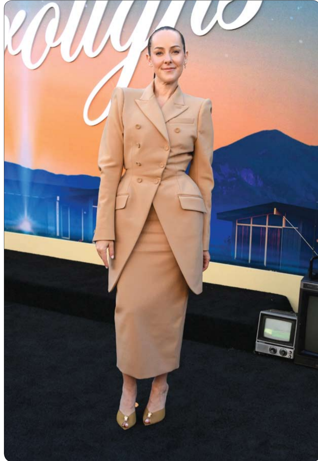
الممثلة الأمريكية جينا مالون لدى حضورها العرض الأول لمسلسل «ذا بوروز، من إنتاج تفتليكس في هوليوود.

تمكنت فرق الإنقاذ في نيوزيلندا من إجلاء أربعة مراهقين جواً إلى بر الأمان، بعد أن ظلوا عالقين طوال الليل في منطقة جبلية نائية إثر فيضانات مفاجئة منعتهم من عبور نهر خلال رحلة تنزه. وأفادت الشرطة النيوزيلندية و فريق البحث والإنقاذ البري، في بيان مشترك، بأن المراهقين، وتتراوح أعمارهم بين 17 و18 عاماً، كانوا في منطقة سلسلة جبال ريتشموند بإقليم تاسمان، عندما اضطروا للتوقف داخل كوخ جبلي بعد أن غمرت المياه المسارات ومنعتهم من مواصلة الرحلة. وبحسب السلطات، قام المراهقون بتنفيذ جهاز تحديد المواقع الشخصي "PLB" صباح الاثنين طلباً للمساعدة، إلا أن سوء الأحوال الجوية حال دون وصول المروحيات في اليوم الأول، ما أجبرهم على قضاء الليل في الموقع.