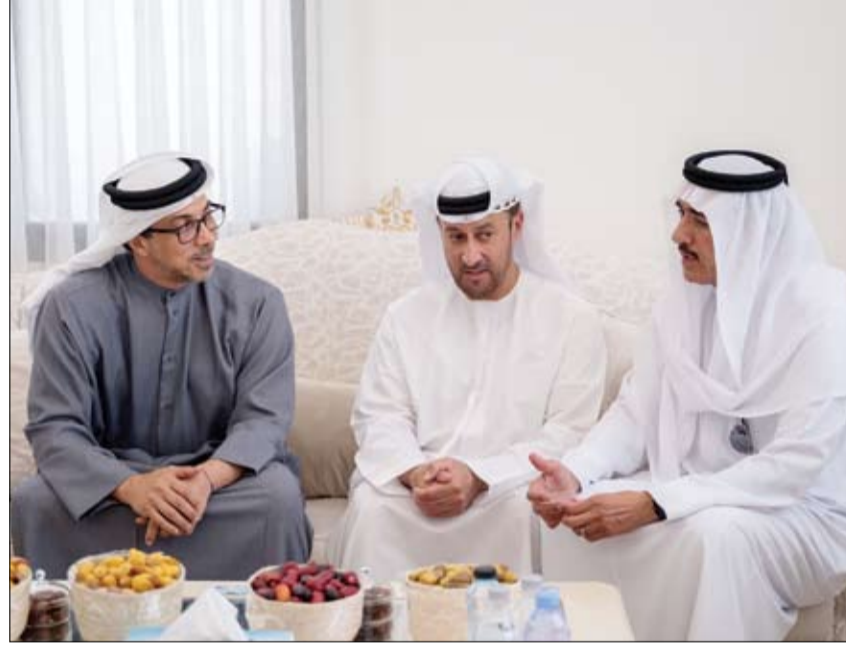
منصور بن زايد خلال تقديمه واجب العزاء إلى أسرة الفقيد عبيد جمعة حميد الزعابي (وام)

طلوع الثريا في سماء الدولة 7 يونيو لمدة 13 يوماً الشارقة- وام: تشهد سماء الدولة في 7 من يونيو الجاري طلوع الثريا من فوق الاقتراف الشرقي، وتسمى الجهة التي تطلع منها نجوم الثريا في ( الديرة ) أو البوصلة الملاحية القديمة بـ (مطلع الثريا) وهي تميل عن الشرق الحقيقي بنحو 25 درجة نحو الشمال . وقال إبراهيم الجروان رئيس مجلس إدارة جمعية الإمارات للفلك عضو الاتحاد العربي لعلوم الفضاء والفلك لوكالة أنباء الإمارات (وام) ، يهتم العرب بموعد طلوع نجوم الثريا فوق الاقتراف الشرقي فجرا حيث تكون علامة على دخول القيظ وشدة حرارة الصيف و تقول العرب القيظ من طلوع الثريا إلى طلوع سهيل والقيظ عند العرب هو وقت شدة الحرارة والجفاف . ووفق أهل الأنواء فإن عدد أيام طالع الثريا 13 يوماً تمتد من 7 حتى 19 يونيو فيما موسم الثريا يشمل طلوع منزلتي الثريا و تابعها الدربران و يمتد بين 7 يونيو إلى 2 يوليو و هو أول موسم القيظ يتلوه موسم الجوزاء و المرزم وهو وسط القيظ و شدة الحرارة والجفاف و أخيراً موسم الكليبيين وفيه تشتد الرطوبة مع الحرارة العالية فيكون الجو مجهداً وينشط الكوس وهي الرياح الجنوبية الشرقية الرطبة والمتدلة الحرارة ثم تنكسر شدة الحرارة و ينجلي القيظ في نهايته مع طلوع نجم سهيل نهاية أغسطس. و خلال موسم الثريا تتعامد أشعة الشمس على مدار السرطان لتصل الشمس لأقصى ميل لها شمالاً مع الانقلاب الصيفي في 21 يونيو ويضمحل ظل الزوال وينعدم عند مدار السرطان ( حيث المناطق الجنوبية من الدولة ) و يبلغ النهار أقصى طول له والليل أدنى قصر له في النصف الشمالي من الأرض وعند أهل الزراعة يمتد القيظ -الصبيف هو موسم حصاد وجني ثمار النخيل يقال قيظت النيد أو (قيظت العين) أي نضج الرطب وعندهم قد قيظت مناطق قبل مناطق أخرى.