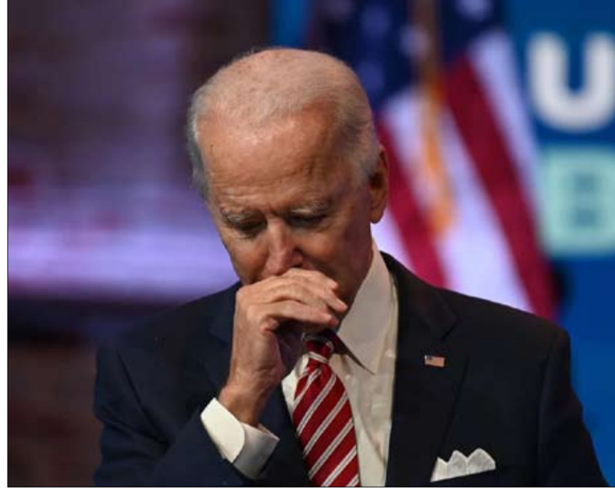
بايدن والهاجس الروسي

إعادة إطلاق المواجهة الخطابية يمكن أن تزيد من شعبية بوتين لدى ناخبيه