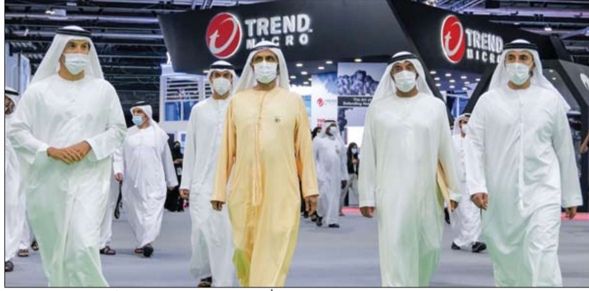
محمد بن راشد خلال زيارته معرض جيكس بدورته الأربعين في مركز دبي التجاري العالمي