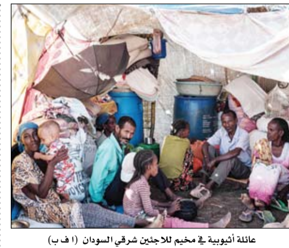
عائلة أثيوبية في مخيم للاجئين شرقي السودان

صرح رئيس مجلس السيادة الانتقالي السوداني عبد الفتاح البرهان أمس الأربعاء أن الحكومة الانتقالية فشلت في تحقيق طموح الجماهير بعد مرور عام على تشكيلها. ونقلت وكالة الأنباء السودانية الرسمية (سونا) عن البرهان قوله في ختام مناورة عسكرية للجيش السوداني شمال العاصمة الخرطوم مضي عام على تكوين مجلس السيادة الانتقالية (مجلس السيادة والوزراء) وقد عجزت عن تحقيق طموحات وتطلعات جماهير ثورة ديسمبر المجيد. وأضاف أن معاناة المواطنين ومجلس السيادة الانتقالي هو أعلى هيئة تنفيذية في السودان مؤلفة من مدنيين وعسكريين ومهمتها إدارة البلاد في الفترة الانتقالية التي تلت اطاحة عمر البشير في نيسان أبريل 2019. ويعاني المواطنون السودانيون من تردى الأوضاع الاقتصادية إذ ينتظرون في طوابير لساعات للحصول على رغيف الخبز ووقود السيارات. كما بلغ معدل التضخم وفق احصاءات رسمية 230%. وشدد البرهان على مواصلة العمل لتشكيل مجلس شركاء الفترة الانتقالية الذي رفضه مجلس الوزراء في نهاية الأسبوع