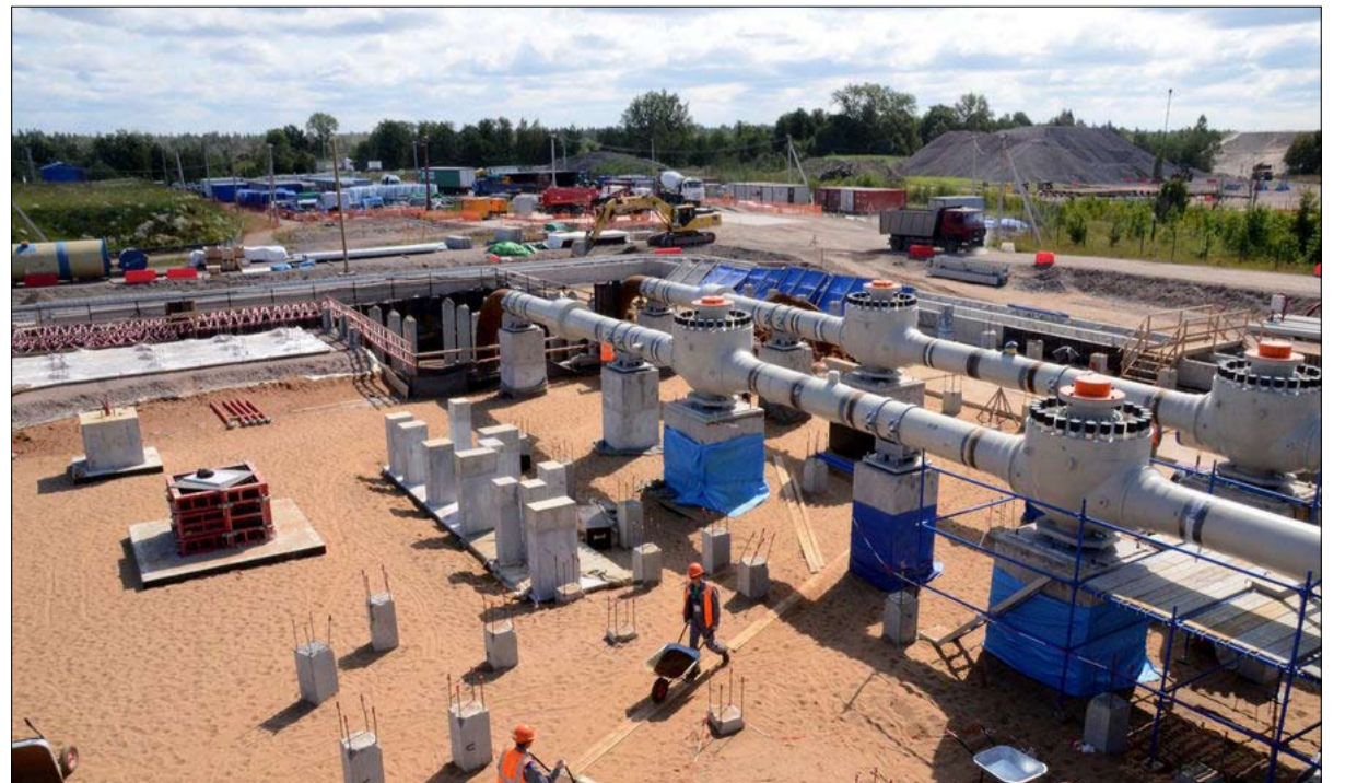
نورد ستريم 2 رهان آخر بين الدولتين