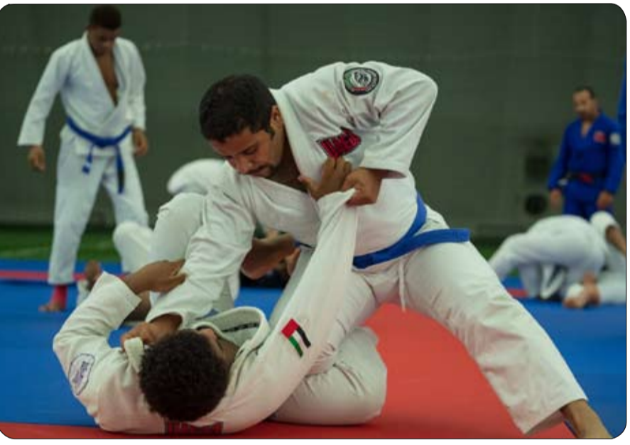
وأضاف الظاهري: «مرحلة للجوجيتسو لم تتوقف حتى خلال التخطيط لدى اتحاد الإمارات أكثر الظروف تعقيداً، بل على فريق عمل الاتحاد من الابتكار

•• أبو ظبي-الفجر أعلن اتحاد الإمارات للجوجيتسو عن تنظيم بطولة الاتحاد للجوجيتسو في الـ 19 من ديسمبر الجاري في جوجيتسو أرينا بمدينة زايد الرياضية، وأتت البطولة في أعقاب إعلان الاتحاد عن أجندة الموسم 2021 وفي إطار وضع المسابقات الأخيرة من قبل الأندية والمدربين على استعدادات اللاعبين لبطولة الموسم الجديد المحلي والدولية. وتشكل البطولة مناسبة جيدة للوقوف على المستوى الفني والبدني للاعبين بعد أن أقر الاتحاد استئناف التدريبات في مركز التدريب التابع