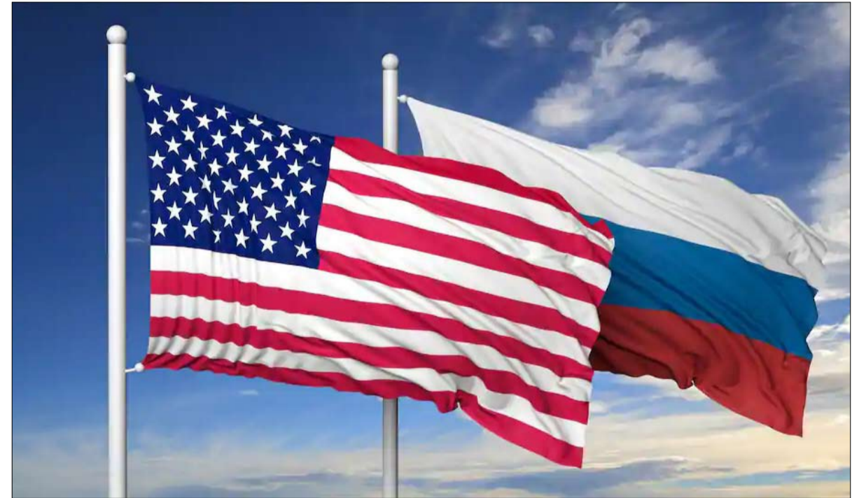
صدام القوتين لا يخدم العالم المضطرب

لا تزال العلاقات الروسية الأمريكية غارقة في الصور النمطية التي تعود إلى «الحرب الباردة»