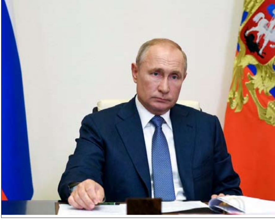
بوتين والقادم الجديد للبيت الابيض

إعادة إطلاق المواجهة الخطابية يمكن أن تزيد من شعبية بوتين لدى ناخبيه