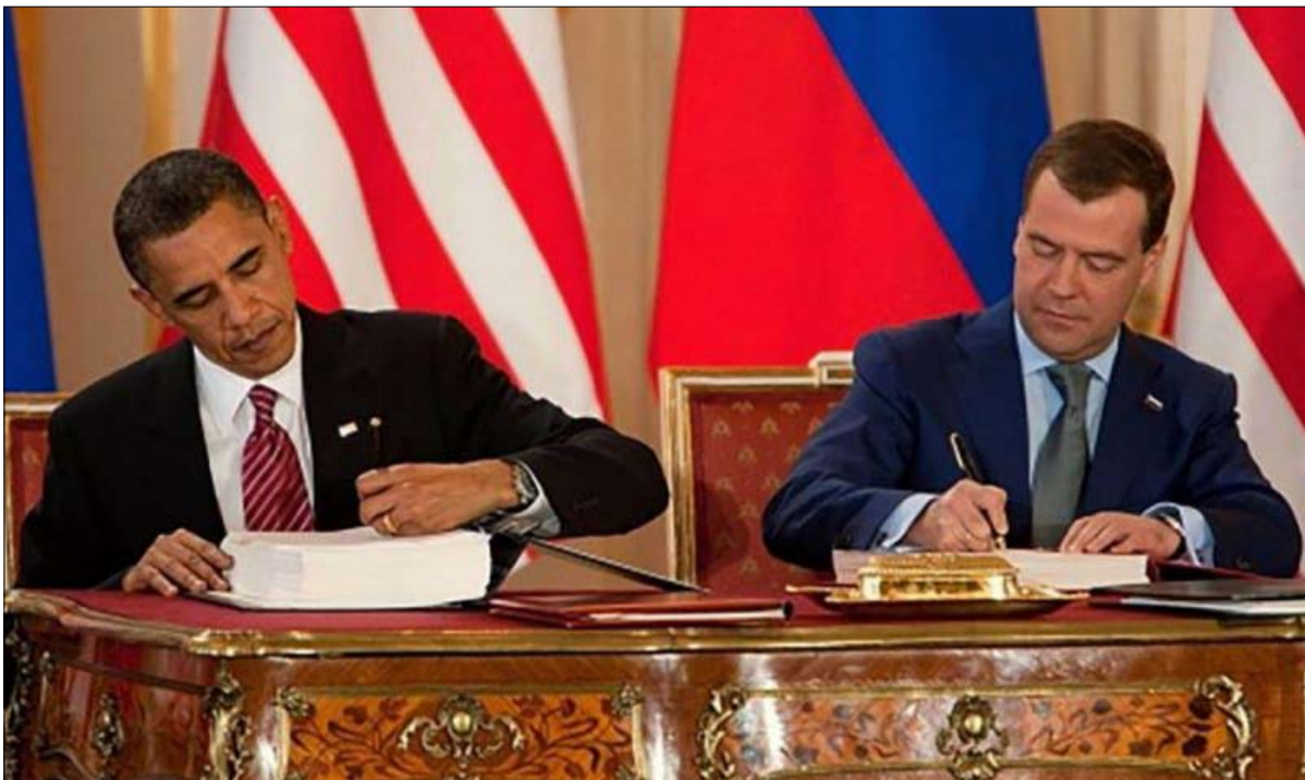
هل تعود الحياة لاتفاق ستارت؟