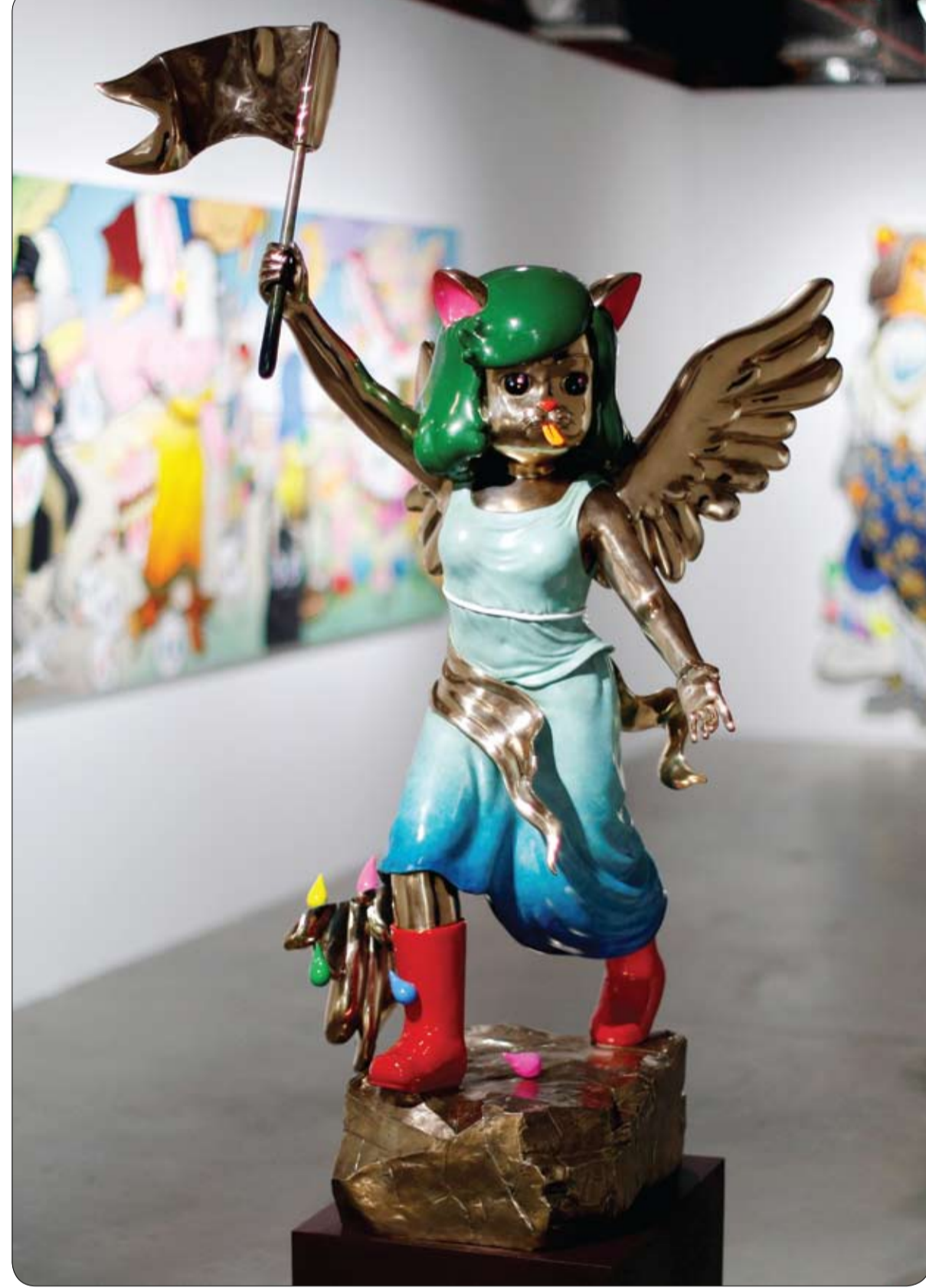
منحوتة الفنانة التاييلاندية يوري كينساكو بعنوان «فيكتوريا المكسورة»، المستوحاة من تمثال انتصار ساموثرائس، شوهدت في معرض في بينالي بانكوك للفنون ، تايلاند.

بعد نقاش فيروس كورونا المستجد، رفض كثيرون ارتداء قناع الوجه الطبي، وفضلوا عوضاً عنه ارتداء الدرع البلاستيكي الذي يغطي الوجه، لكن باحثين خالصوا إلى أن هذه الطريقة غير كافية في الحماية من الوباء، القاتل أحياناً. وقال الباحثون في جامعة فوكوكا اليابانية في دراسة نشرها بدورية "فيزياء السوائل"، إن الدرع البلاستيكي لا يوفر أي حماية للشخص الذي يرتديه في حال علق شخص آخر بقربه، وتحديداً في نطاق متر واحد. واستعان الباحثون بتماذج الحاسوب، لتصوير انتشار قطرات الفيروس على درع الوجه الناتج عن العطس من مسافة متر. وخلال أقل من ثانيتين، اصطدمت قطرات الشخص العطاس بدرع الوجه وحوافه، فيما نغذ بعضها إلى وجه الشخص الذي يرتديه. وكشف الباحثون اليابانيون عن إصابة من كانوا يرتدون دروعاً بلاستيكية فقط بفيروس كورونا، بينما أشارت إلى عدم إصابة أي شخص ارتدى كمامة بالفيروس، حسب رصدتهم. وظهرت المحاكاة الحاسوبية اليابانية أن جميع القطرات العالقة في الجو التي يقل قطرها عن 5 ميكرومتر، وتنتج عند التحدث والتنفس، وراوغت الدرع ووصلت إلى وجه من يرتديه. ونصفت القطرات الأكبر حجماً التي يبلغ حجمها 50 ميكرومتر، المنبعثة من السعال والعطس، وجدت طريقها إلى الهواء، مما يشكل خطراً على الآخرين.