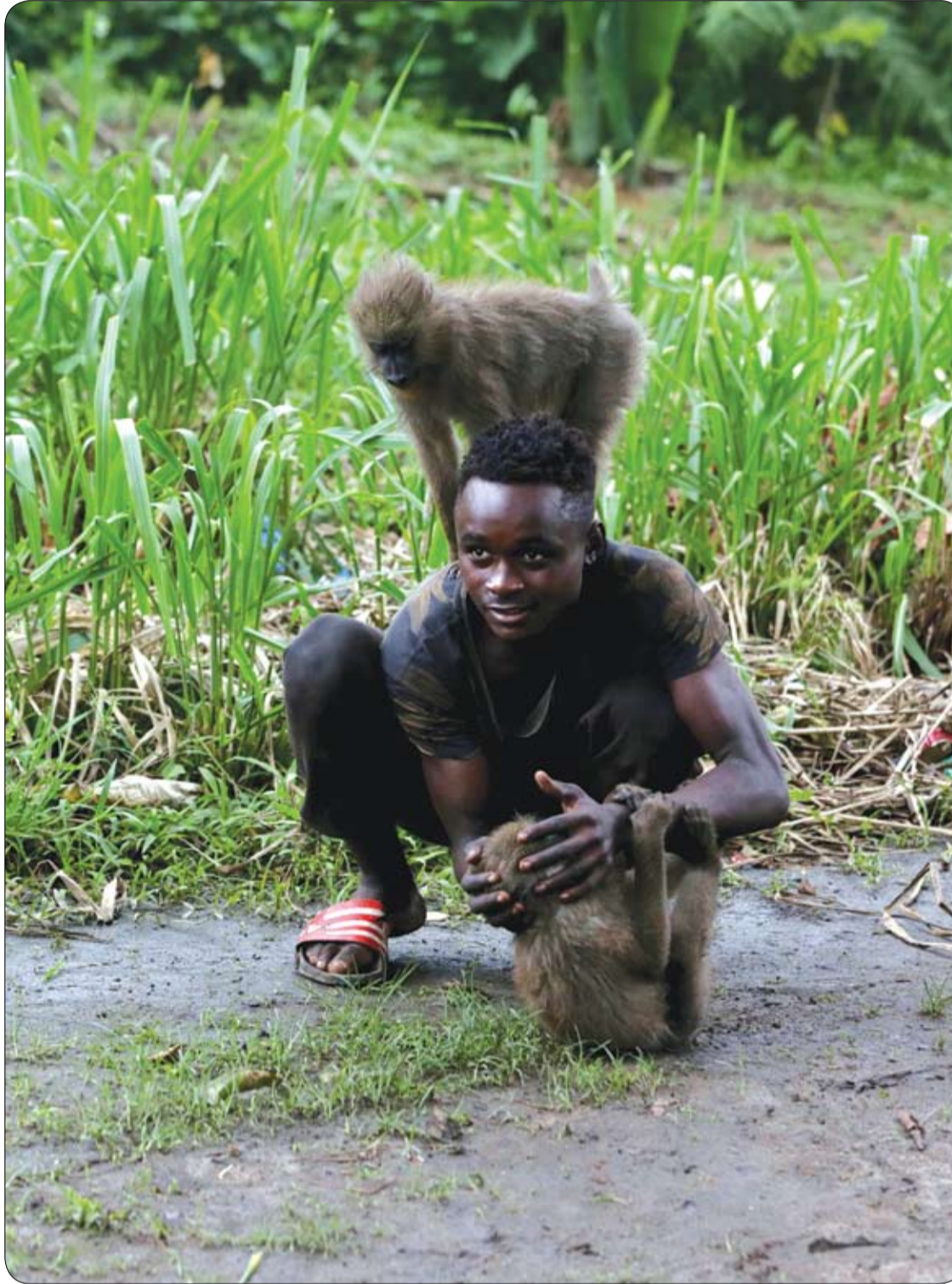
صبي يلعب مع قردين في فناء مسكن خاص بمنطقة مواندا في فرنسا في قلب غابات الجابون 2020.

3- يجب عدم شرب الماء المالح، لأنه يسبب ارتفاعا في مستوى ضغط الدم. ويزيد أعباء الكلى. 4- يمكن للأشخاص الذين يعانون من الإمساك، شرب الماء مع العسل، ويجب أن يكون الماء باردا أو دافئا بعض الشيء، وليس ساخنا جدا. 5- من الأفضل للكثيرين شرب الماء المغلي، لكونه خاليا من السكر والملح ولن يزيد العبء على الكلى والقلب والأوعية الدموية. 6- لا ينصح بشرب الماء البارد جدا أو الساخن جدا. لأن الماء البارد يحفز عمل المعدة والأمعاء، ويسبب تقلص الأوعية الدموية في الغشاء المخاطي للمعدة، ما قد يسبب الألم والإسهال. وأما الماء الساخن جدا، فيلحق الضرر ببطانة المريء الرقيقة، وقد يؤدي هذا إلى الإصابة بالسرطان. كما أن تناول أي سائل حرارية 65 درجة مئوية وأكثر يسبب حرقا. وإذا كان هذا يحصل بصورة دورية منتظمة، فإنه يسبب تلف البنية الطبيعية للخلايا، ما يؤدي إلى تطور الأورام الخبيثة. لذلك لمنع تهيج بطانة المعدة يفضل شرب سائل لا تزيد درجة حرارتها عن 50 درجة مئوية. ودحض الكاتب، الأسطورة القائلة بضرورة تنظيف الأسنان قبل شرب الماء. لأن شرب الماء قبل ذلك يسبب دخول البكتيريا من تجويف الفم إلى الجسم. وهذا وفقا له غير صحيح، لأن البكتيريا موجودة أساسا في الترسبات الجيرية التي تتكون على الأسنان، وهذه لا يمكن إزالتها إلا عن طريق الحك والفرك، وليس للماء قوة احتكاك كافية لإزالة هذه الترسبات، إضافة إلى أن حموضة الأمعاء قادرة على قتل البكتيريا المسببة للأمراض.