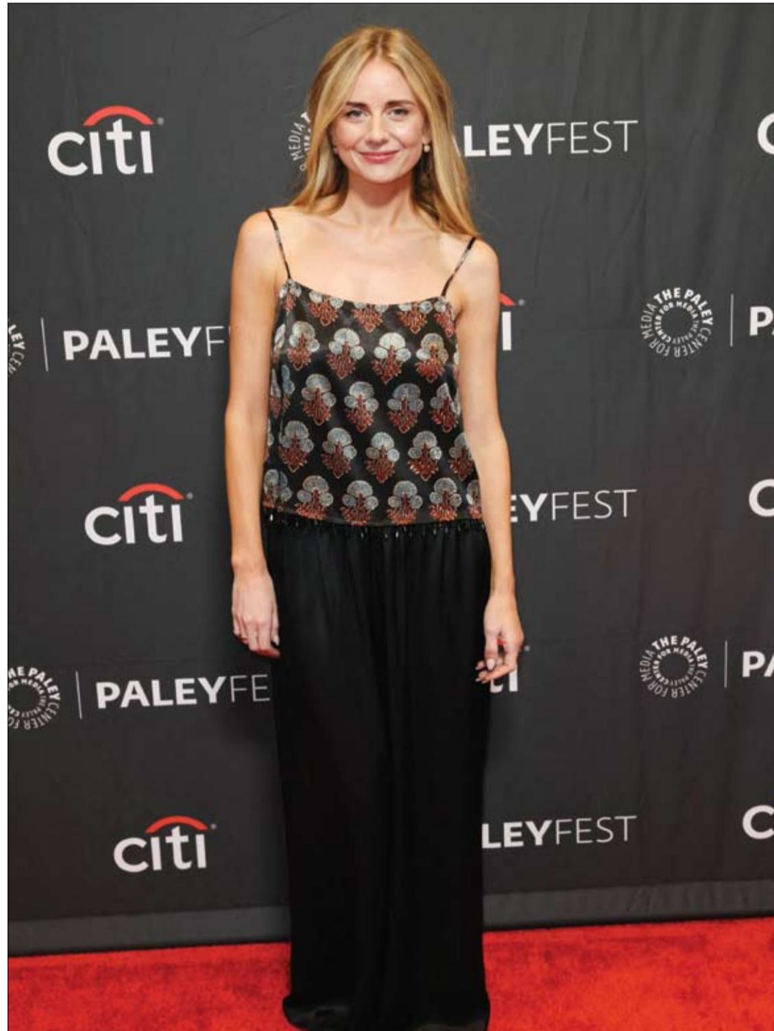
الممثلة الأمريكية جوستين لوب لدى حضورها عرض فيلم 'لا أحد يريد هذا'، من إنتاج نتفليكس خلال مهرجان بالي فست لوس أنجلوس.

وتؤكد نتائج الدراسة أن توقيت تناول الطعام قد يكون عاملا مهما لا يقل أهمية عن نوعية الطعام نفسه.